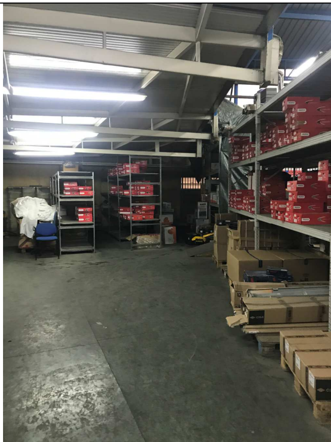
Foto 31 - Sub 2 deposito vendita ferramenta piano primo