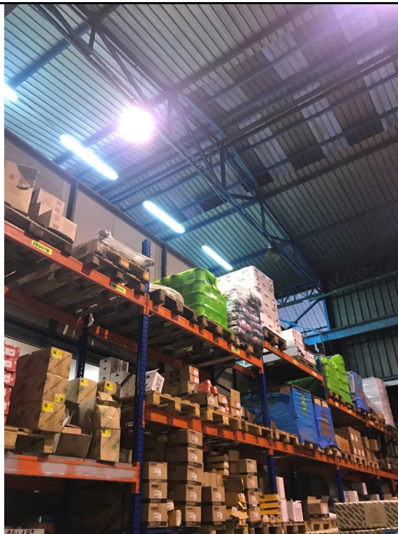
Foto 32 - Sub 2 deposito vendita ferramenta