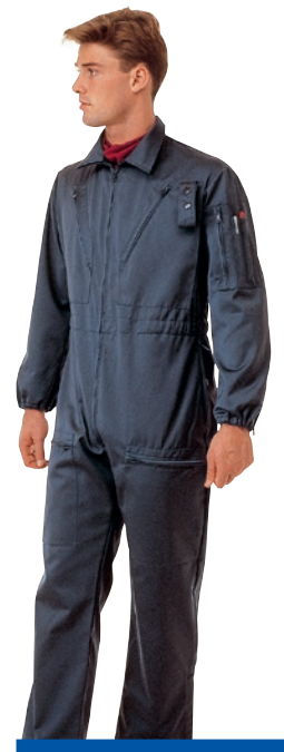
NARITA Tuta pilota. Pilot coverall.

FZPU170090 P0204 - Gabardine, 65% poly 35% cotone G0043