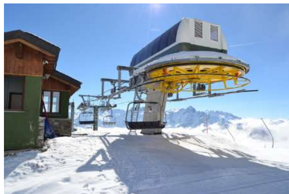
STAZIONE DI ARRIVO

La seggiovia è stata progettata e fornita dalla società Leitner, azienda tra i leader di settore a livello mondiale, le opere civili e il montaggio sono state eseguite dalla soc. BSS l'orditura di impianto prevede una stazione di rinvio e di tensione a valle ed una stazione motrice a monte. Di seguito, si riportano i principali dati tecnici dell'impianto.