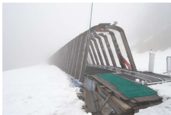
STAZIONE DI ARRIVO