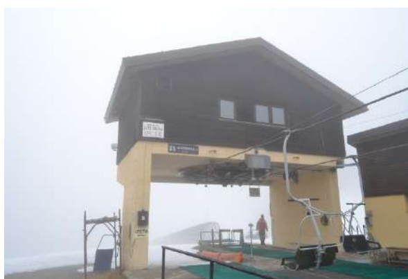
STAZIONE DI ARRIVO

La seggiovia è stata realizzata ed installata dalla società Nascivera; l'orditura di impianto prevede una stazione di rinvio e di tensione a valle ed una stazione motrice a monte.