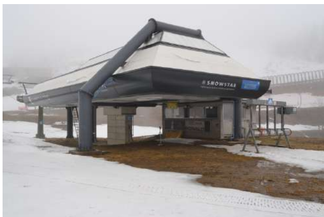
STAZIONE DI PARTENZA

La seggiovia quadriposto ad ammortamento automatico "Carisole – Conca Nevosa" è un impianto asservito al vero e proprio comprensorio sciistico di Carona-Foppolo; infatti in ragione della sua particolare allocazione nell'ambito del comprensorio è fruibile sia dagli sciatori che salgono da Carona che da quelli che salgono da Foppolo.