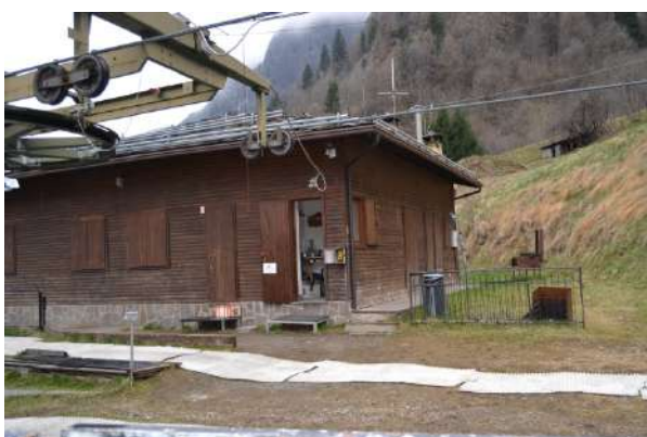
STAZIONE DI PARTENZA

La seggiovia biposto ad ammorsamento fisso “Carona – Alpe Soliva” è un impianto di ingresso al vero e proprio comprensorio sciistico di Foppolo-Carona; infatti la sua funzione è quella di fare accedere gli utenti del comprensorio sciistico che risiedono o che per comodità parcheggiano gli automezzi nel paese di Carona.