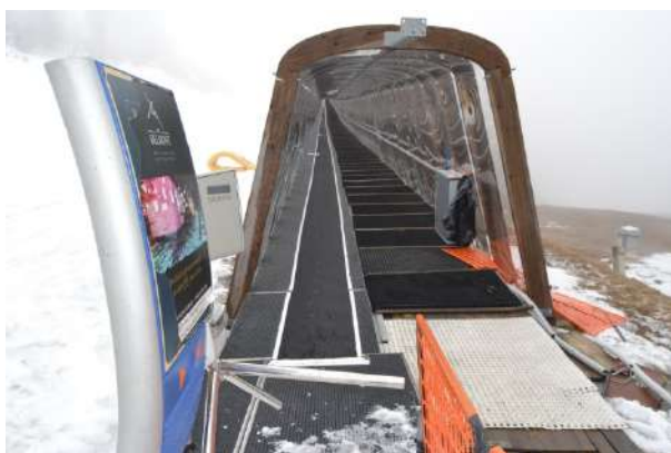
STAZIONE DI PARTENZA

Il tappeto oggetto della presente valutazione è stato fornito della ditta MG e installato dalla BSS, risulta installato in località Carisole, sviluppa una lunghezza complessiva di mt. 240,00 ed è coperto con lastre in policarbonato ancorate a struttura in legno lamellare; la sua funzione nell'ambito del comprensorio sciistico e di impianto per sciatori principianti – campo scuola.