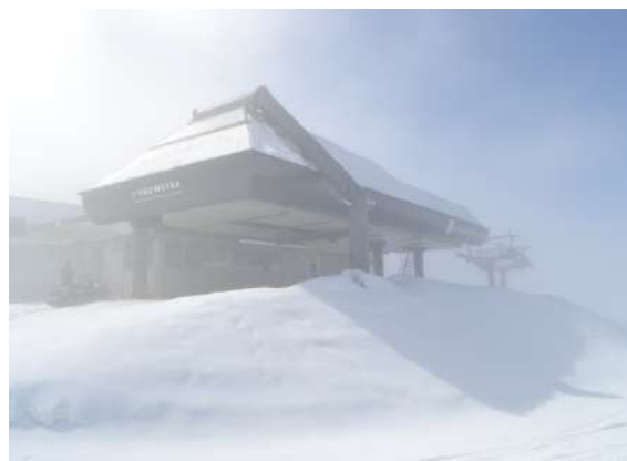
STAZIONE DI ARRIVO

La seggiovia è stata realizzata in origine dalla società Doppelmayr in seguito riprogettata e riposizionata dalla Soc. Snow Star; l'orditura di impianto prevede una stazione di rinvio e di tensione a valle ed una stazione motrice a monte.