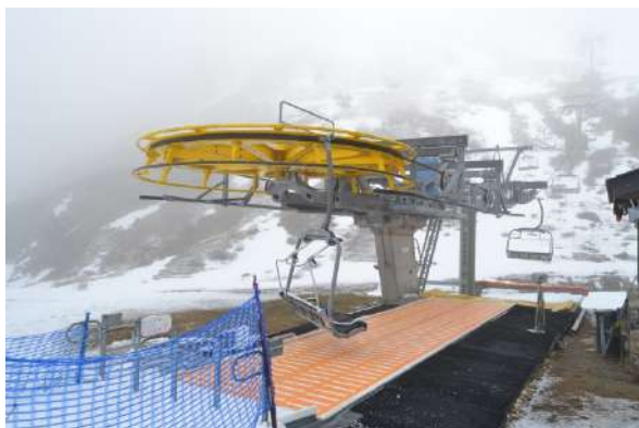
STAZIONE DI PARTENZA

La seggiovia quadriposto ad ammassamento fisso "Carisole – Valgussera" è un impianto asservito al vero e proprio comprensorio sciistico di Carona-Foppolo; in ragione della sua particolare allocazione nell'ambito del comprensorio è fruibile sia dagli sciatori che salgono da Carona che da quelli che salgono da Foppolo.