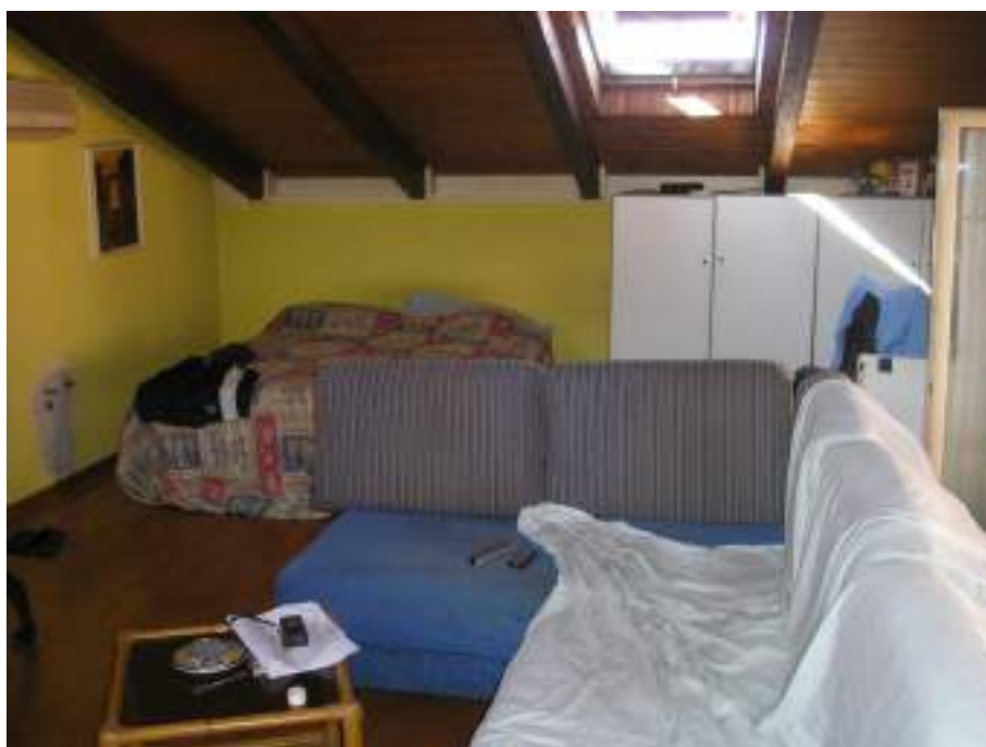
10. Vano sottotetto