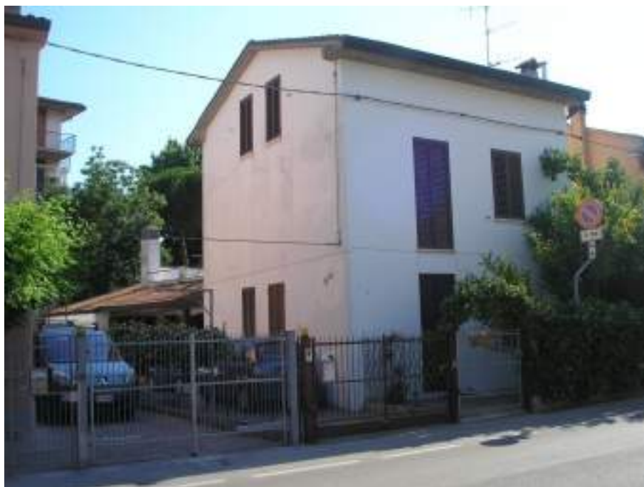
1. Accesso dalla strada