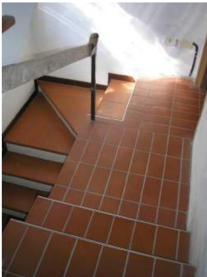
9. Rampa piano primo al sottotetto