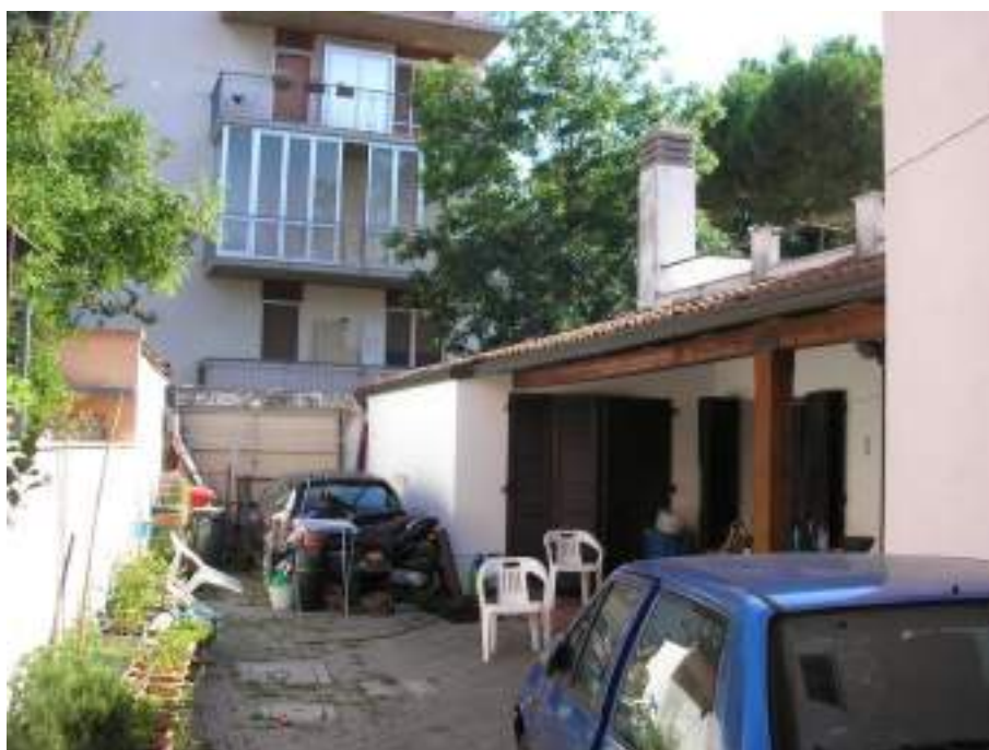
2. Corte comune con posto auto esclusivo