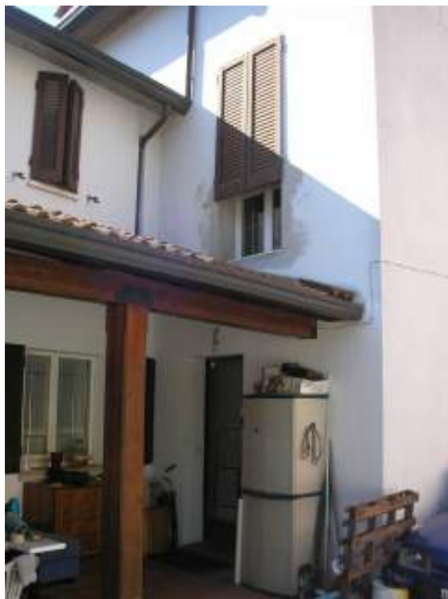
3. Ingresso all'abitazione