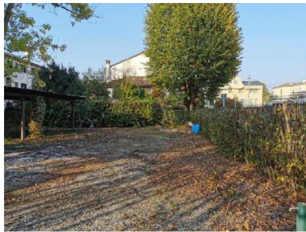
Foto n. 18-19-20-21_ Panoramiche area esterna di pertinenza