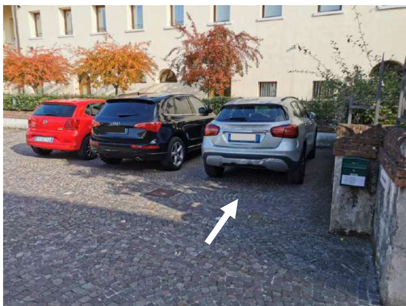
Foto n. 22_ Panoramica posto auto scoperto