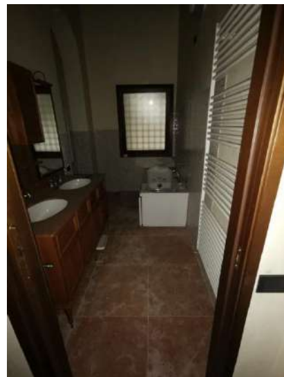
Foto n. 4-5-6-7-8-9-10_ Panoramiche interne abitazione - piano terra