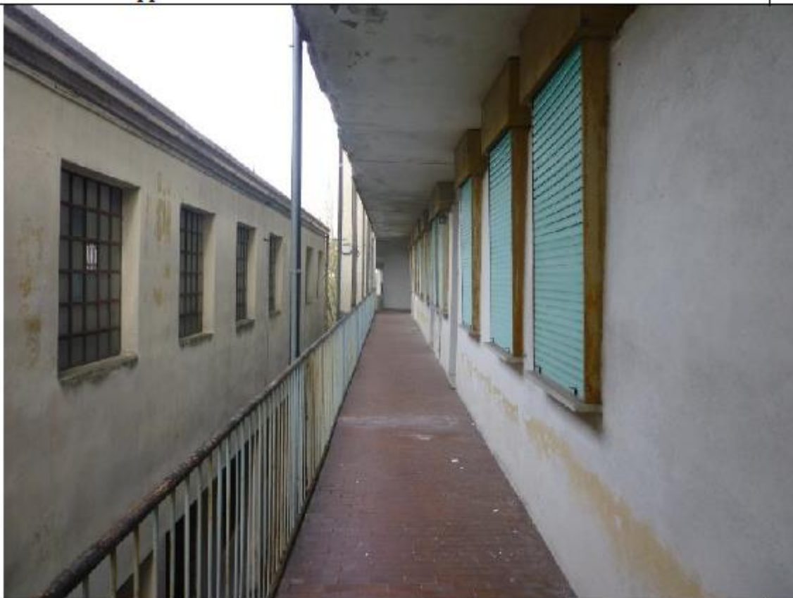
Vista appartamento ringhiera