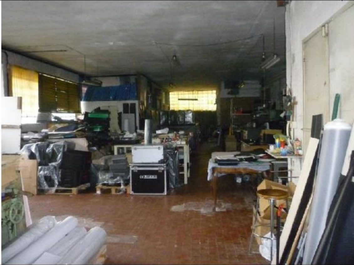
Vista capannone sub 20