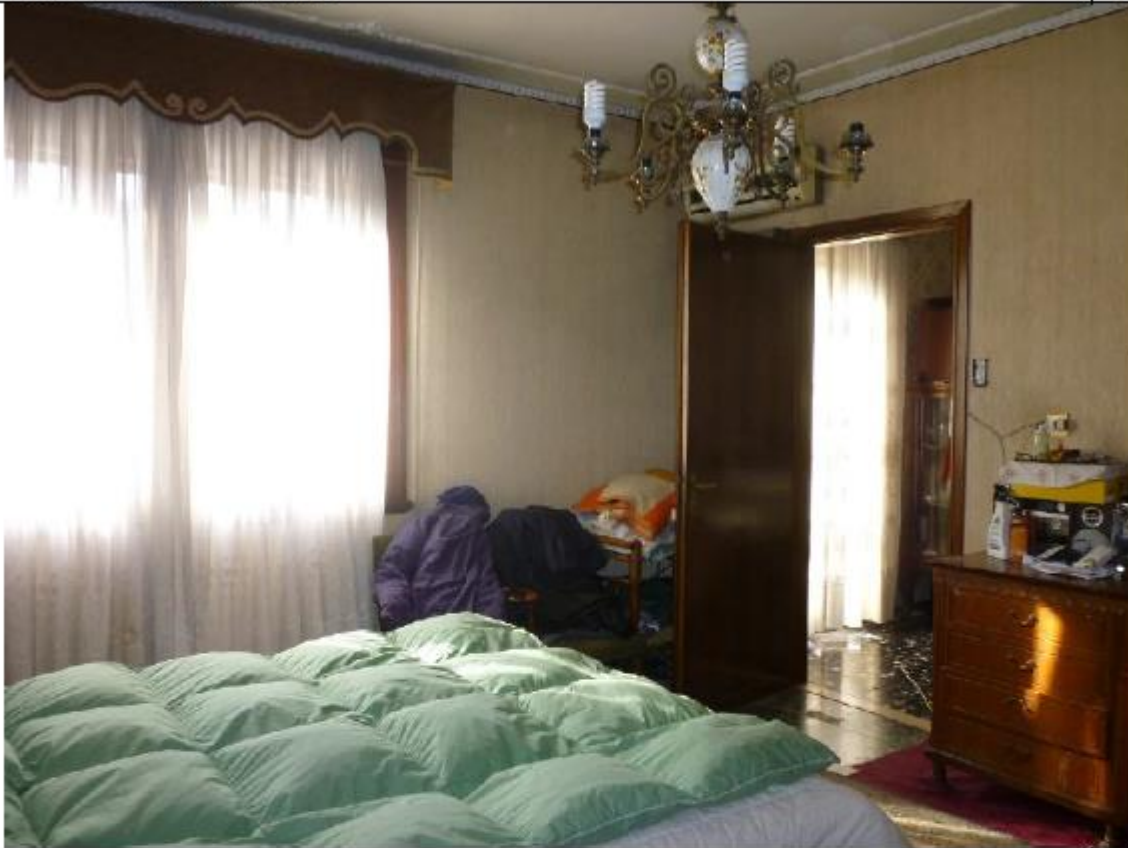
Vista abitazione padronale