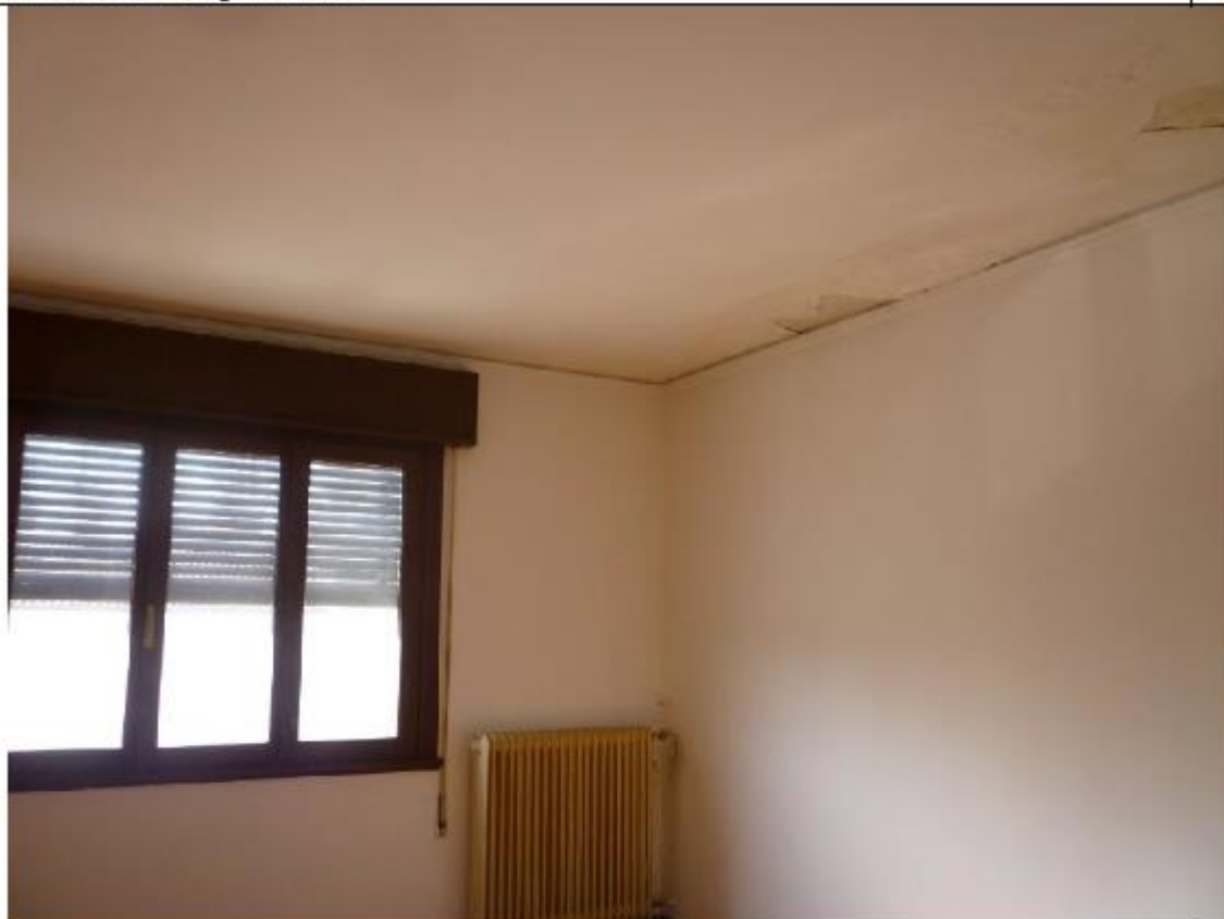
Vista abitazione padronale