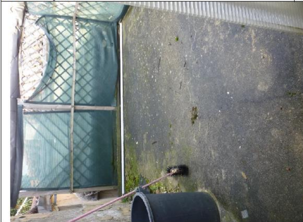
Vista terrazza posteriore