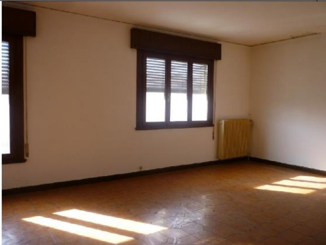
Vista abitazione padronale