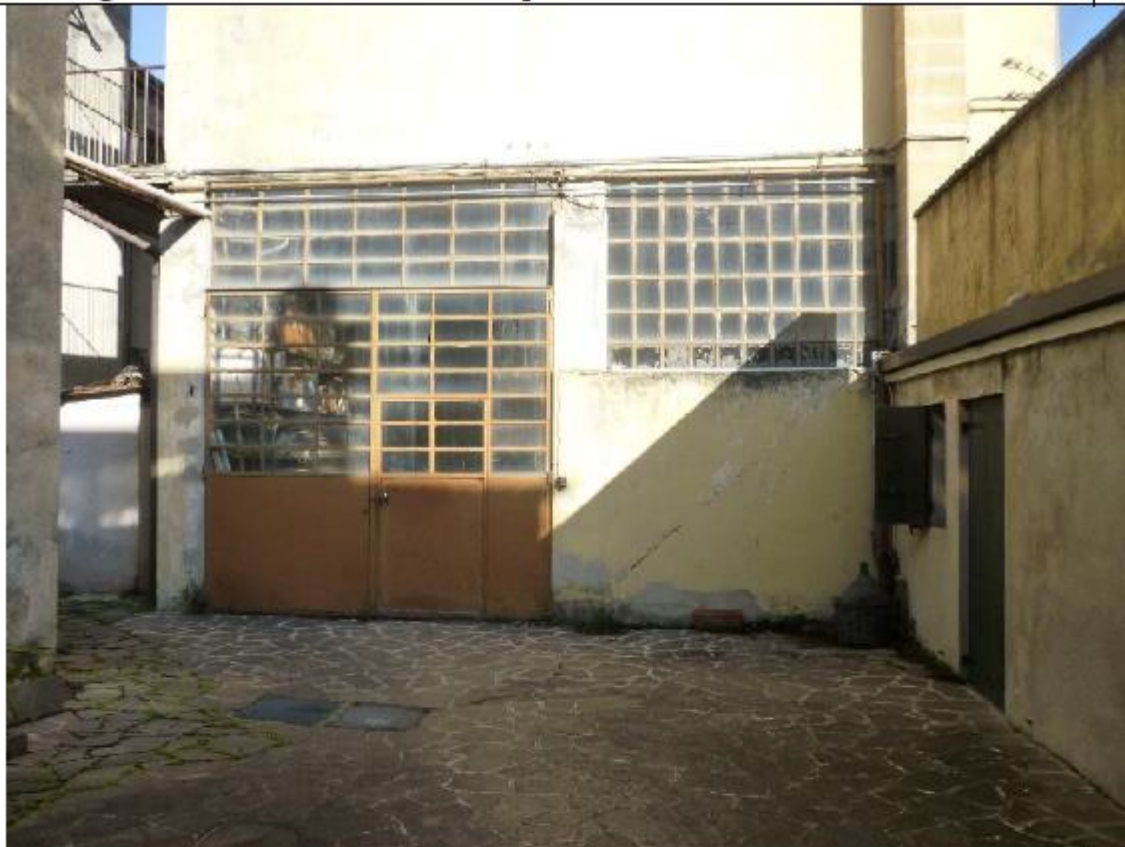
Vista corridoio di passaggio fra corte negozio sub 22 e capannone sub 23