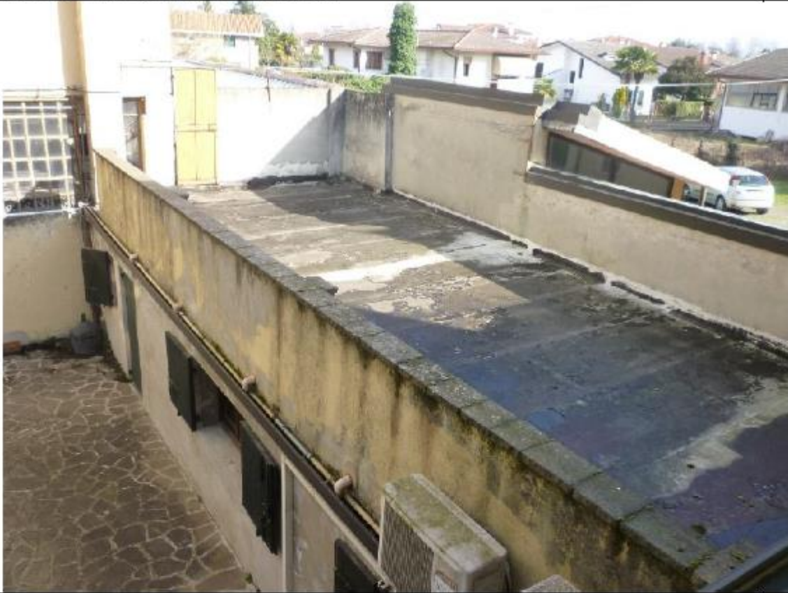
Vista corte pertinenziale negozio sub 22