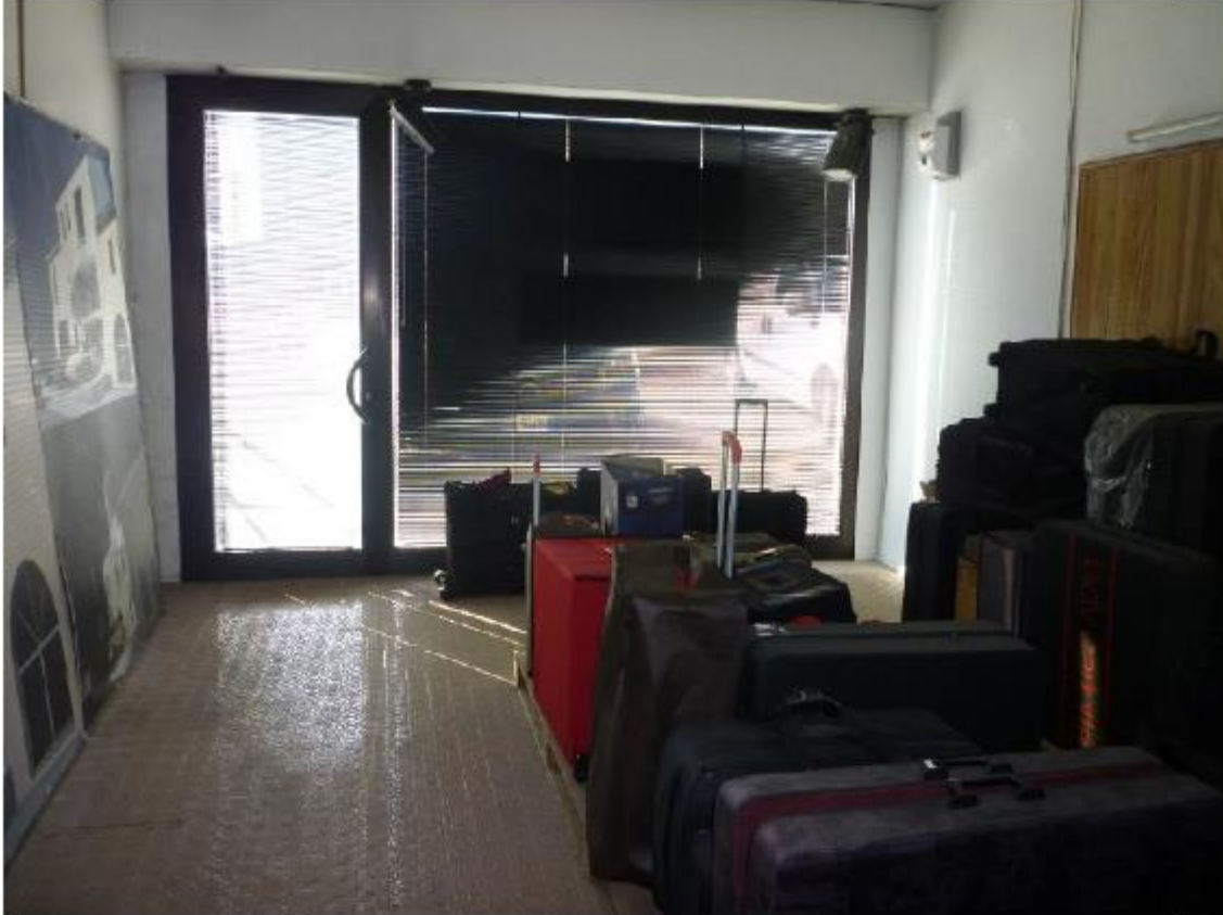
Vista capannone sub 20