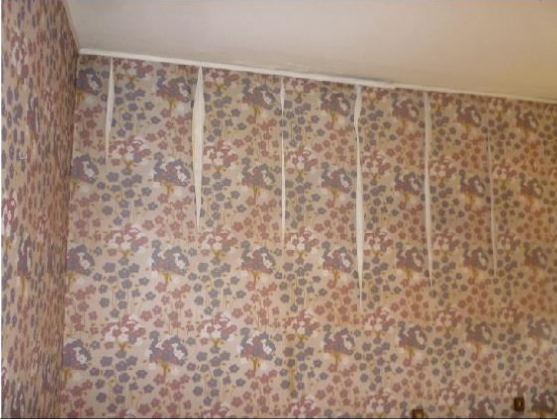
Vista abitazione padronale