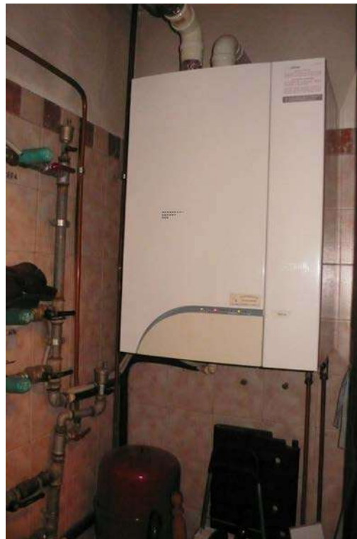
Foto n. 13– VANO SERVIZI DELL'UNITA' Fg. 7 m. 61/sub. 15 pignorata ove è alloggiata CALDAIA COMUNE, servente le due unità residenziali pignorate: fg. 7 m. 61/subb. nn. 6 e 20 SERVITU' DI FATTO