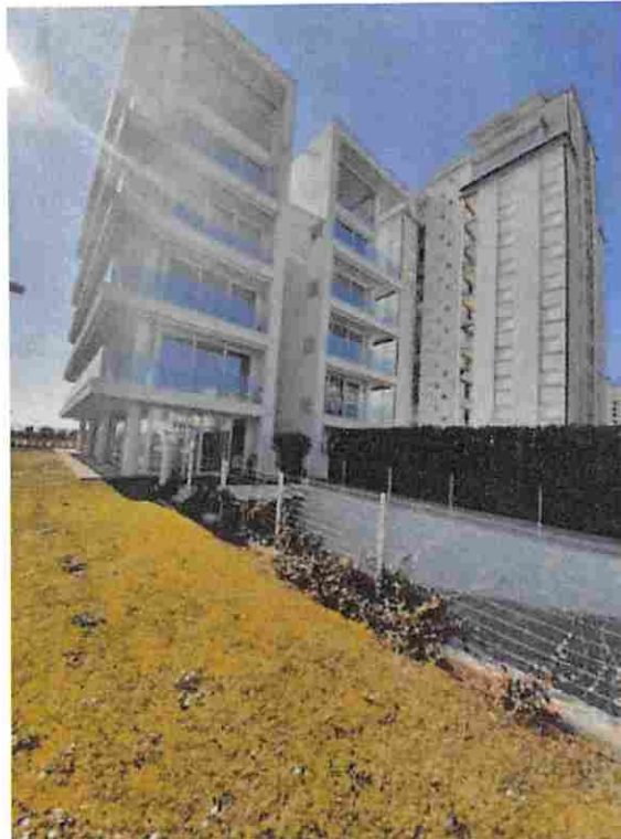
foto n. 1 - vista rampa esterna da via Treviso