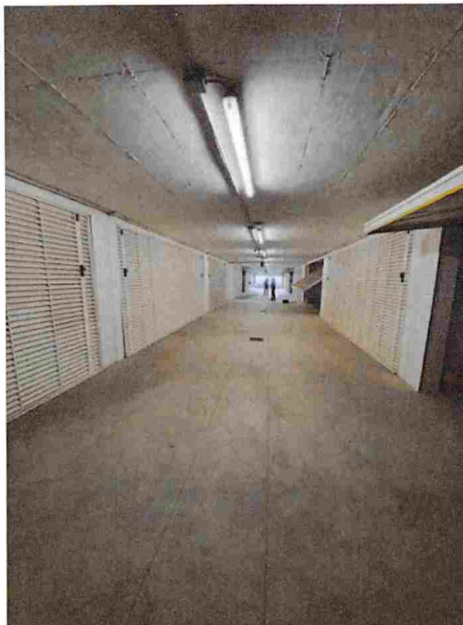
foto n. 3 - vista su corsia piano interrato