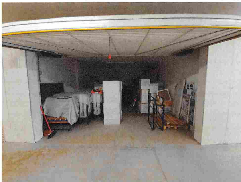
foto n. 4 - vista garage