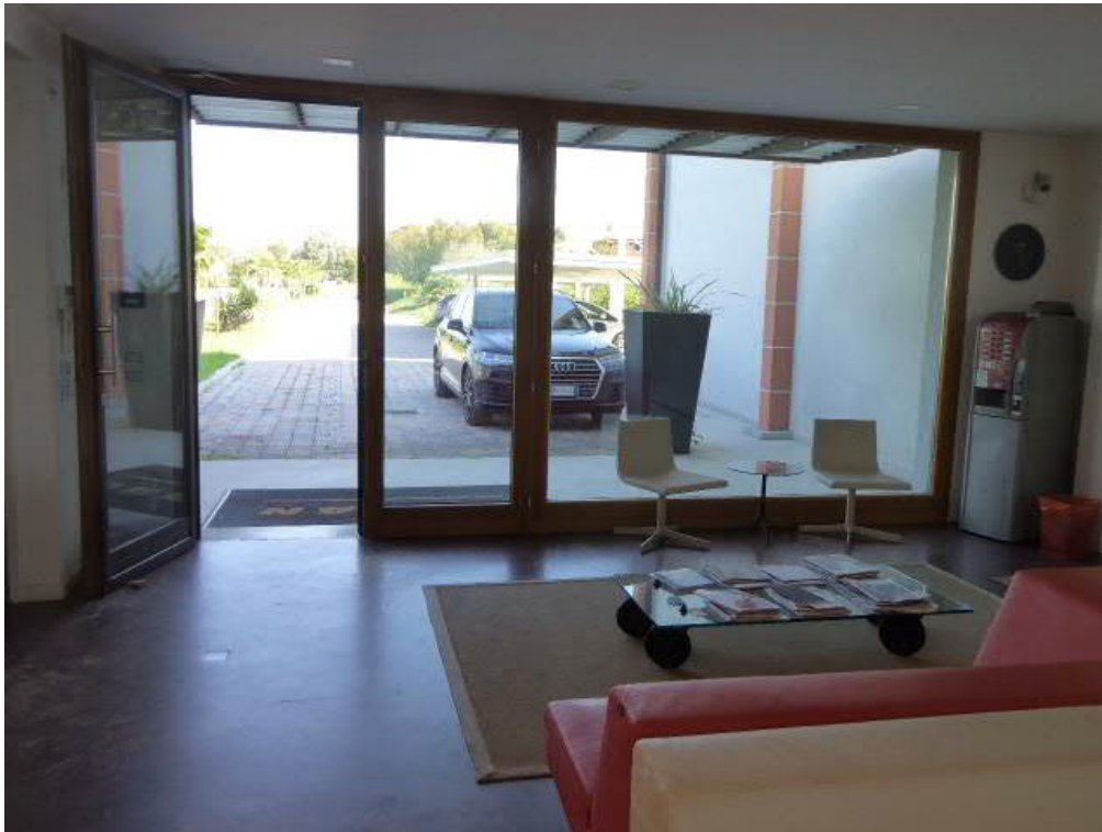
Foto n. 13 – piano terra ingresso corpo centrale (vano ad destinazione magazzino) -