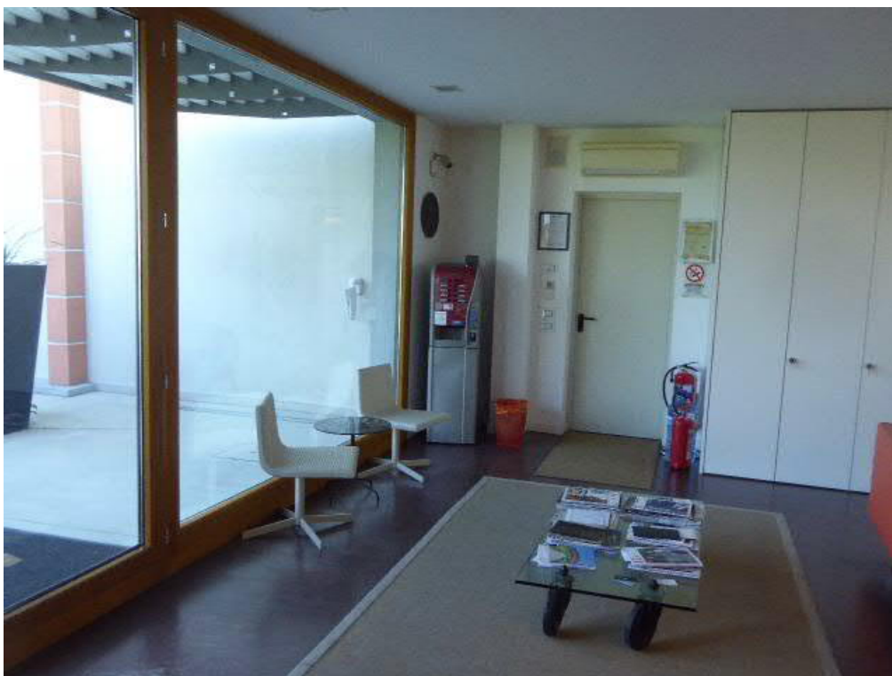
Foto n. 14 – piano terra ingresso corpo centrale (vano ad destinazione magazzino) -