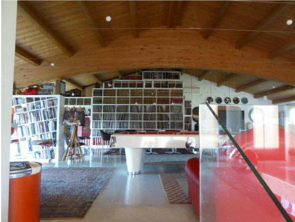
Foto n. 23 – corpo centrale piano primo a destinazione archivio -