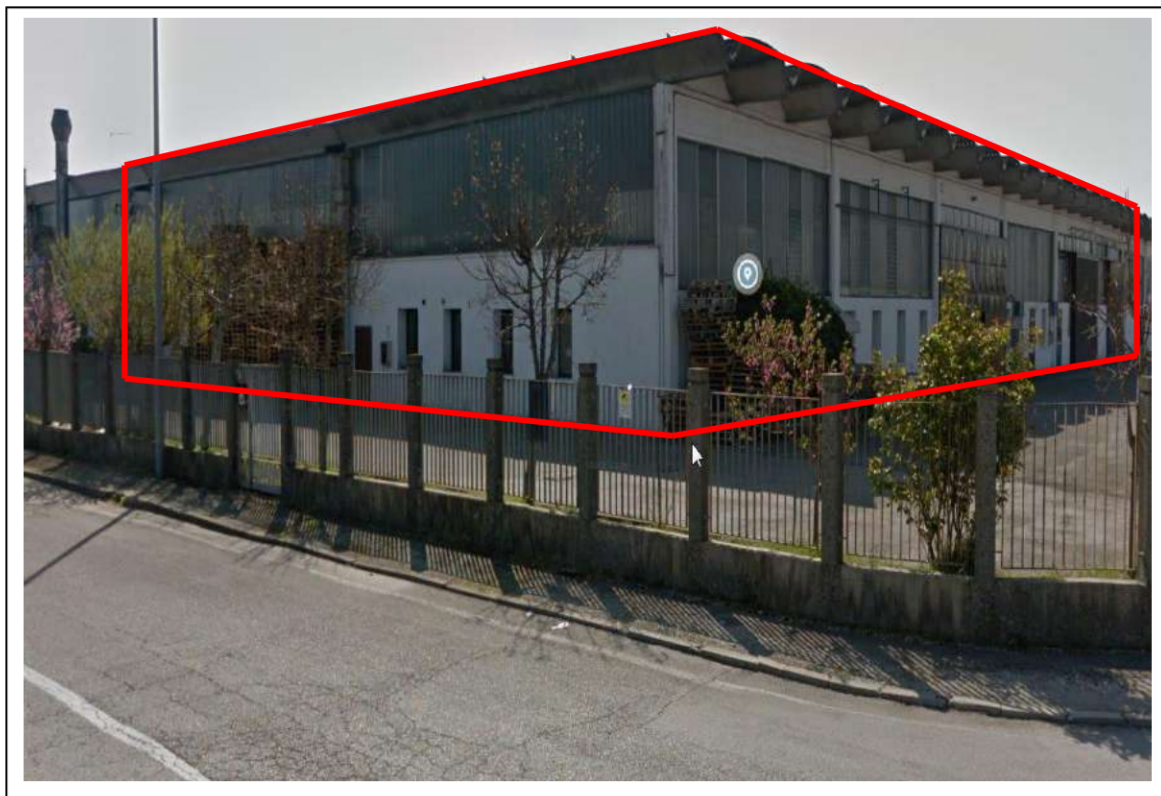
Fotogramma 1/16 – Particolare nord – ovest del fabbricato.