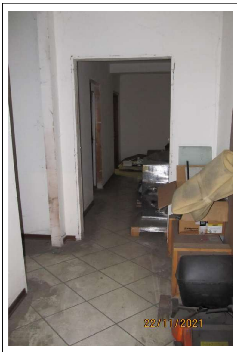
Fotogramma 9/16 – Particolare interno del fabbricato.