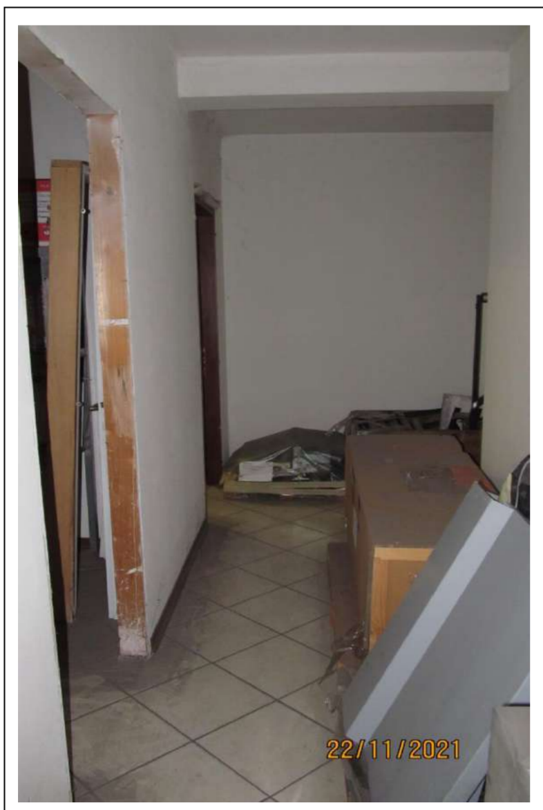
Fotogramma 10/16 – Particolare interno del fabbricato.