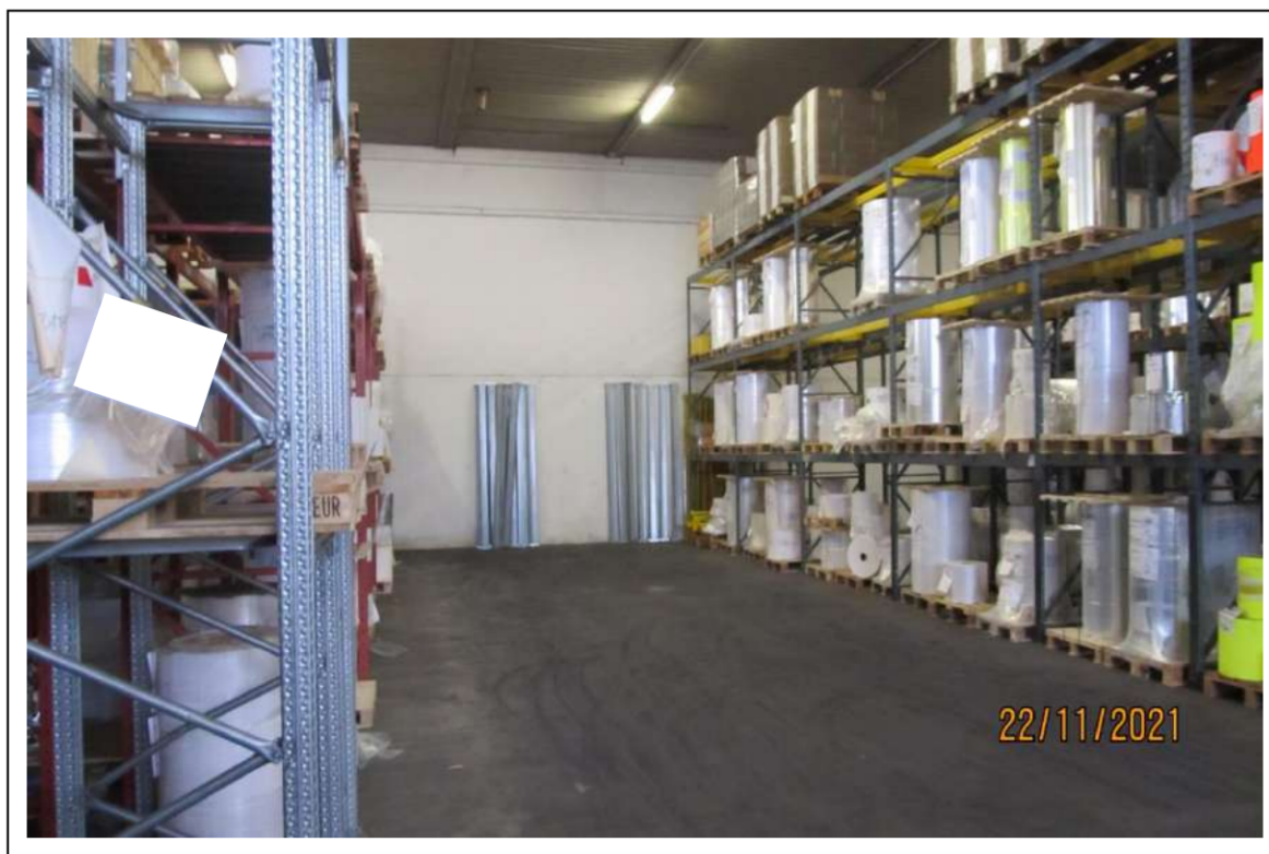
Fotogramma 8/16 – Particolare interno del fabbricato.