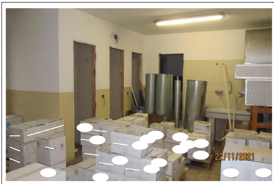
Fotogramma 12/16 – Particolare interno del fabbricato.