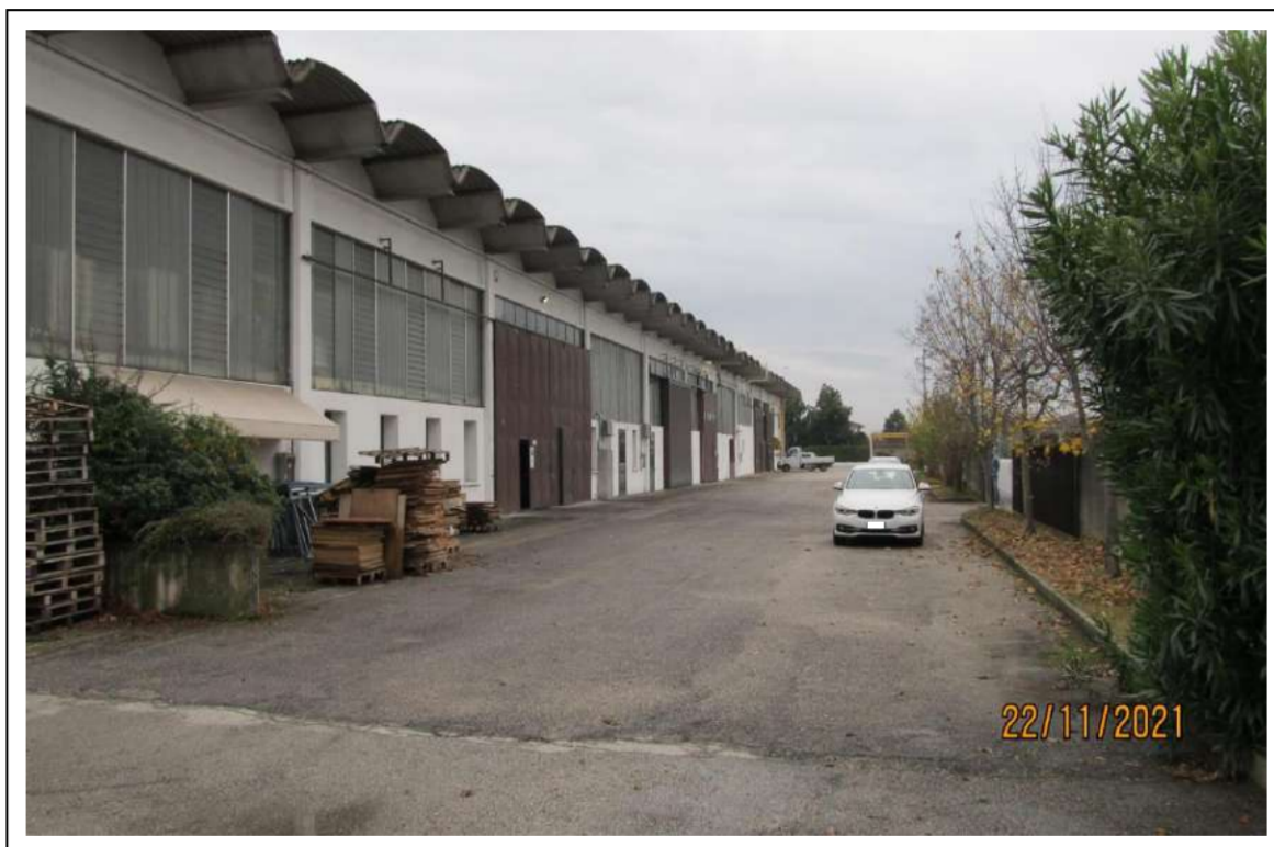
Fotogramma 4/16 – Particolare ovest del fabbricato.