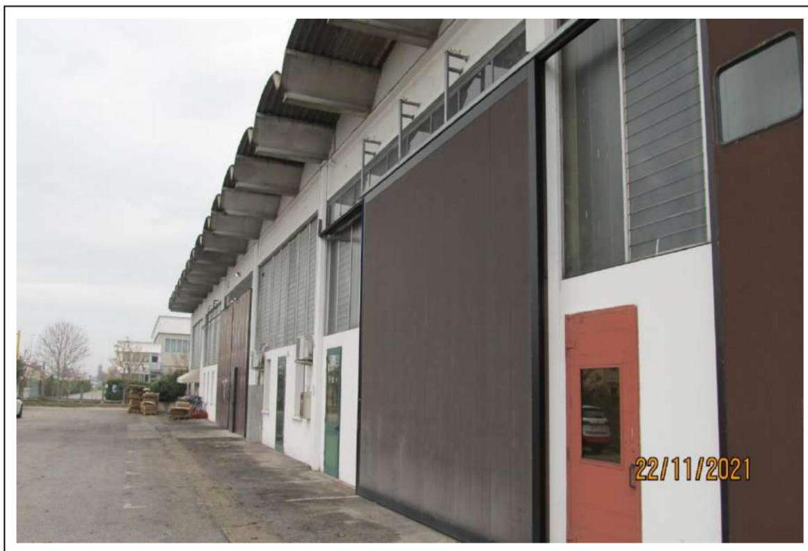
Fotogramma 3/16 – Particolare ovest del fabbricato.