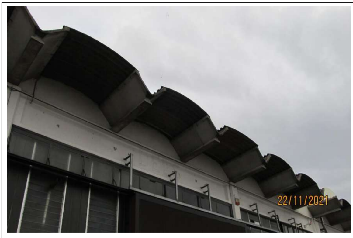
Fotogramma 5/16 – Copertura in eternit.