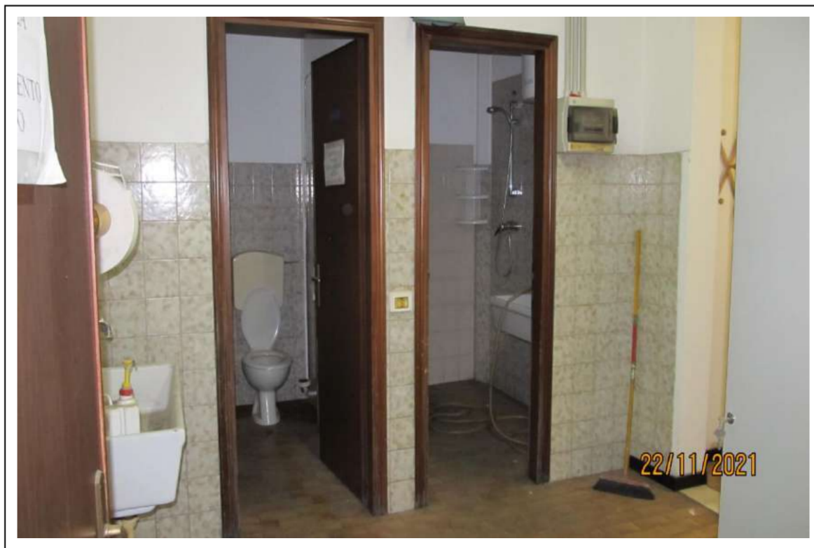
Fotogramma 11/16 – Particolare dei bagni.