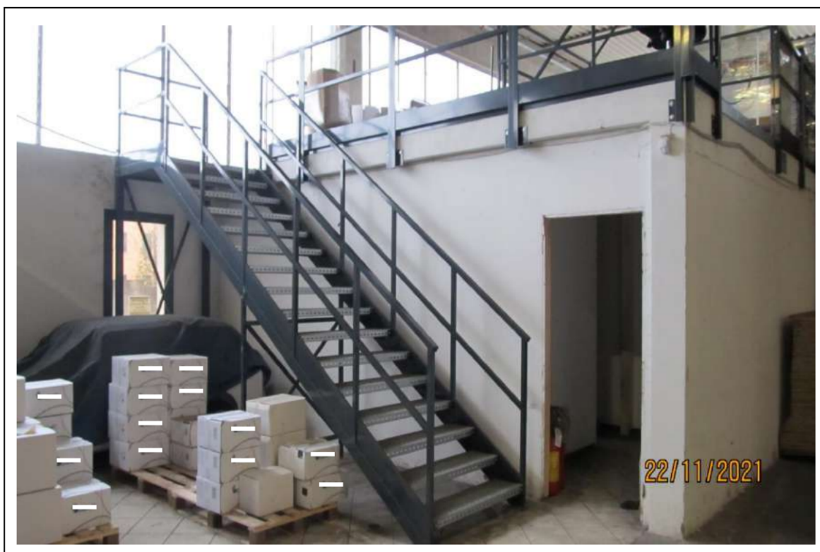
Fotogramma 6/16 – Particolare della scala.