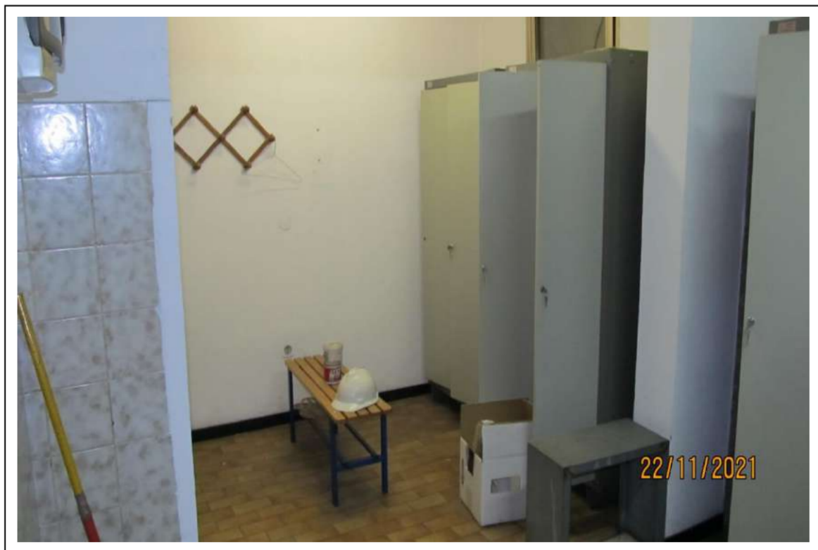
Fotogramma 15/16 – Particolare dei bagni.