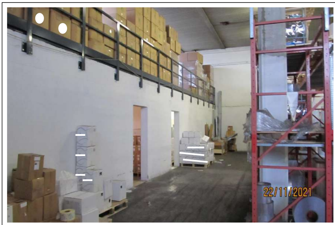
Fotogramma 7/16 – Particolare interno del fabbricato.