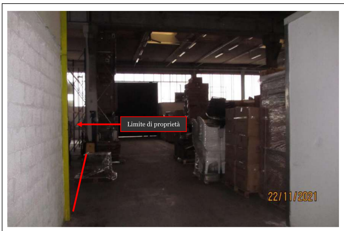
Fotogramma 14/16 – Particolare interno del fabbricato.