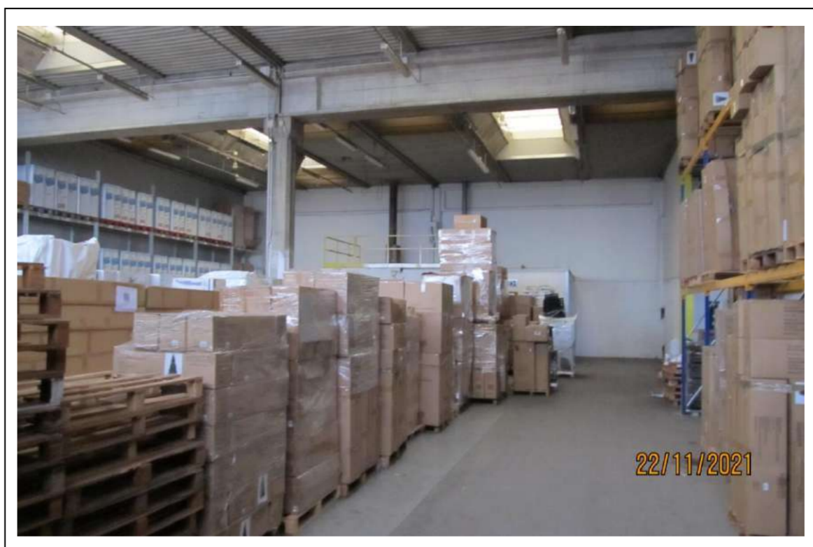
Fotogramma 16/16 – Particolare interno del fabbricato.