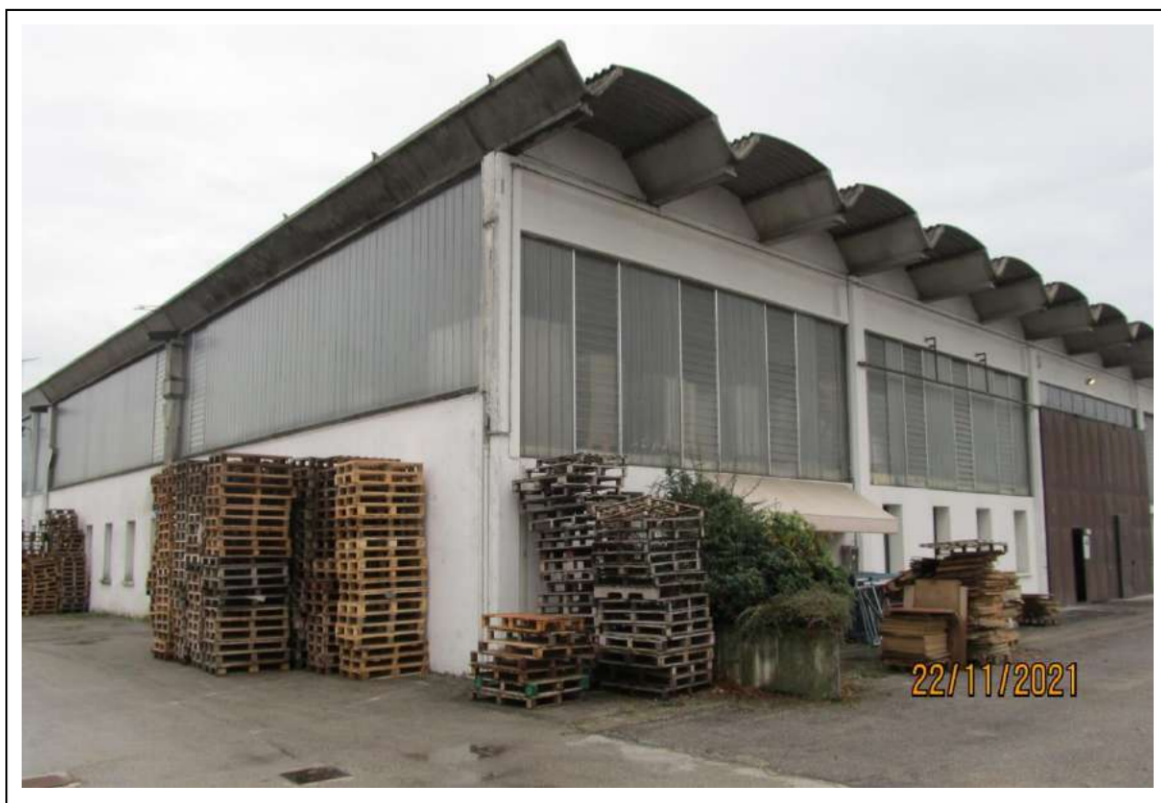
Fotogramma 2/16 – Particolare nord – ovest del fabbricato.