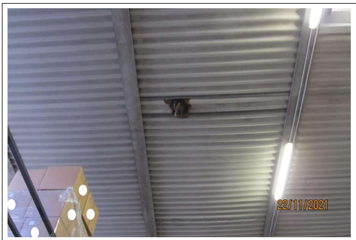
Fotogramma 13/16 – Particolare del soffitto del fabbricato.