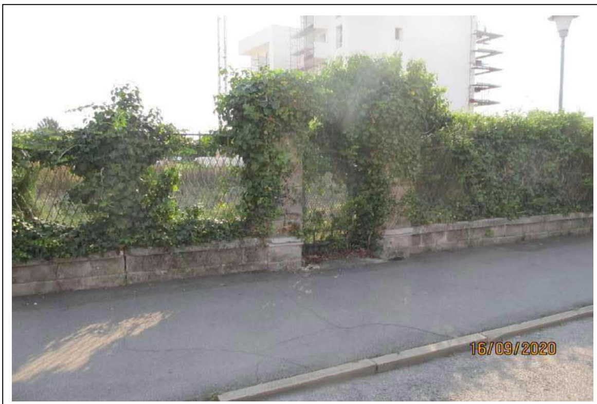
Fotogramma 8/10 – Particolare degli accessi su via Baron.