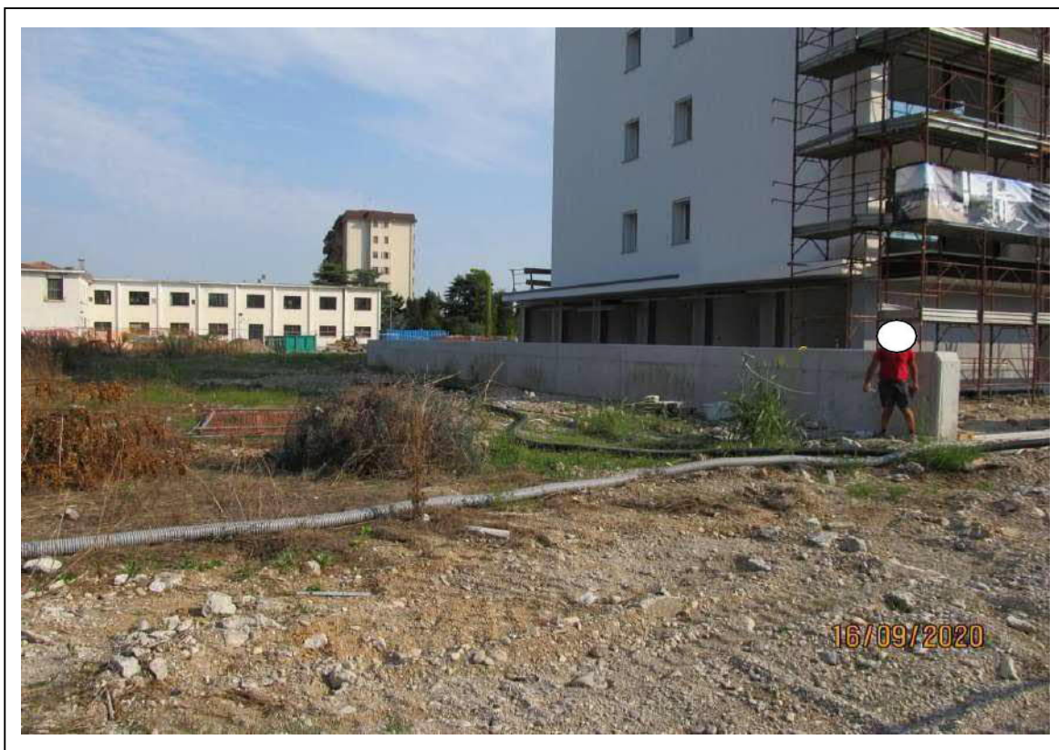
Fotogramma 10/10 – Particolare della proprietà verso confine Est materiali di risulta.