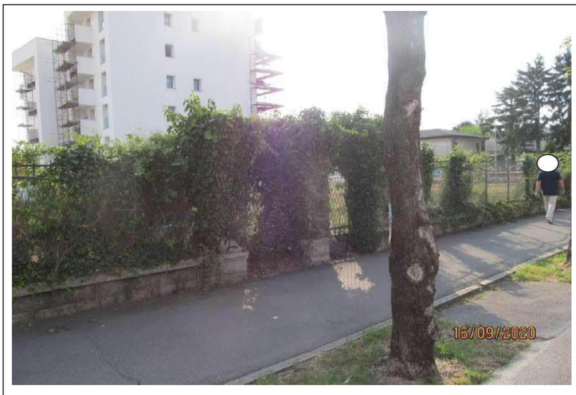
Fotogramma 9/10 – Particolare degli accessi su via Baron.