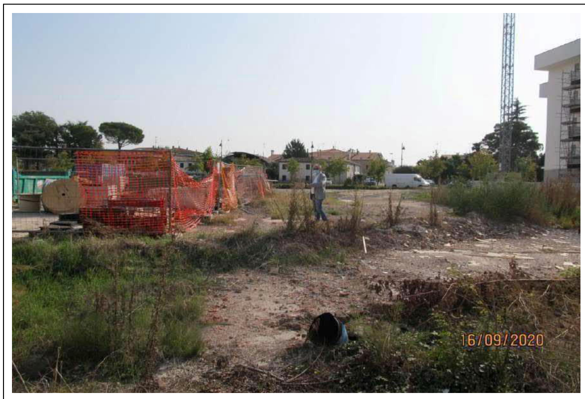
Fotogramma 1/10 – Particolare della proprietà.