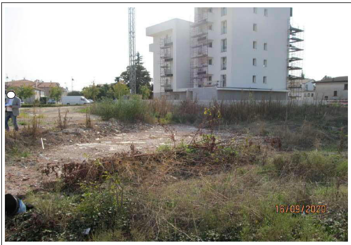
Fotogramma 2/10 – Particolare della proprietà.