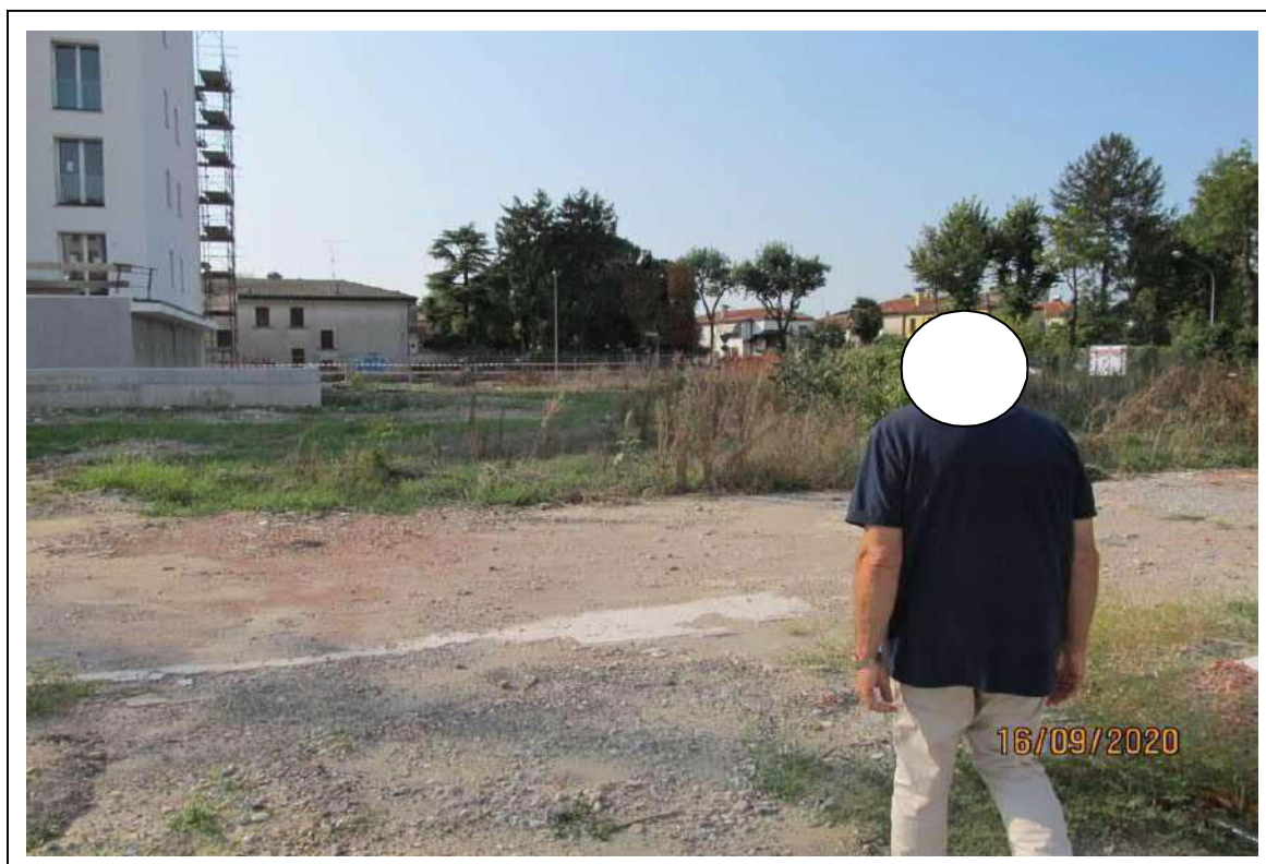
Fotogramma 3/10 – Particolare della proprietà.