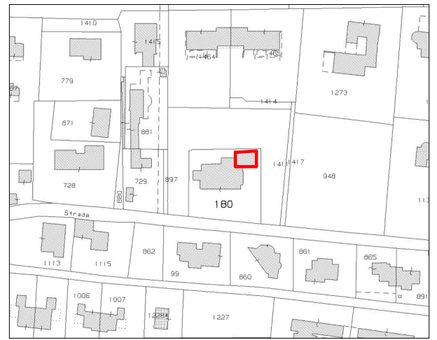
estratto mappa catastale