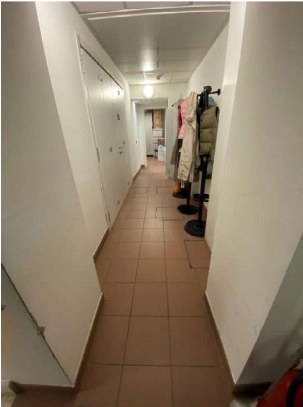
FOTO 31: Pozzetti Fognatura presenti all'interno dei locali a piano terra di proprietà Poste Italiane