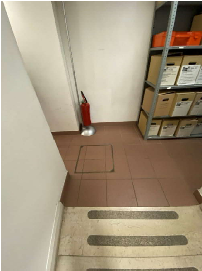
FOTO 29: Pozzetto Fognatura presente all'interno dei locali a piano terra di proprietà Poste Italiane