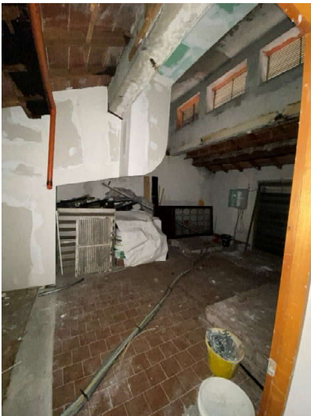
FOTO 16: Locale condizionamento con servitù di condotta a favore di Poste Italiane