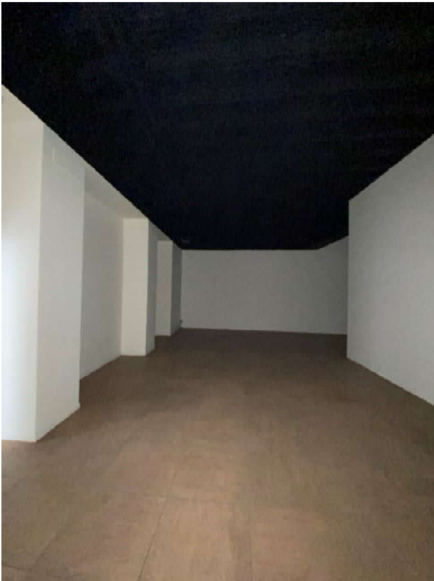
FOTO 11: Locale ufficio delimitato, a destra, da pareti di cartongesso da rimuovere