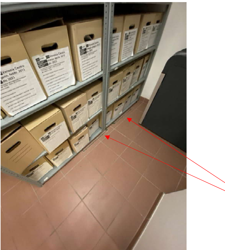
FOTO 30: Pozzetti Fognatura presenti all'interno dei locali a piano terra di proprietà Poste Italiane