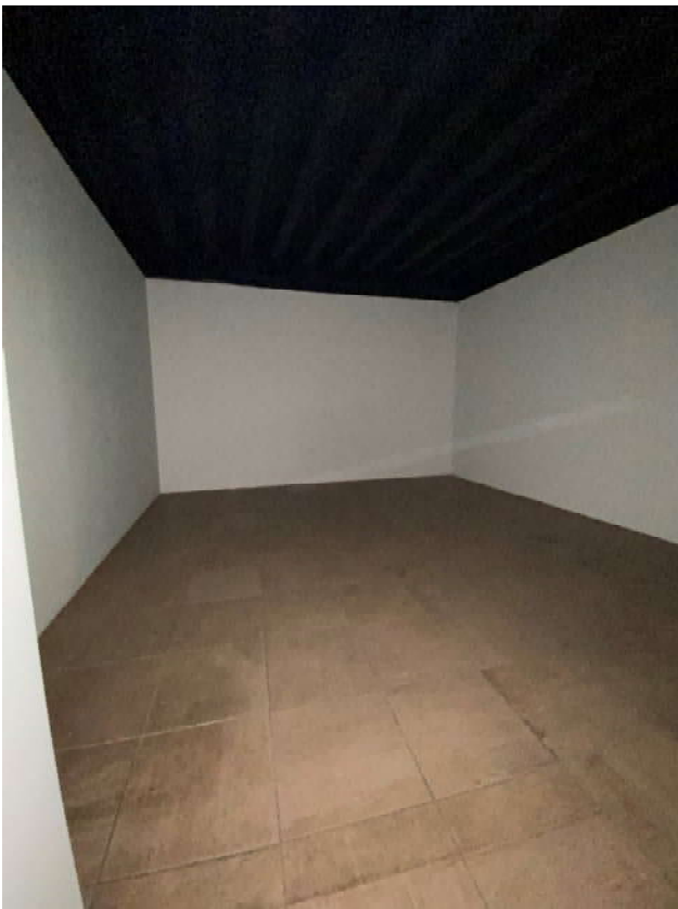
FOTO 12: Locale ufficio delimitato, a destra, da pareti di cartongesso da rimuovere