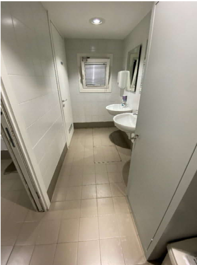
FOTO 32: Pozzetti Fognatura presenti all'interno dei locali a piano terra di proprietà Poste Italiane