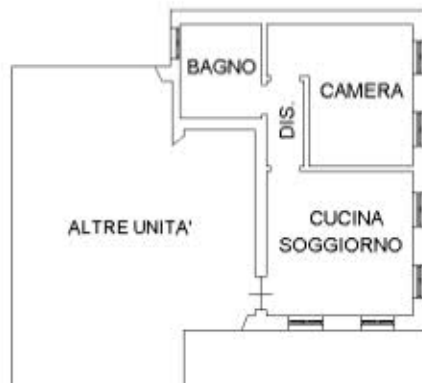
PIANO PRIMO H=2,85