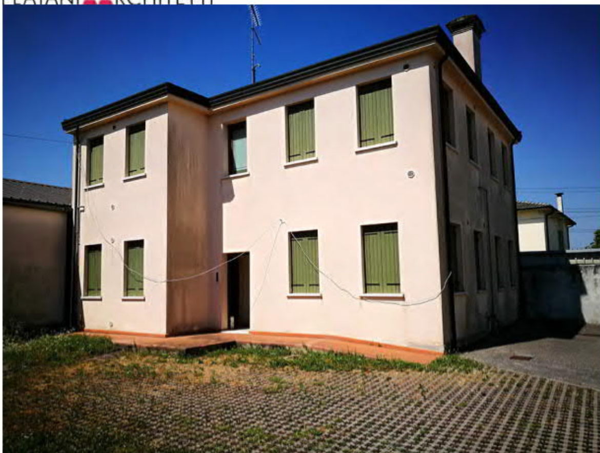
Vista edificio dallo scoperto pertinenziale