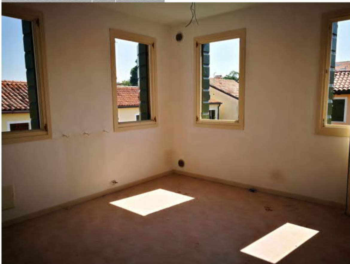
Cucina soggiorno dall'ingresso