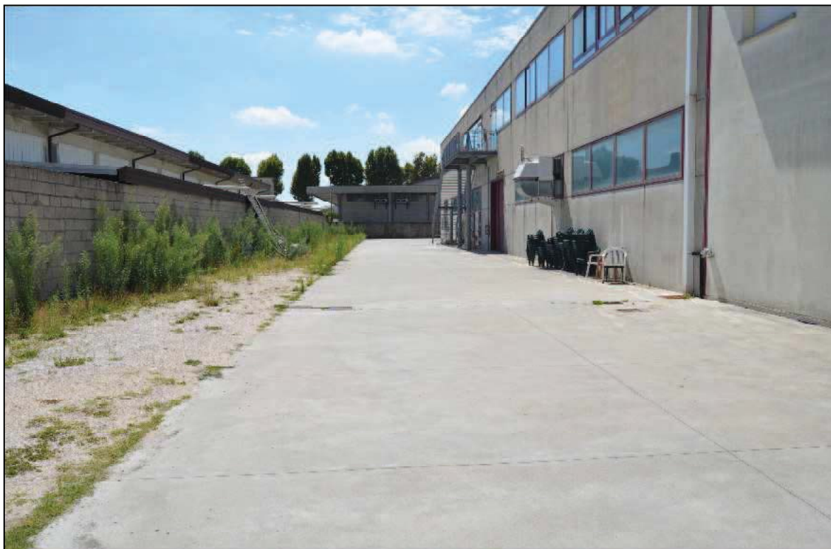
Fotografia n°3 (Lotto n. 1 e Lotto n. 2)