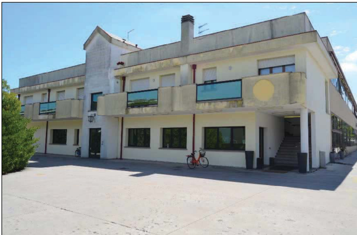
Fotografia n°1 (Lotto n. 1 e Lotto n. 2)