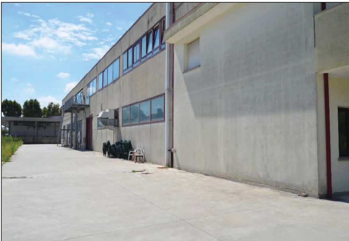
Fotografia n°4 (Lotto n. 1 e Lotto n. 2)