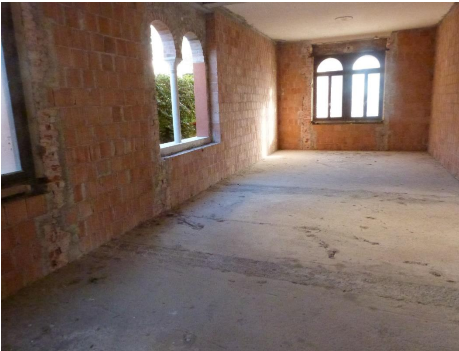
8 Piano primo – spazio da adibire ad appartamento ancora privo di divisioni.