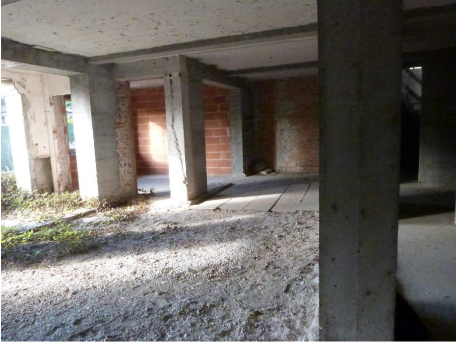
7 Piano terra – spazio aperto di cantiere ancora privo di divisione.