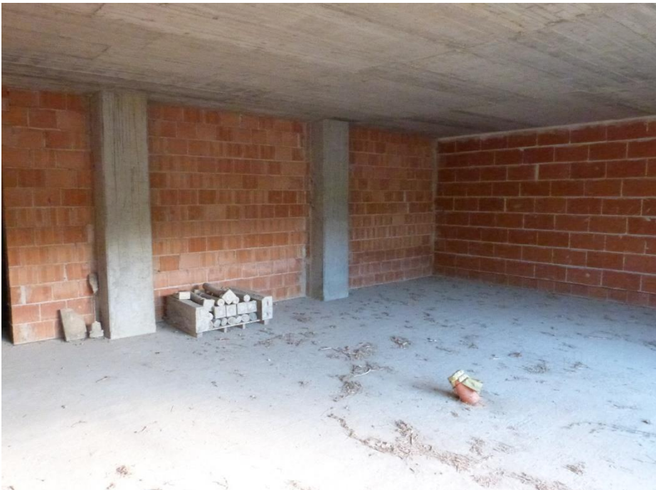
6 Vano da adibire a garage.