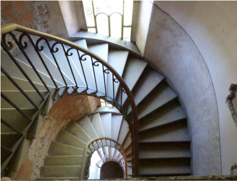
11 Corpo scala interno in lavorazione.