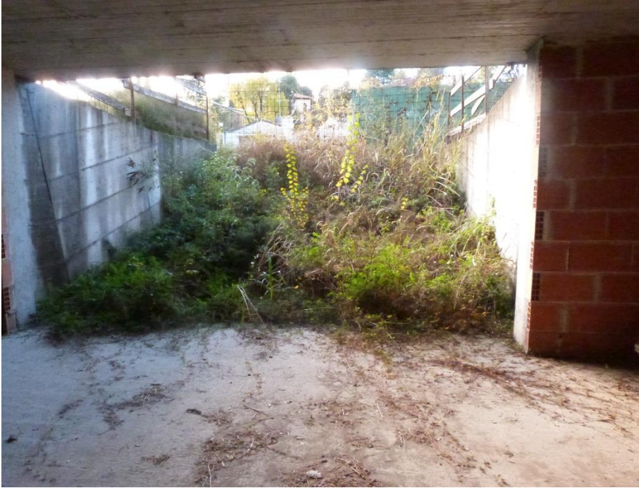
5 Ingresso vani garage.