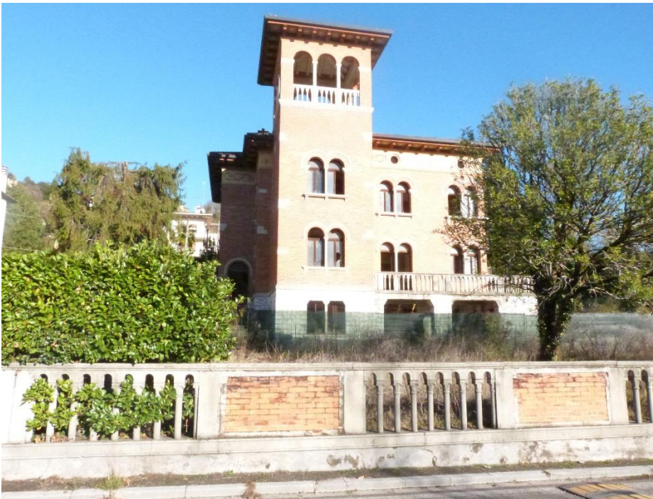
2 Prospetto principale su Via Gorizia.