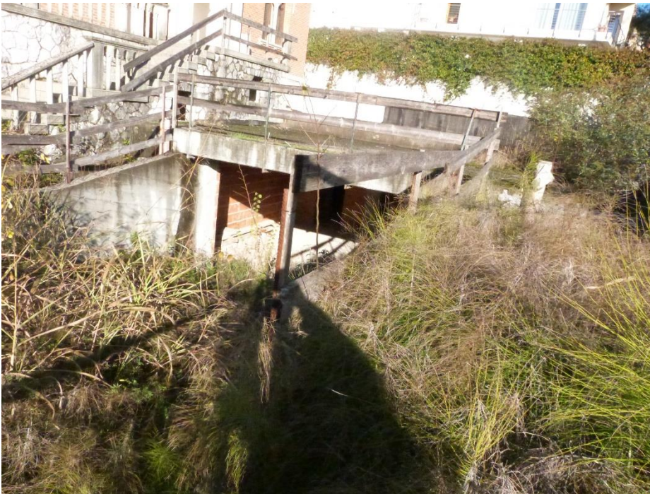
4 Accesso ai vani garage.