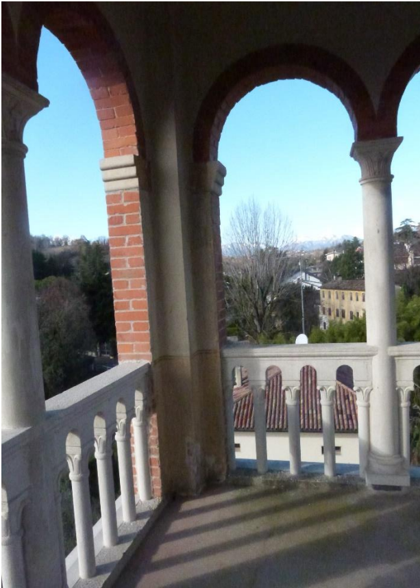
24 Piano quarto – torretta.