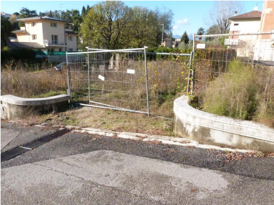
3 Ingresso all'immobile da Via Carso.