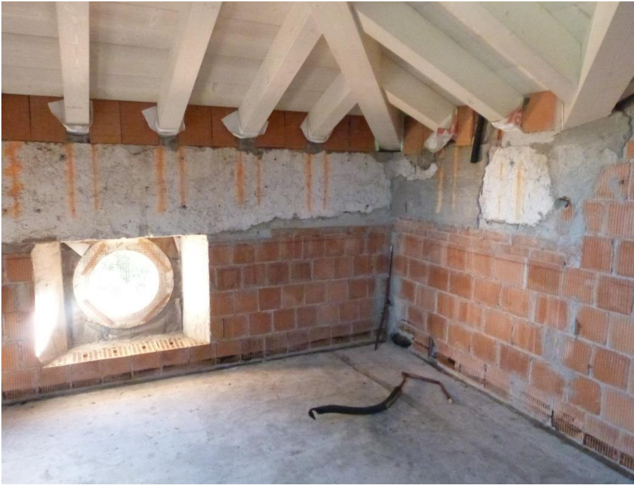
13 Piano terzo – spazio da adibire ad appartamento privo di divisioni.