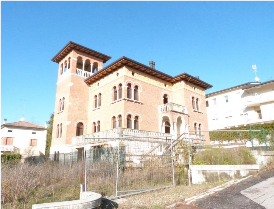
1 Vista dell'immobile.