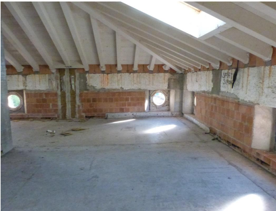
12 Piano terzo – spazio da adibire ad appartamento ancora privo di divisioni.