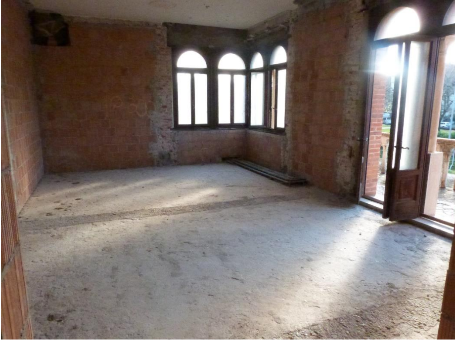
9 Piano primo – spazio da adibire ad appartamento ancora privo di divisioni.