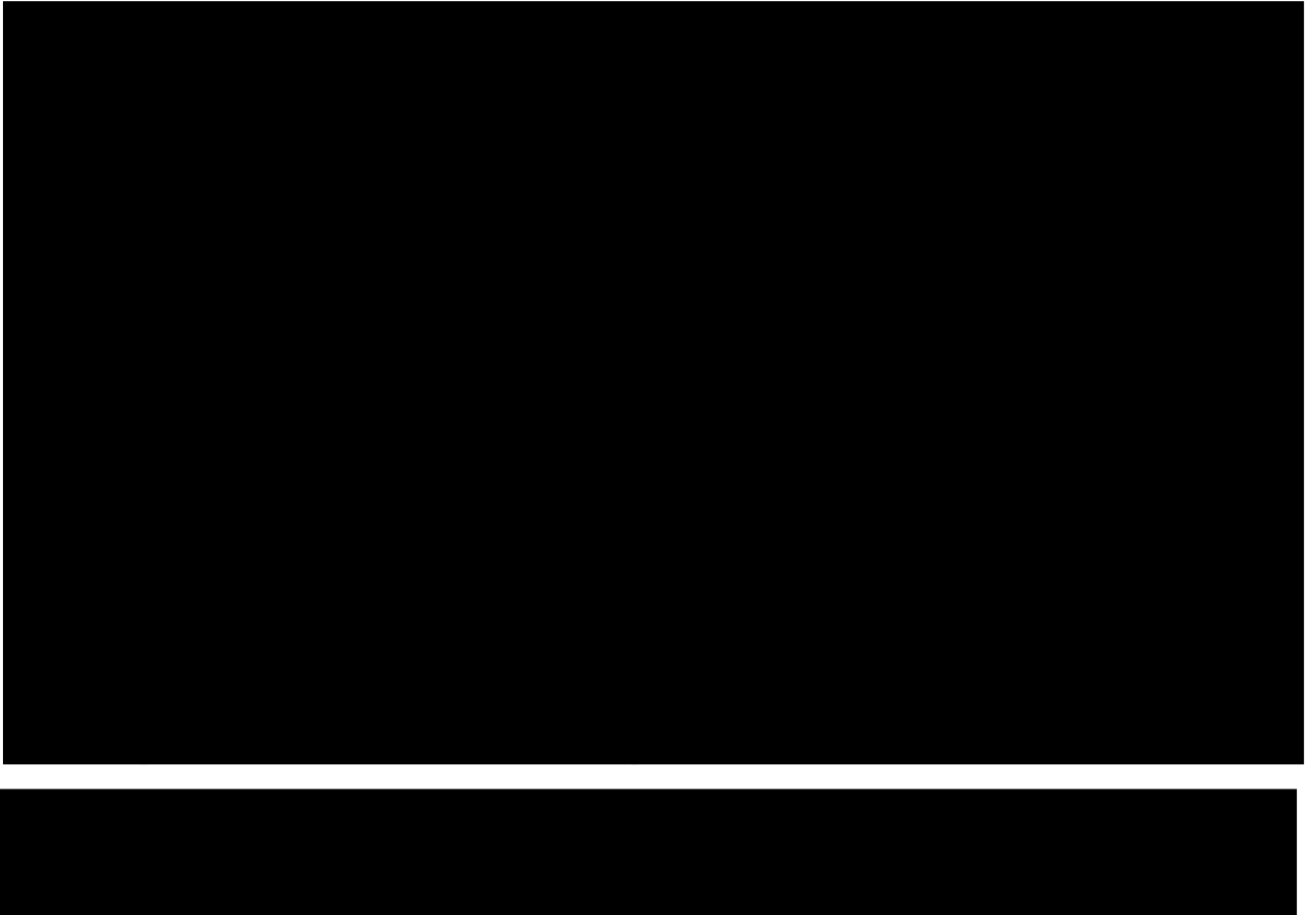
Fig. 1.13 – vista da nord dell'abitazione con deposito (sub 2-7)