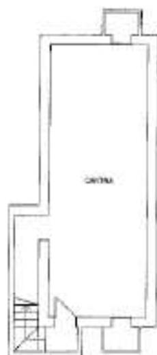
PIANO INTERRATO H:2,50 ML