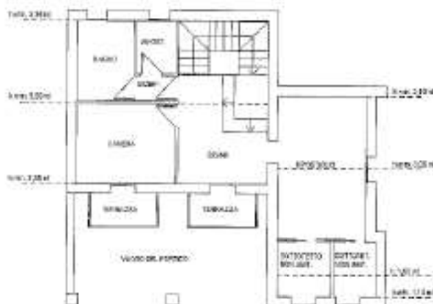
PIANO PRIMO HM:2,73 ML