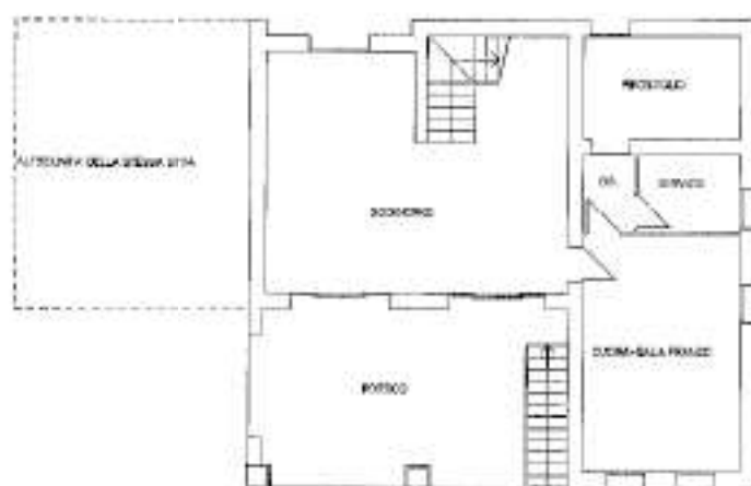
PIANO TERRA H:2,70 ML