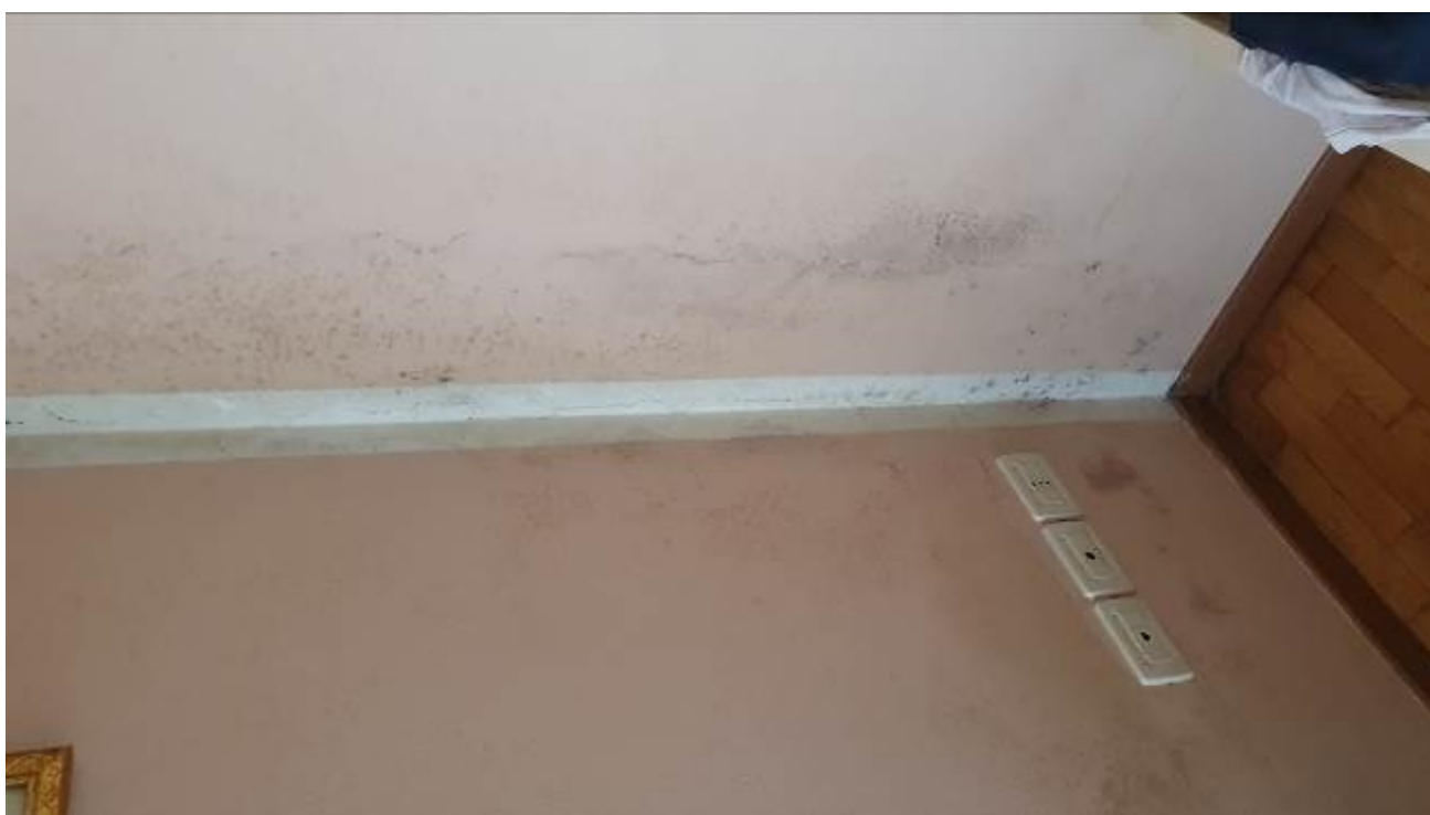
Umidità e muffe