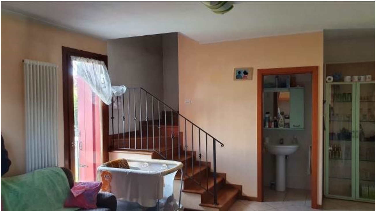
Termosifoni e legno zona notte