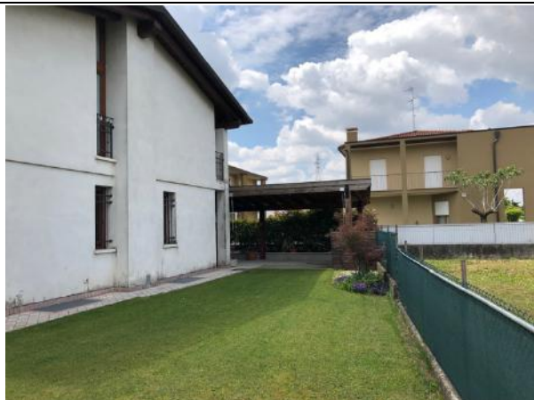
Vista esterna edificio – Prospetto Nord e tettoia lato Ovest