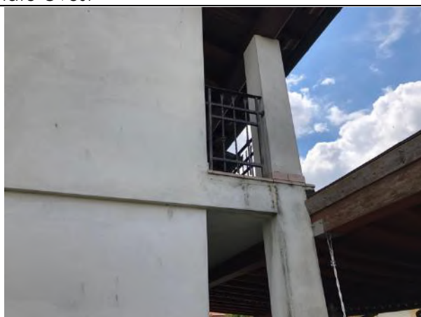
Vista esterna edificio – Prospetto Nord- Deterioramento intonaci