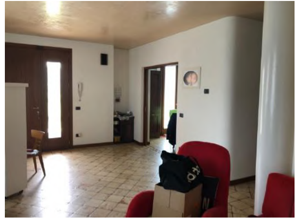
Vista Interna – Piano Terra – Ingresso