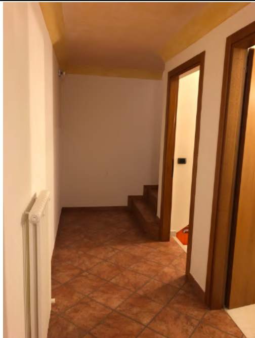
Vista Interna – Piano Interrato – Corridoio