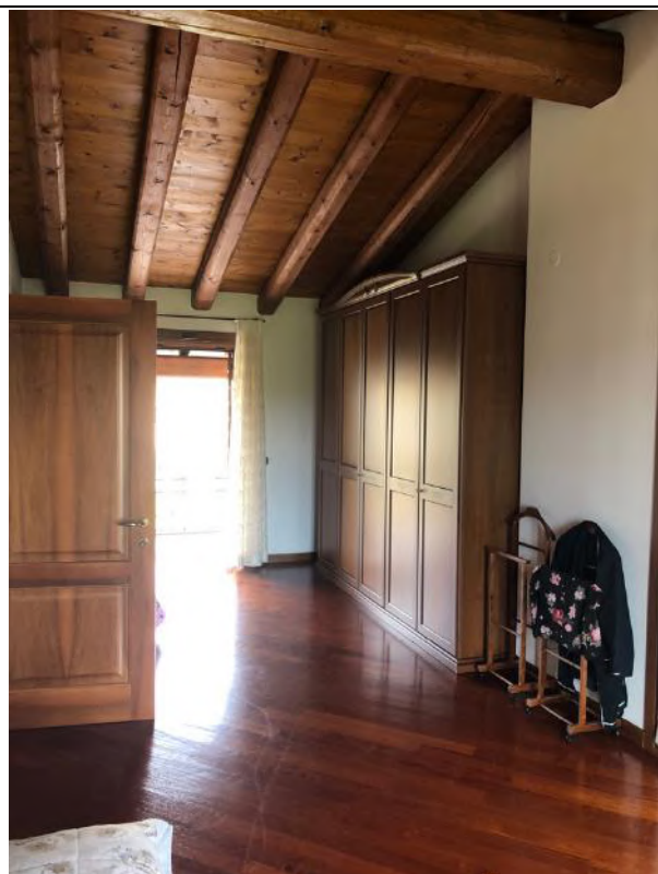
Vista Interna – Piano Primo – Guardaroba camera