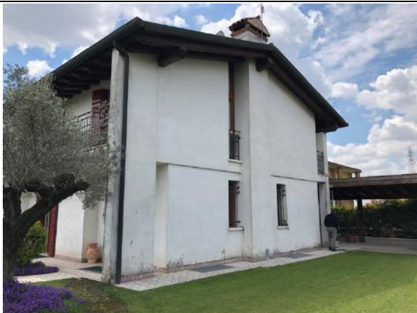
Vista esterna edificio – Prospetto Nord