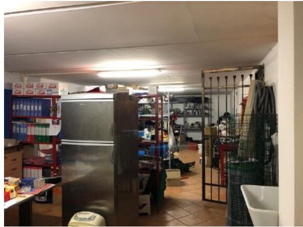
Vista Interna – Piano Interrato – Magazzino (su area manovra e garage)