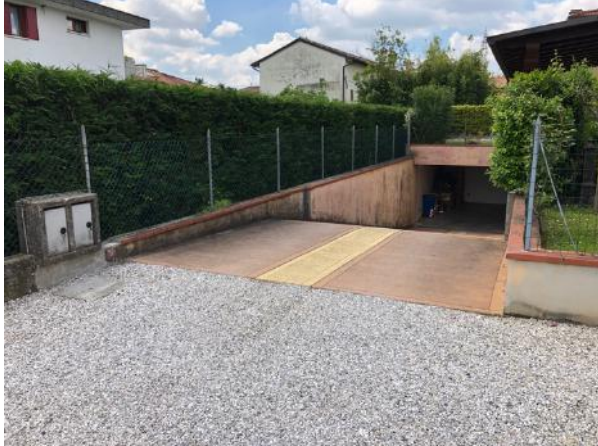
Vista esterna ingresso rampa al piano interrato da strada di accesso