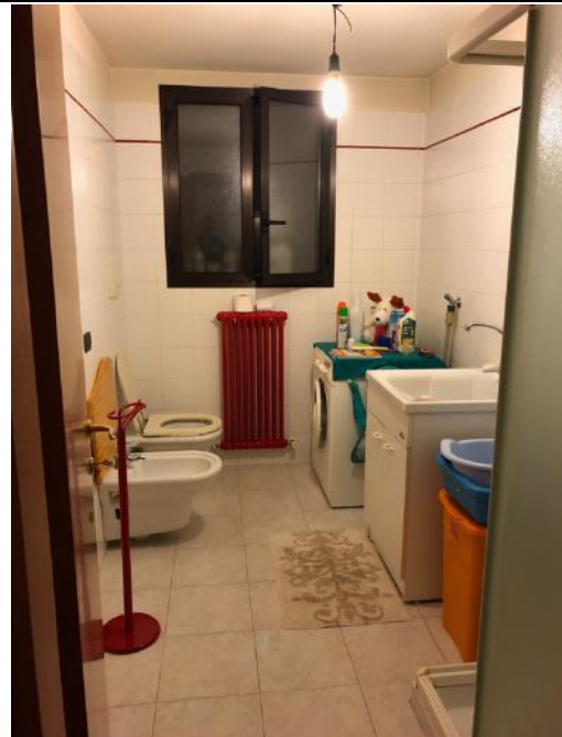
Vista Interna – Piano Interrato – Lavanderia