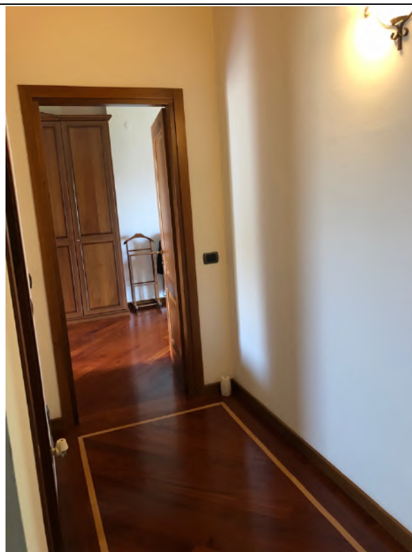
Vista Interna – Piano Primo - Corridoio