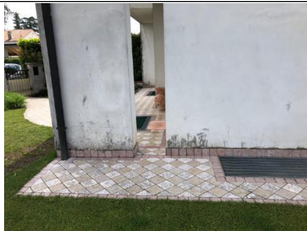
Vista esterna edificio – Prospetto Nord- Deterioramento intonaci