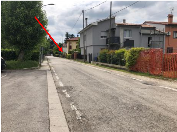
Vista Via Molino di Ferro verso centro abitato Freccia indica innesto strada di accesso