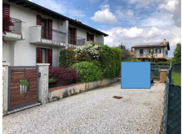
Vista esterna edificio ingresso pedonale da strada di accesso