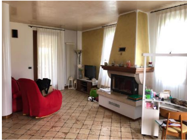
Vista Interna – Piano Terra – Soggiorno