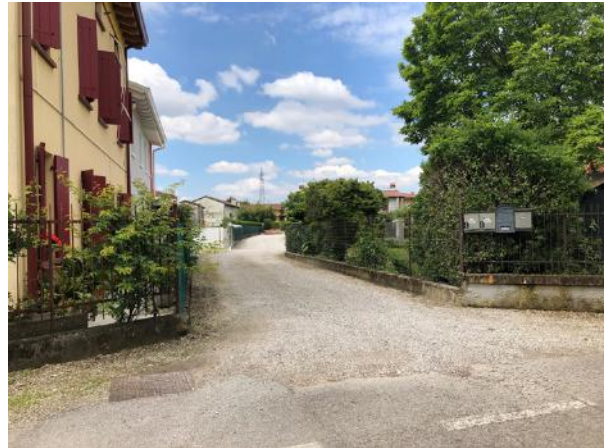
Vista strada di accesso nel punto di innesto su Via Molino di Ferro