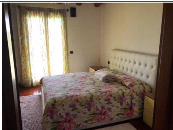
Vista Interna – Piano Primo - Camera