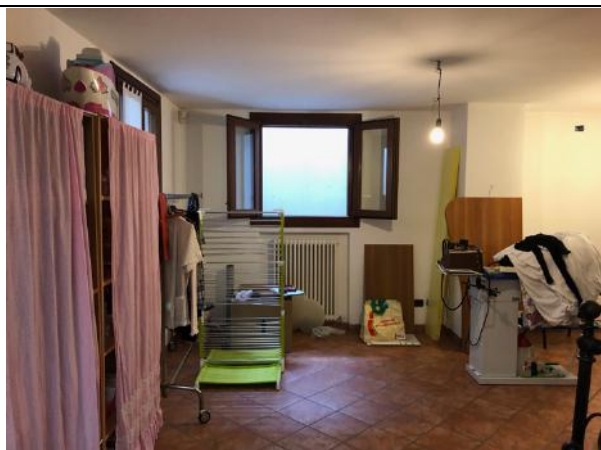
Vista Interna – Piano Interrato – Magazzino