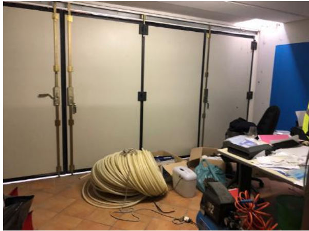
Vista Interna – Piano Interrato – Magazzino ( su area manovra e garage)