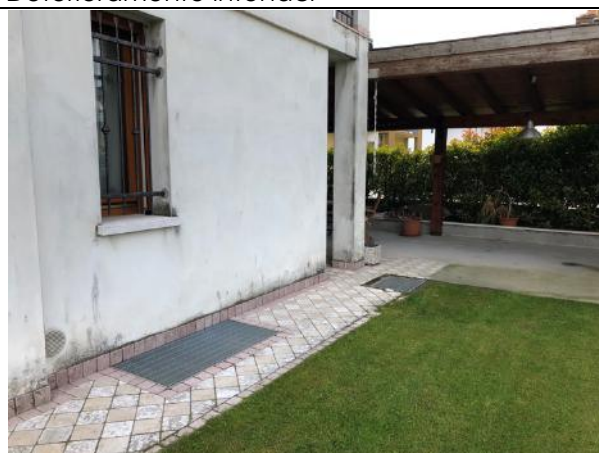
Vista esterna edificio – Prospetto Nord- Deterioramento intonaci