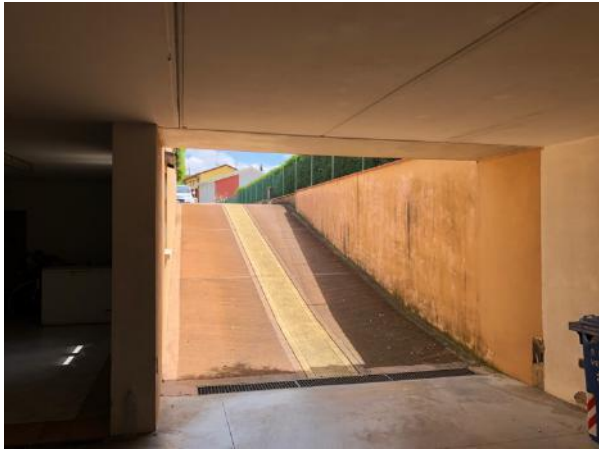
Vista esterna edificio – Piano Interrato – Rampa accesso al piano interrato