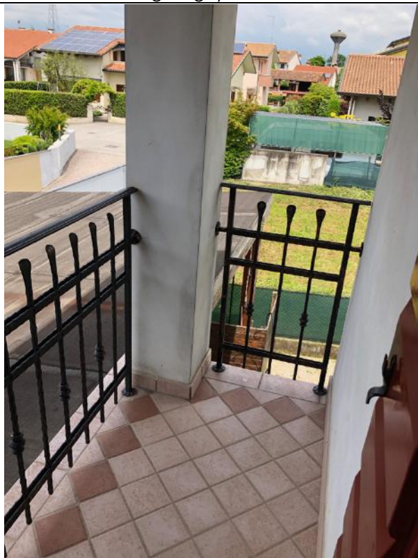
Vista Interna – Parapetti Terrazze