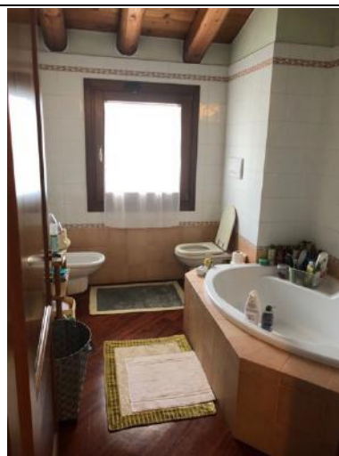
Vista Interna – Piano Primo - Bagno