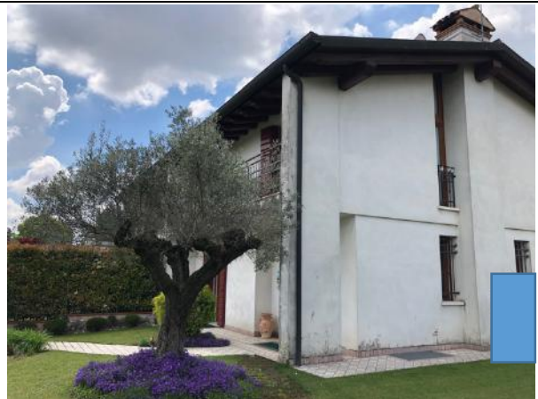
Vista area – Prospetto Est e Nord