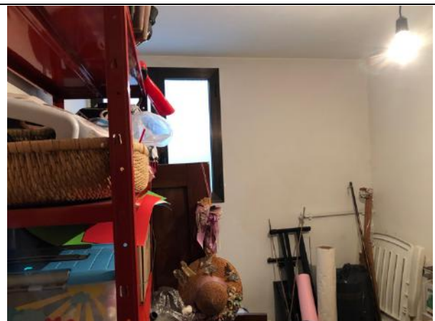
Vista Interna – Piano Interrato – Cantina