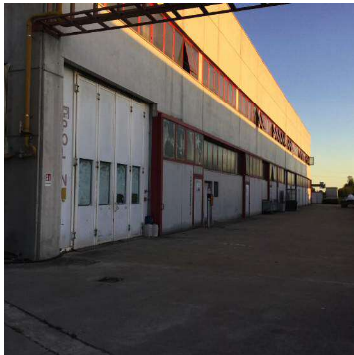
Prospetto Ovest dell'edificio e area scoperta