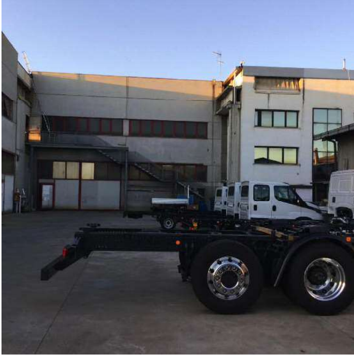
Prospetto Sud dell'edificio e area scoperta