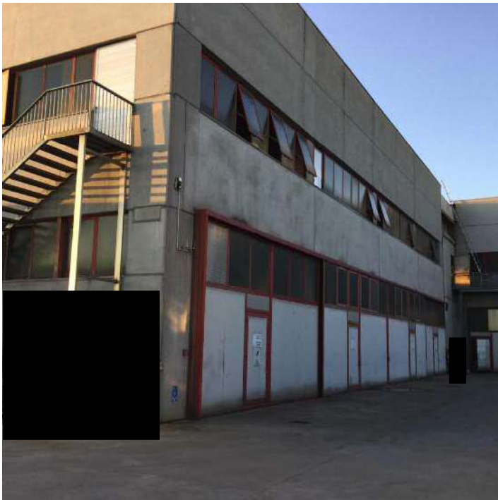
Prospetti Est e Sud dell'edificio e area scoperta