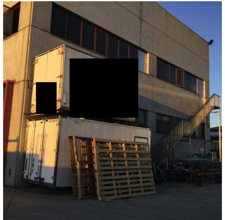
Prospetto Sud dell'edificio