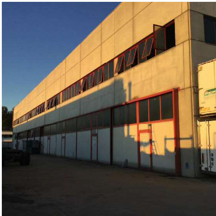
Prospetto Ovest dell'edificio e area scoperta