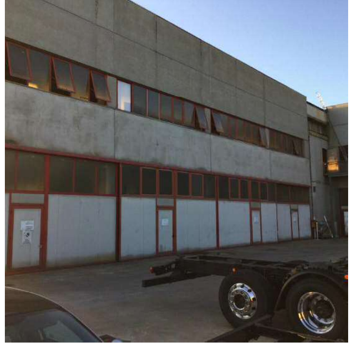
Prospetto Est dell'edificio e area scoperta