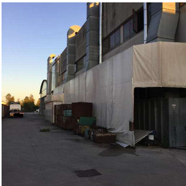
Prospetto Nord dell'edificio e area scoperta