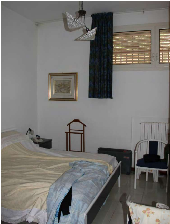
foto 4. camera da letto padronale