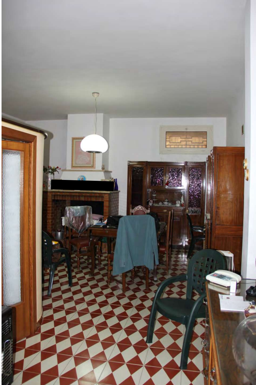
foto 1- ingresso e soggiorno