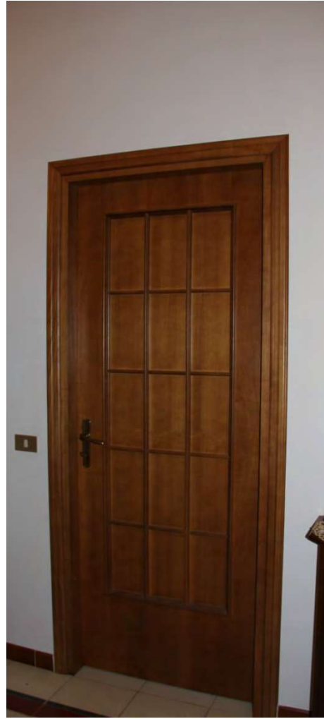
foto 10 -11. particolare porte interne