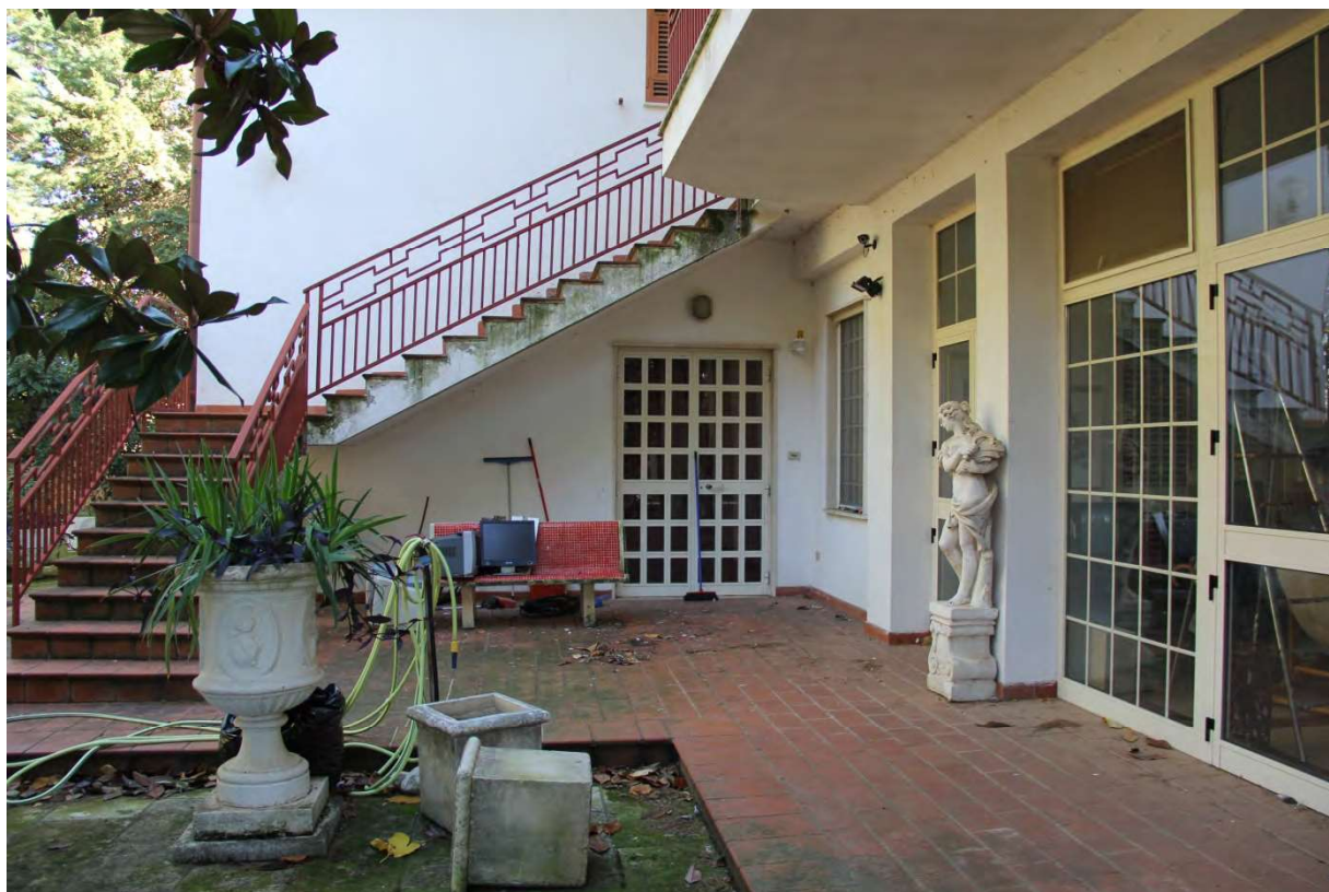
foto 12- Porta di ingresso e vetrate a chiusura del porticato