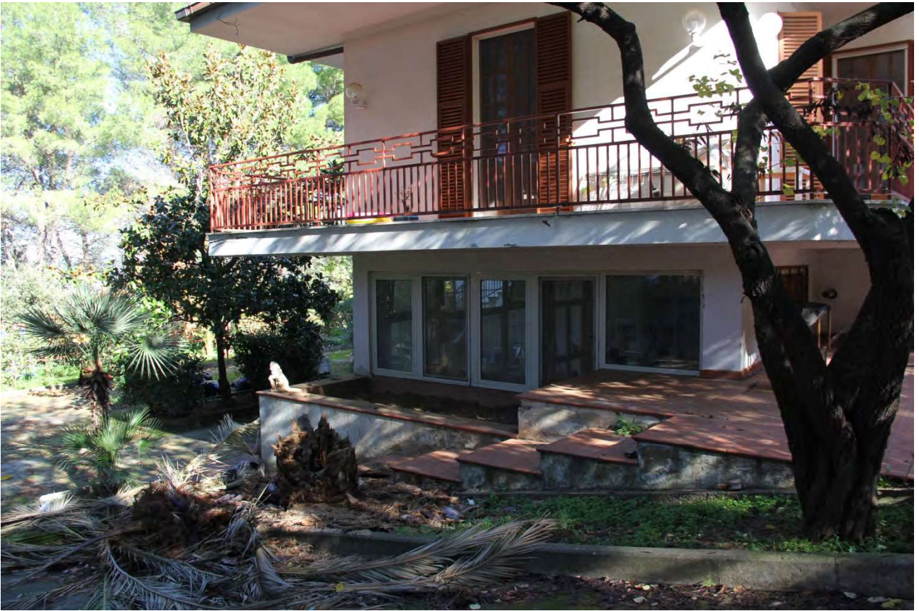
foto 16 .fronte ovest - porticato chiuso con vetrate