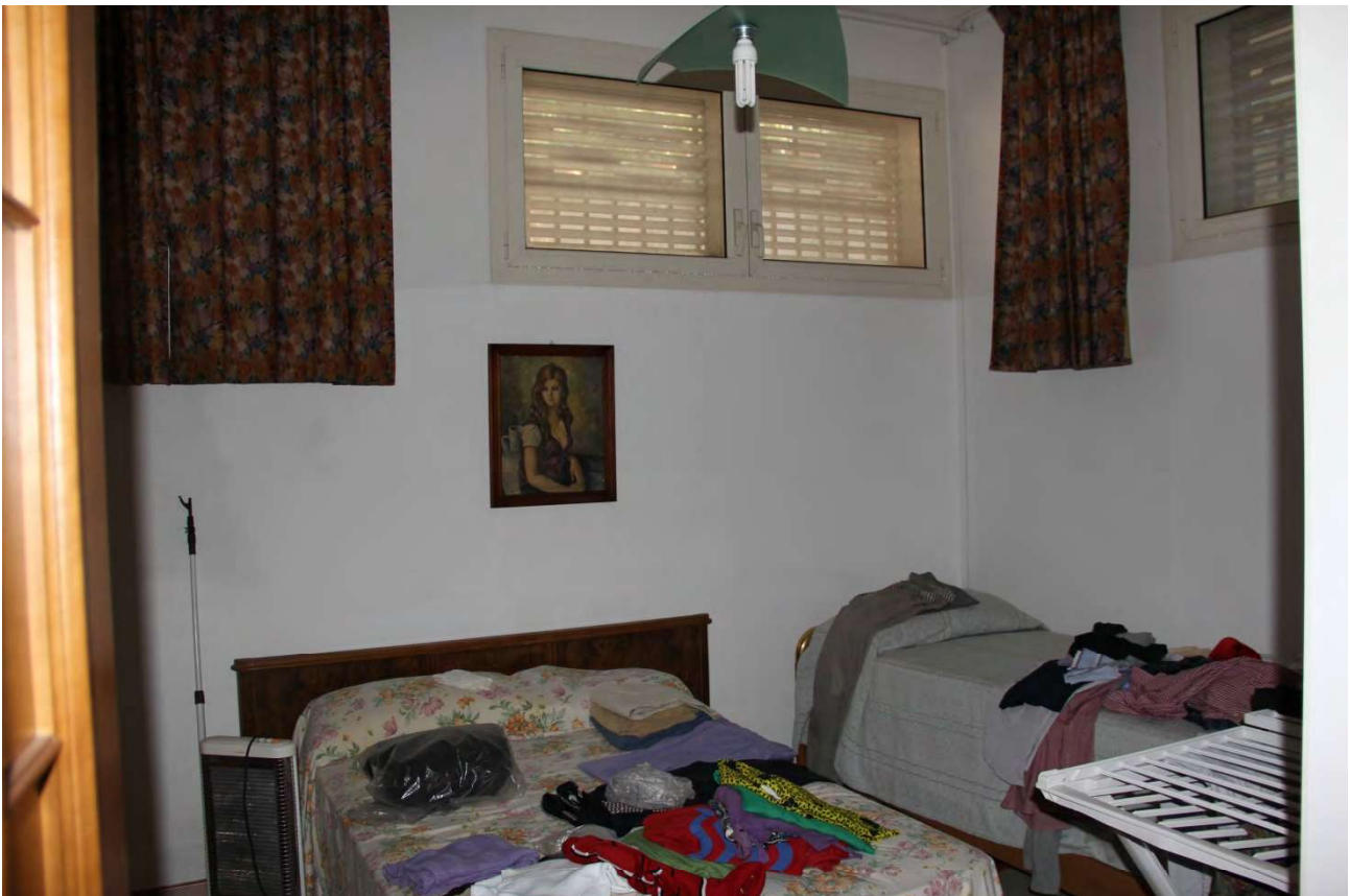
foto 5. camera da letto - n.2. posti letto