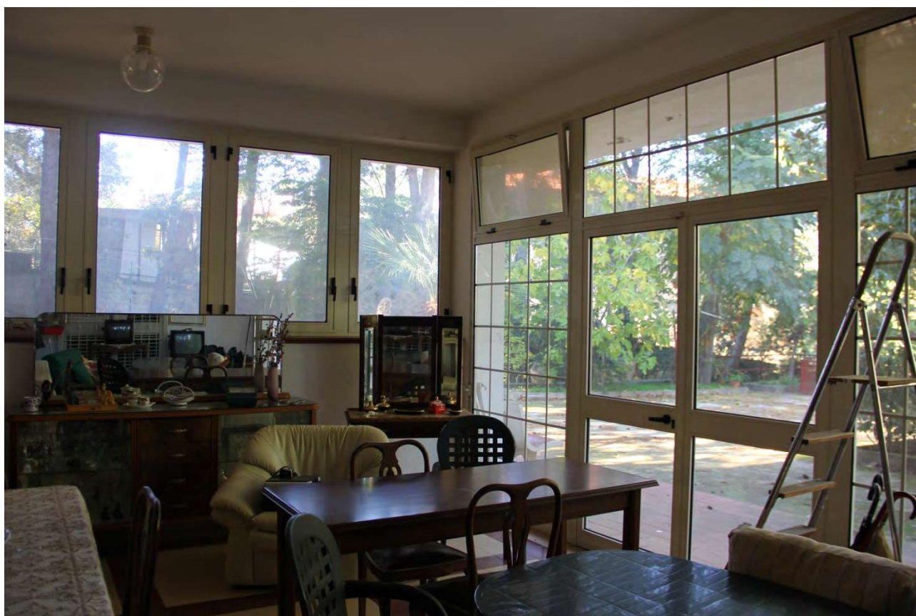
foto 13. volume creato con la chiusura del porticato con vetrate in PVC