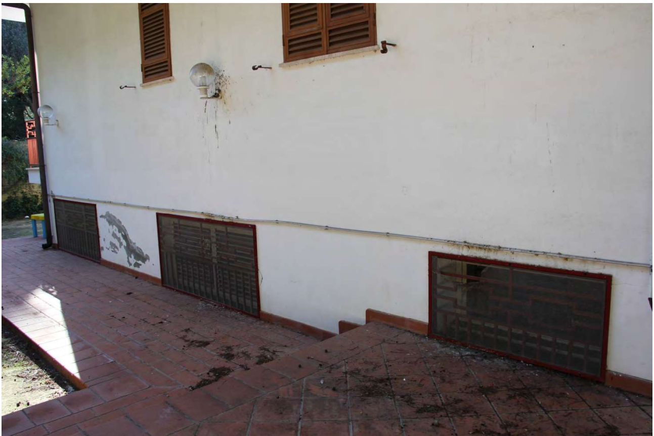
foto 15. finestre degli ambienti seminterrati.