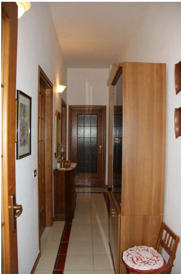
foto 3. il disimpegno con porta del wc e porte delle camere da letto