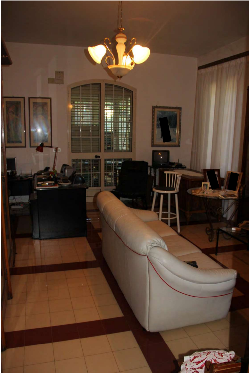
foto6. nuovo volume abusivo nell' area porticato