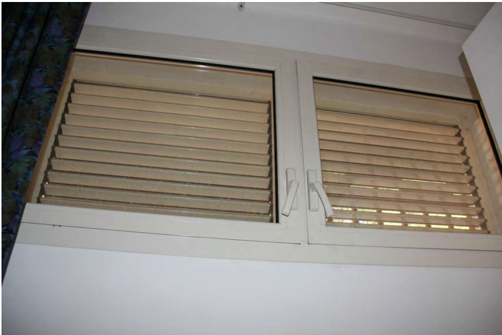
foto 9. particolare infissi camera da letto