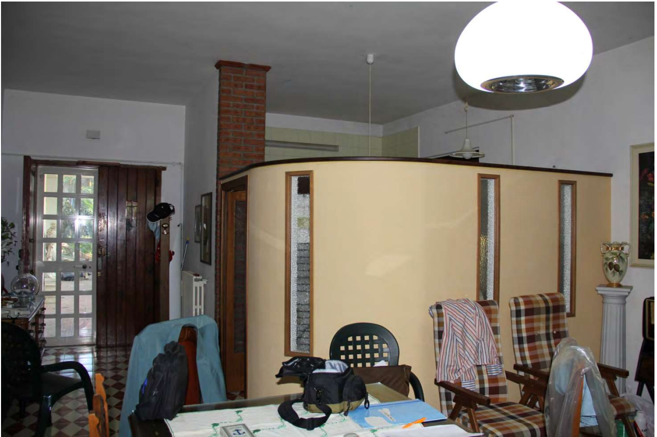
foto 2. ingresso e struttura in cartongesso della cucina