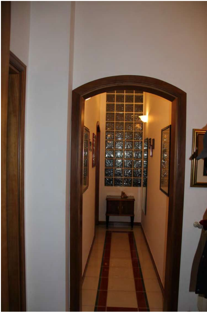
foto 7. disimpegno - volume abusivo