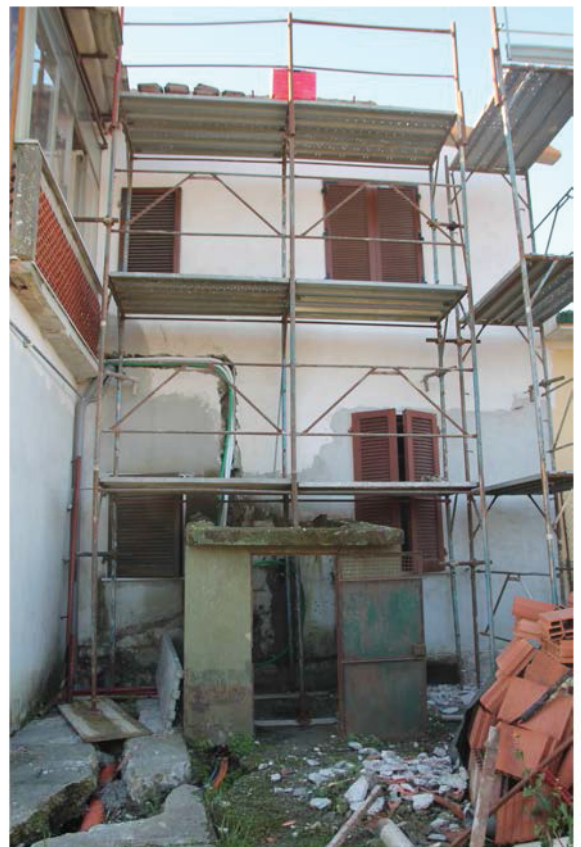
Foto 19. Prospetto lato monti