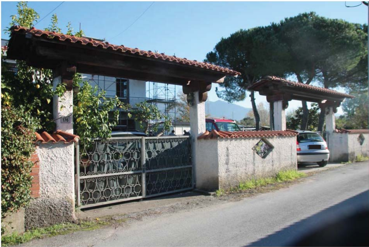
Foto 24. Ingresso carrabile e pedonale al sub.11