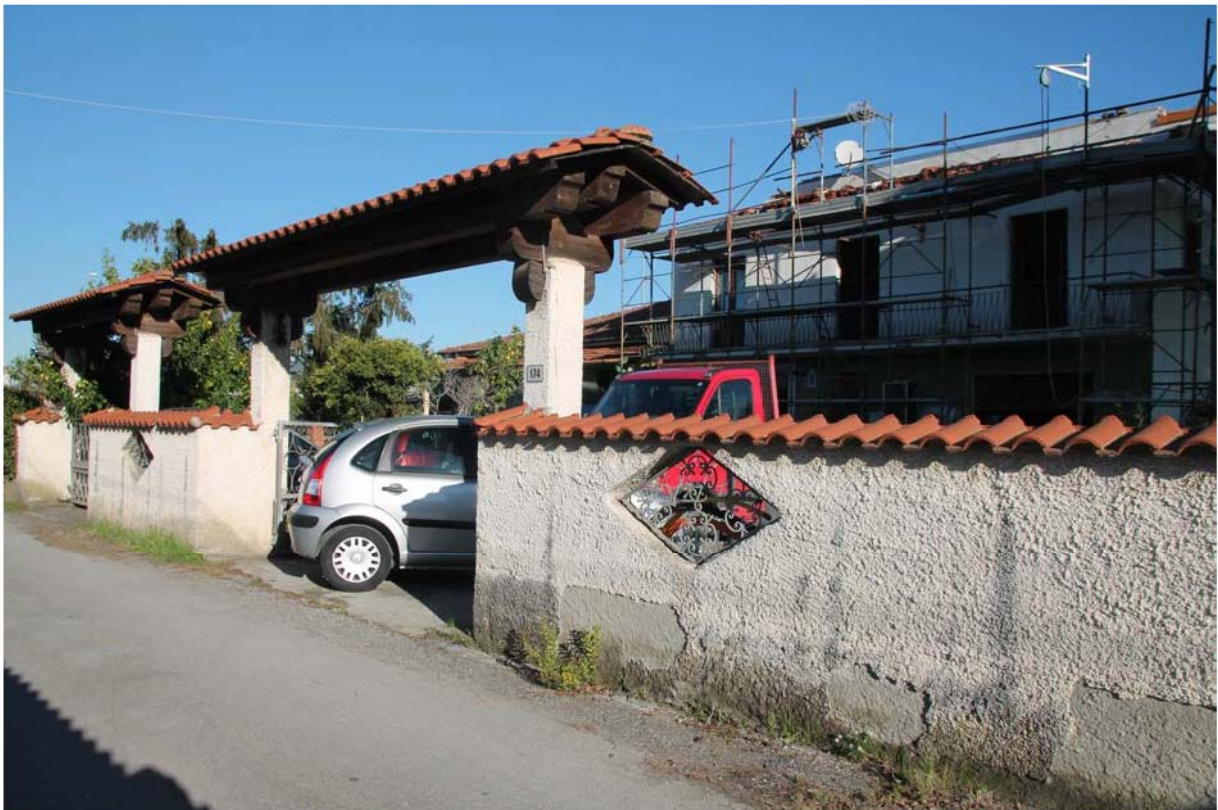
Foto 23. Ingresso carrabile e pedonale al sub.11