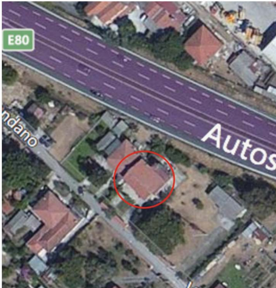
Foto 25. Aerofotogrammetrico posizione edificio.