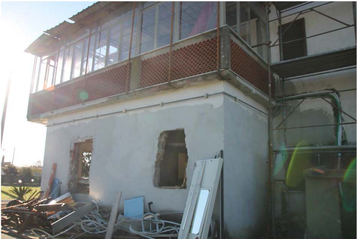
Foto 22. Prospetto lato monti