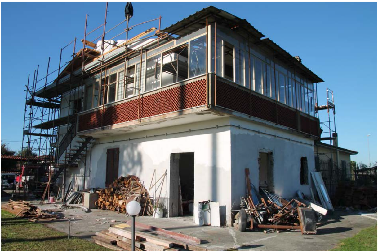
Foto 21. Prospetto lato Viareggio e monti