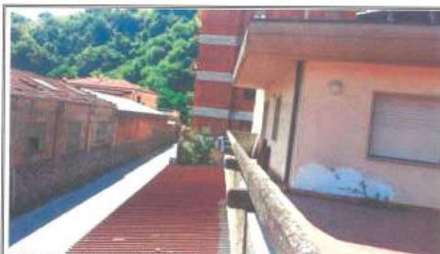
Foto n. 6 - Vista del fabbricato lato EST