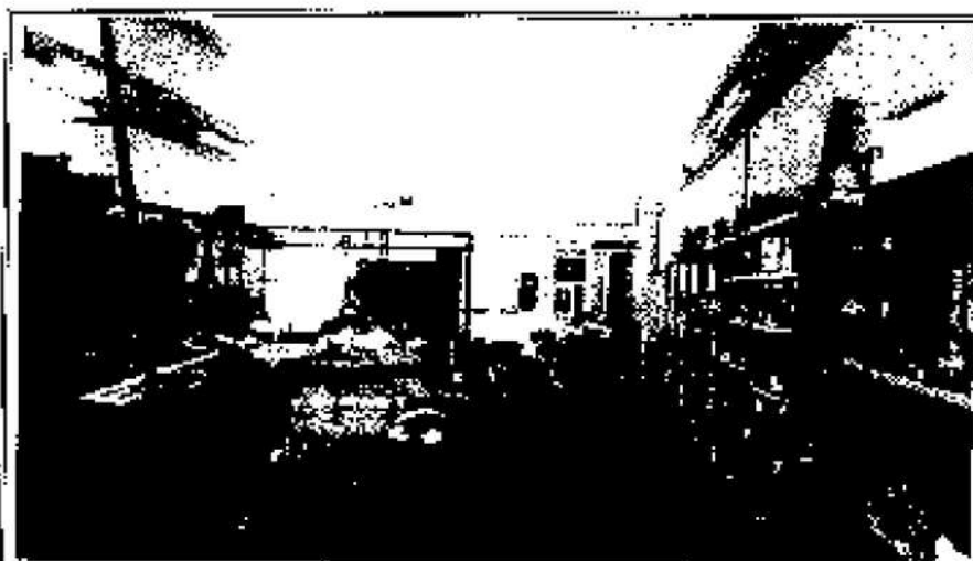
Foto n. 7 - Laboratorio con uffici sullo sfondo al piano terra