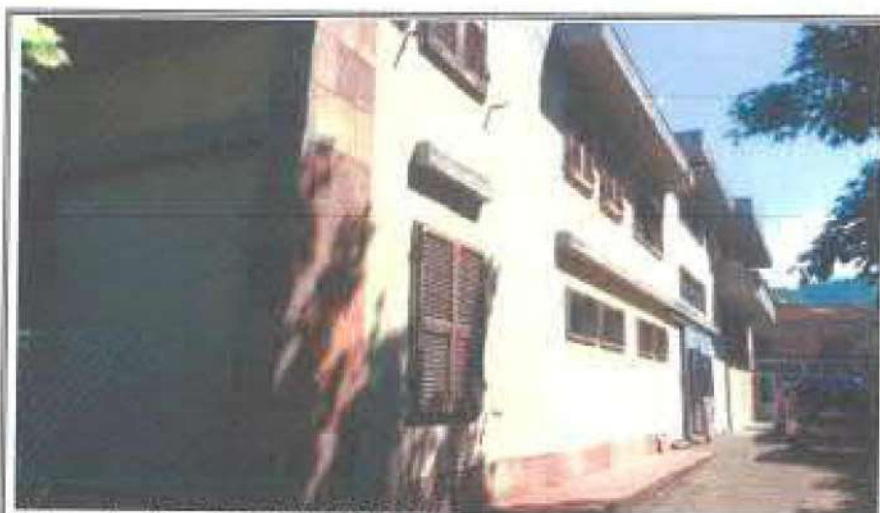
Foto n. 1 - Vista lato SUD del fabbricato