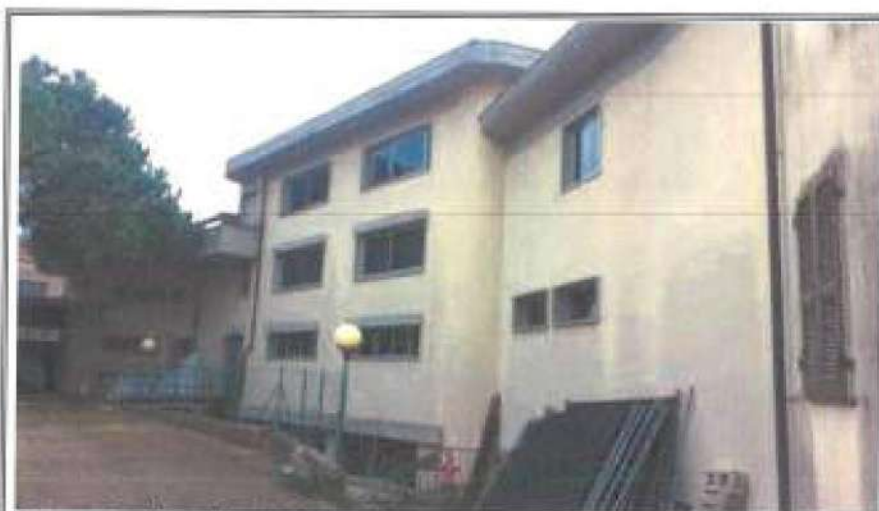
Foto n. 4 - Vista lato NORD del fabbricato