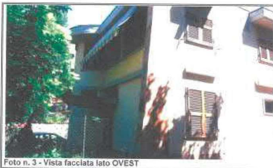
Foto n. 3 - Vista facciata lato OVEST