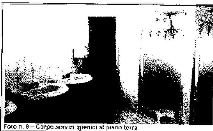
Foto n. 9 - Corpo servizi igienici al piano terra