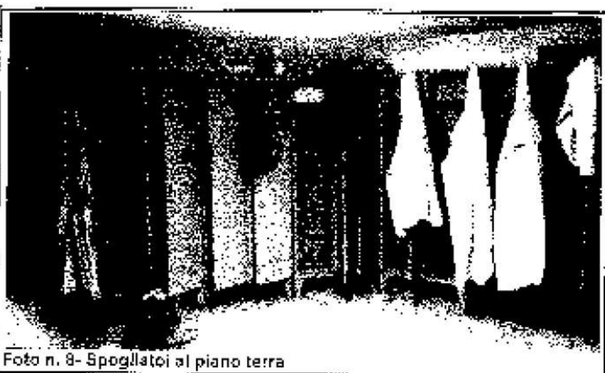
Foto n. 8- Spogliatoi al piano terra