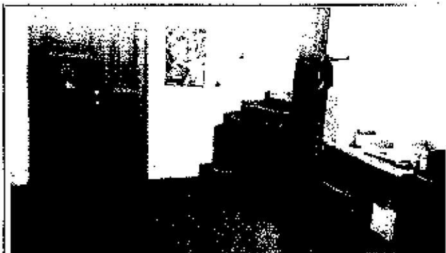
Foto n. 11 - Ufficio ingresso al piano terra