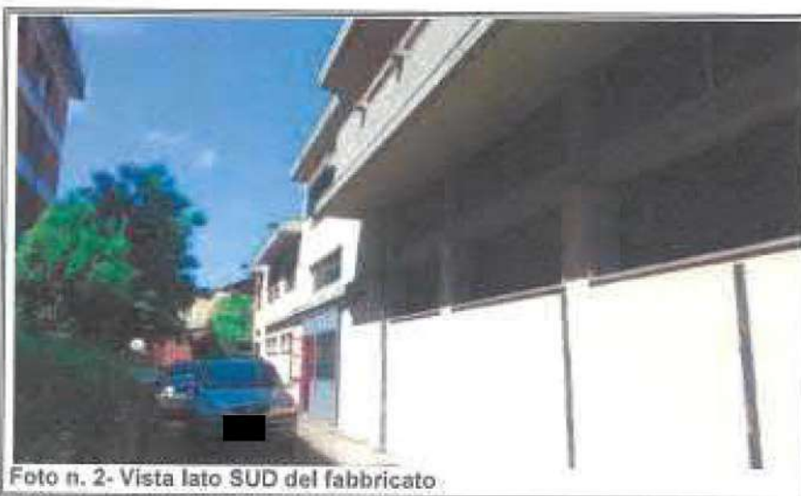
Foto n. 2 - Vista lato SUD del fabbricato