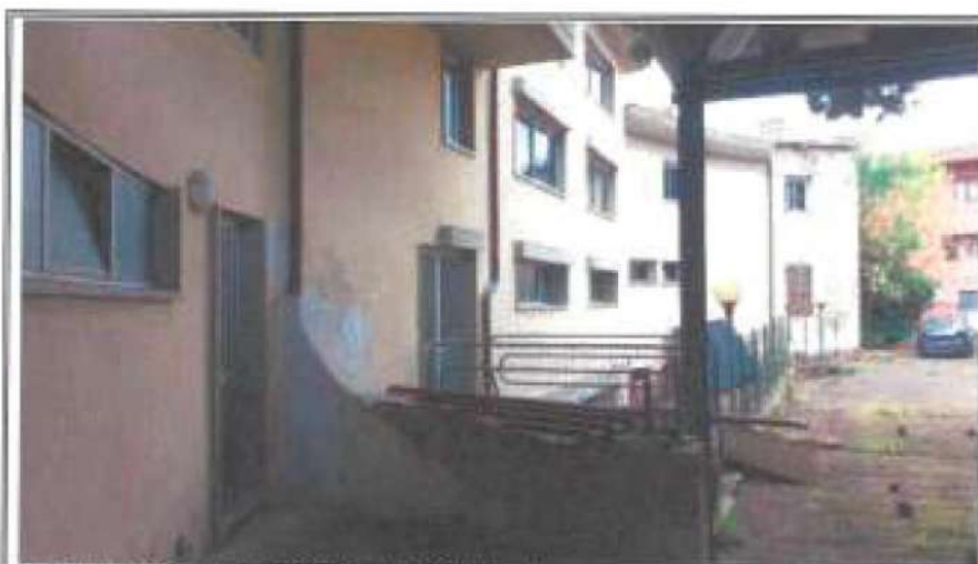
Foto n. 5 - Vista lato NORD del fabbricato