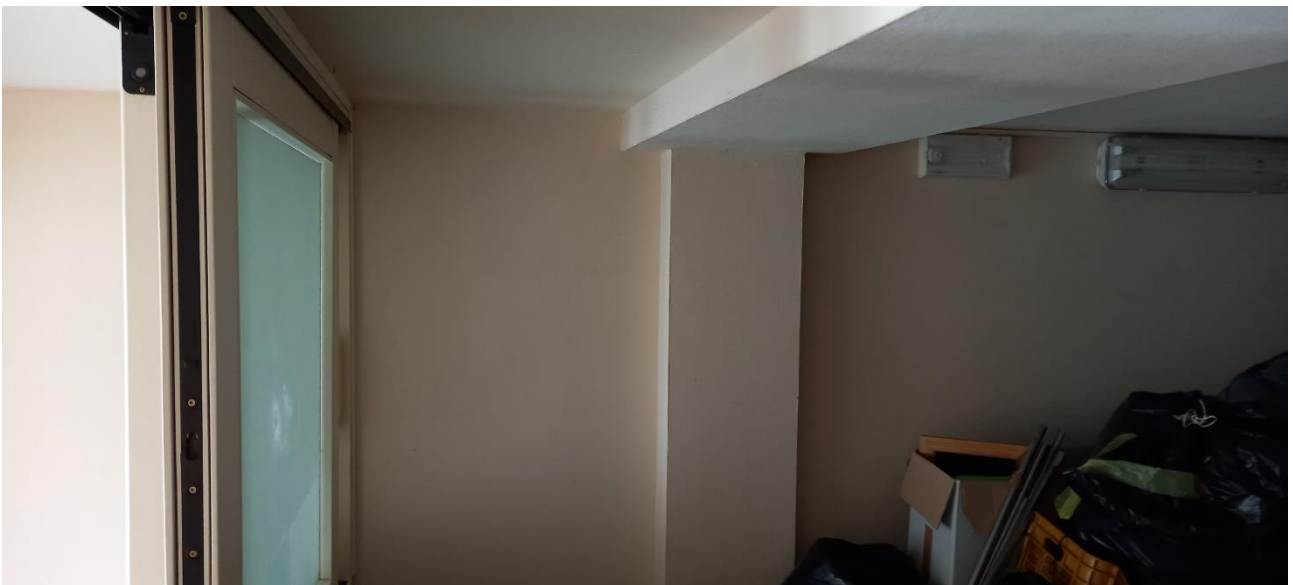
Foto 10 - Piano mezzanino