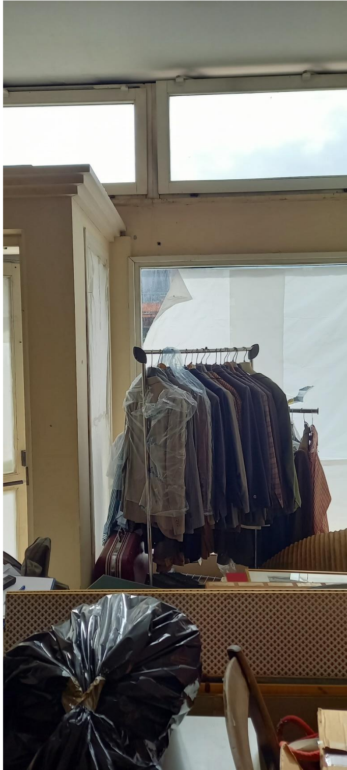
Foto 4 - Interno piano terra