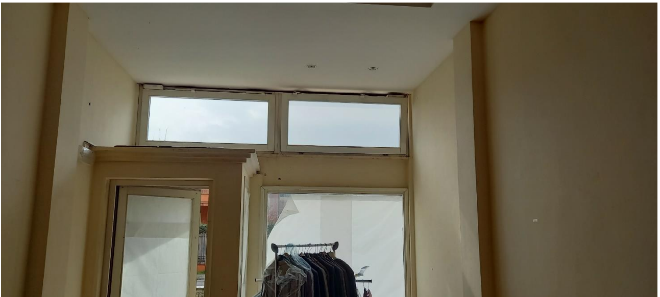
Foto 6 - Piano terra ingresso - infisso esterno