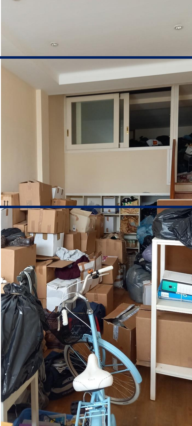
Foto 3 - Foto interno piano terra