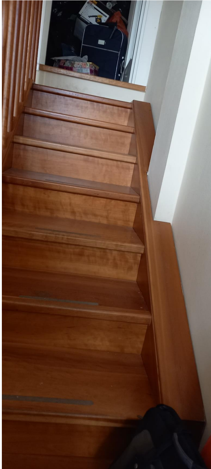
Foto 8 - Scala di accesso al mezzanino