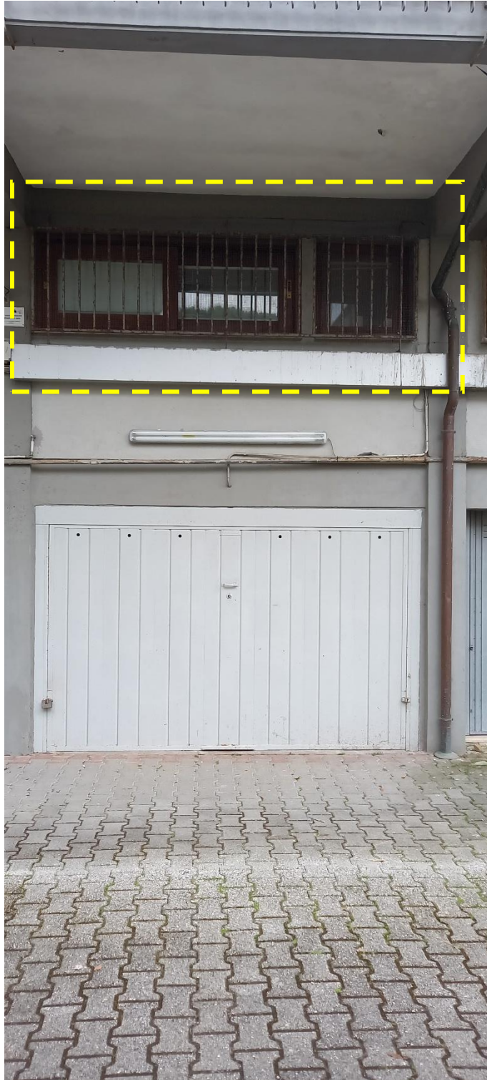
Foto 13 - Vista esterna lato Carrara