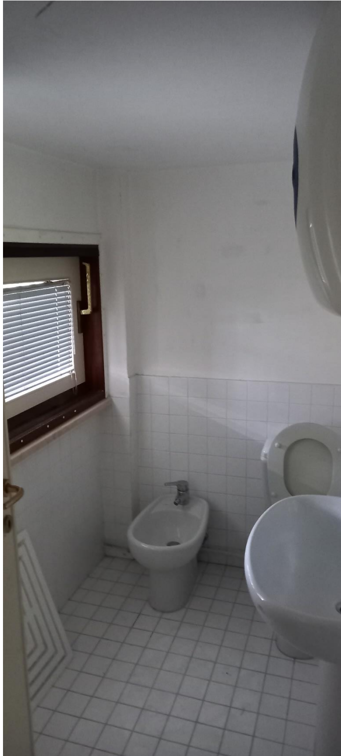
Foto 12 - Vista bagno