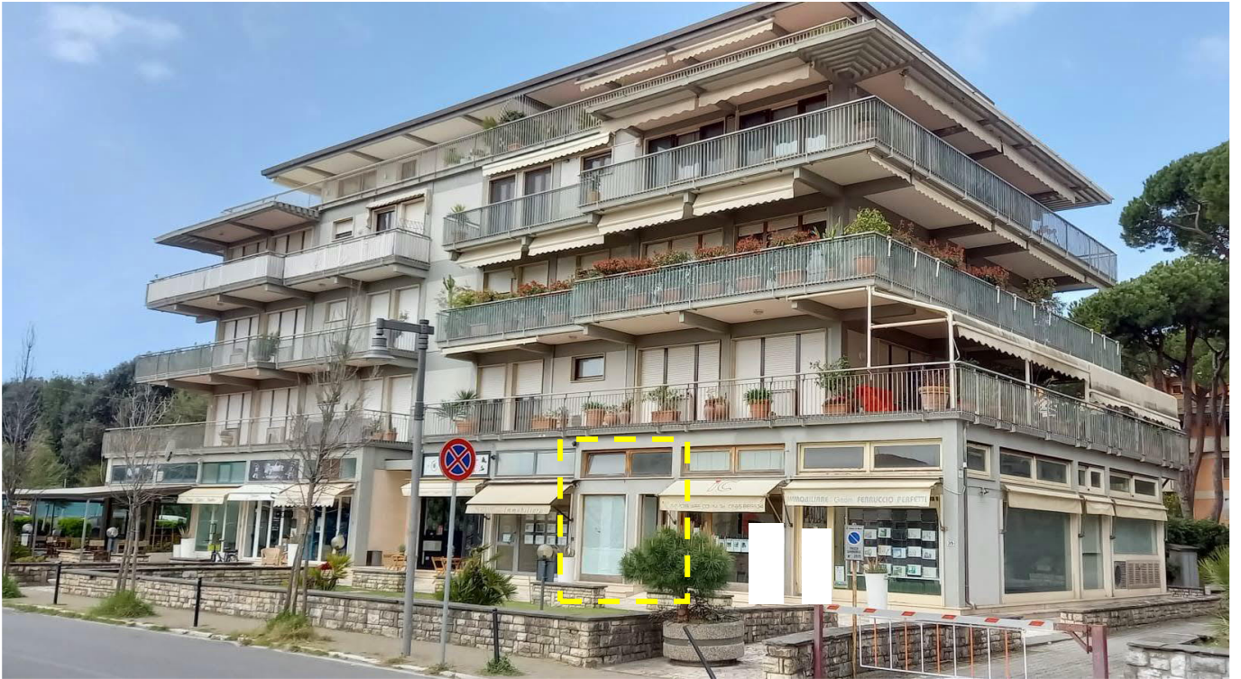
Foto 1 - Vista condominio con inquadrato il fondo oggetto della presente