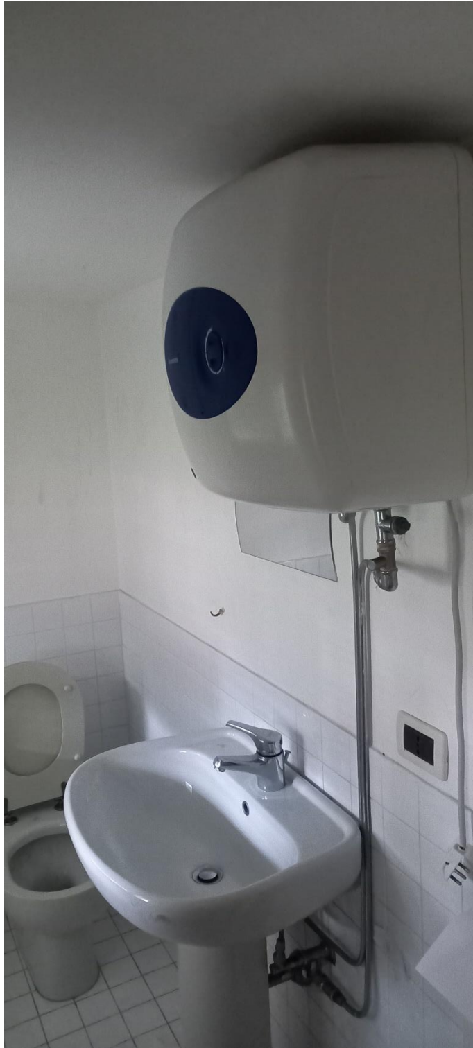
Foto 11 - Vista bagno