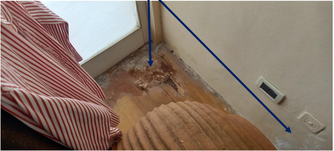
Foto 5 - Piano terra in prossimità infisso esterno