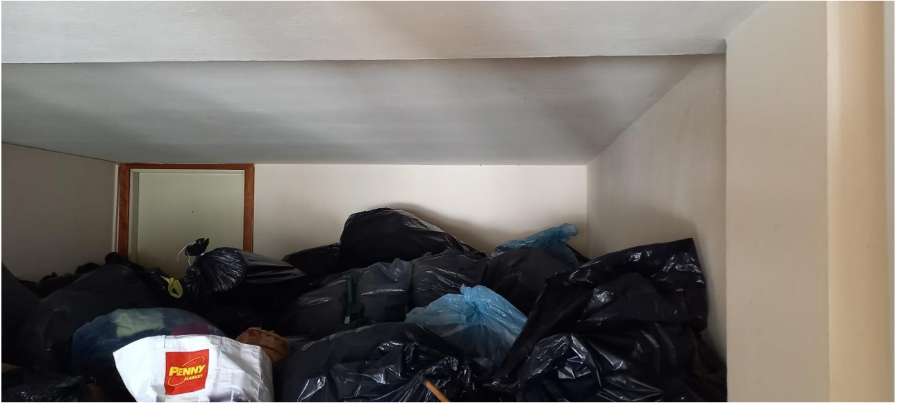
Foto 9 - Piano mezzanino