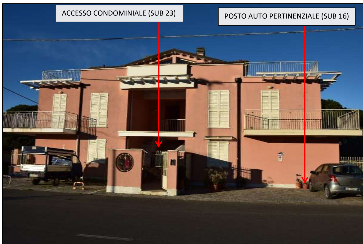
FOTO 3: Edificio censito al F. 118 mapp 232 - Compendio ubicato in fregio a Via Partaccia