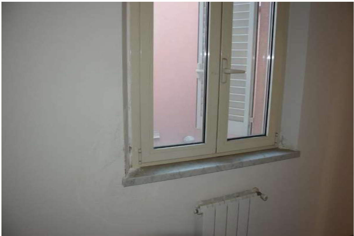
PARTICOLARE 2: MURATURA FINESTRA ARMADI