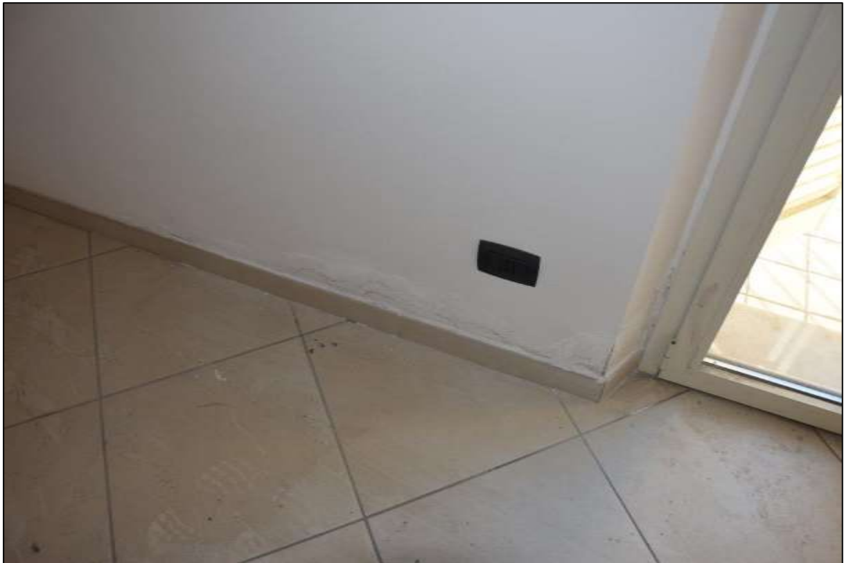
PARTICOLARE 1 - PORTAFINESTA - INFILTRAZIONI DAL BALCONE