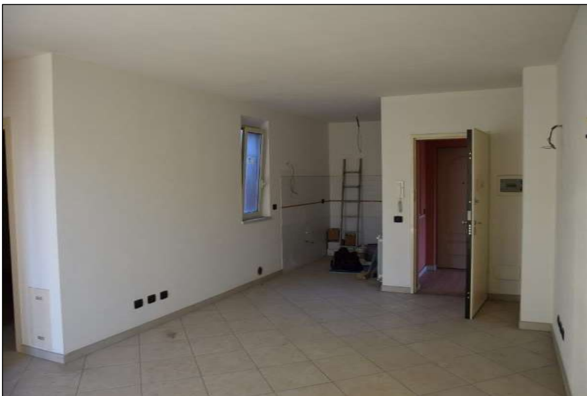
FOTO 9: PORTA DI ACCESSO, ZONA COTTURA E FINESTRA SU CAVEDIO ALTRA PROPRIETÀ