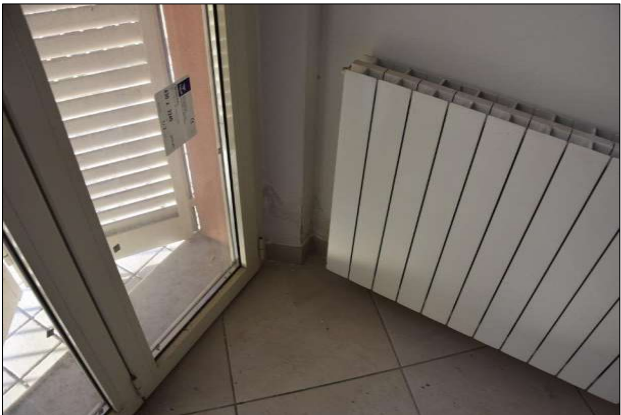
PARTICOLARE 1 - PORTAFINESTA - INFILTRAZIONI DAL BALCONE