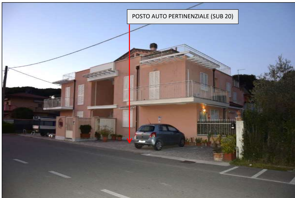
FOTO 22: EDIFICIO CENSITO AL F. 118 MAPP 232 - COMPENDIO UBICATO IN FREGIO A VIA PARTACCIA - FOTO PARCHEGGI PERTINENZIALI ALLE UNITÀ IMMOBILIARI