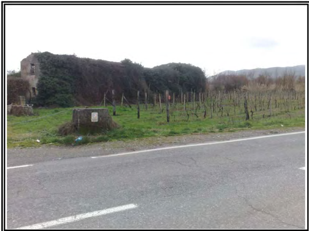
Foto n. 4 – Terreno mappali 42, 44, 45, 252, 253, 254, 255, 311, 161