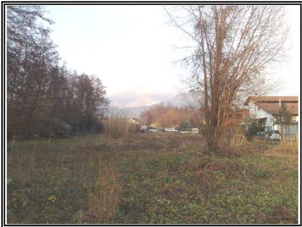
Foto n. 3 - Vista verso mare all'interno del terreno