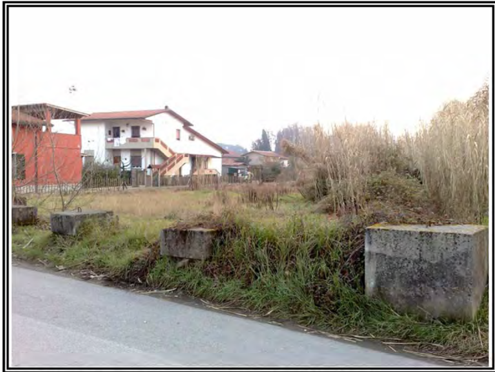
Foto n. 1 - Lato del terreno attestato su Via Trento