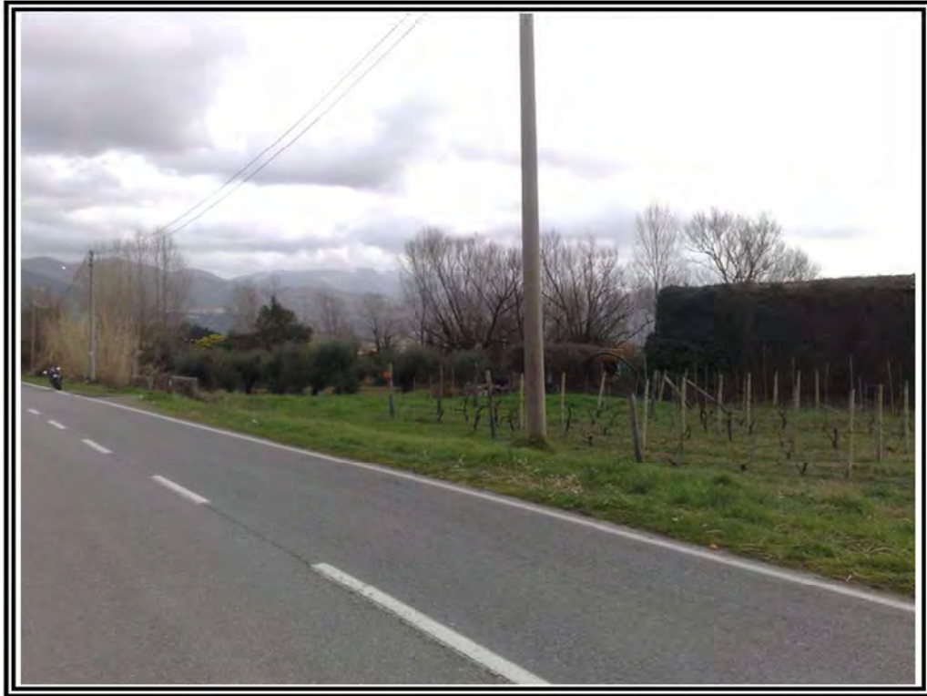
Foto n. 3 – Terreno mappali 42, 44, 45, 252, 253, 254, 255, 311, 161