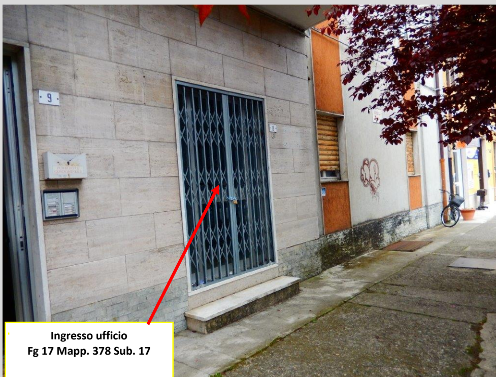
Ingresso ufficio Fg 17 Mapp. 378 Sub. 17

Vista Esterna: Lotto 3 – FG. 17 MAPP. 378 SUB. 17