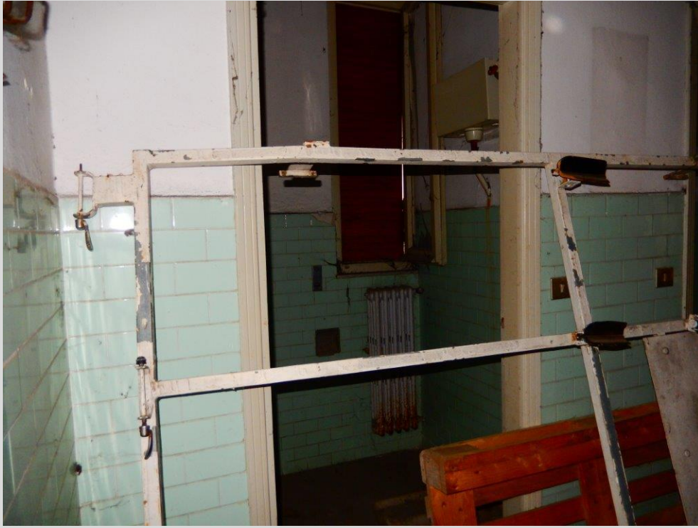
Vista Interna: Lotto 3 – FG. 17 MAPP. 378 SUB. 16 Bagni