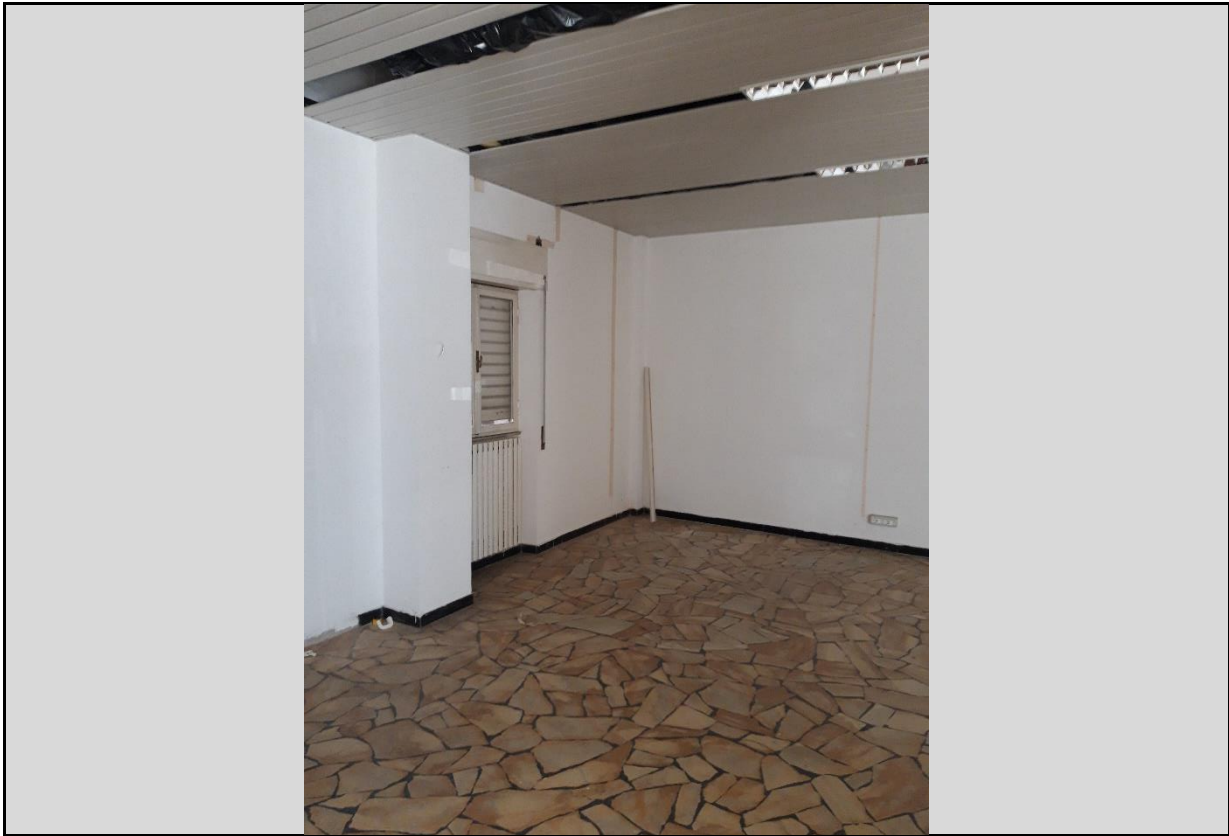
Vista Interna: Lotto 3 – FG. 17 MAPP. 378 SUB. 17 Vista soffitti ufficio