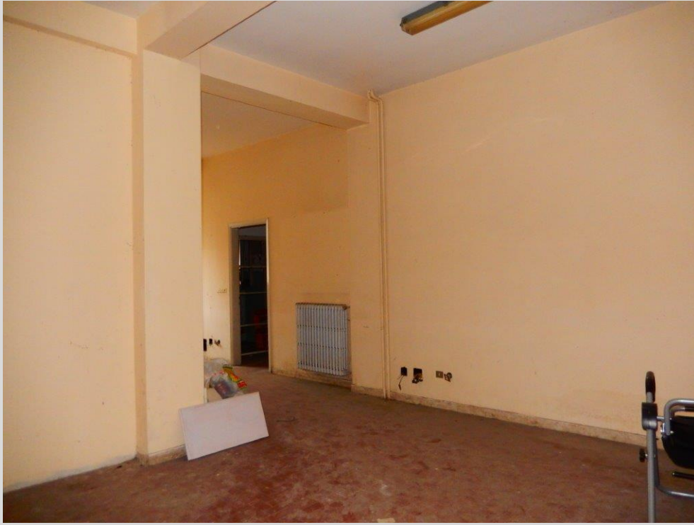
Vista Interna: Lotto 3 – FG. 17 MAPP. 378 SUB. 16 Vista ufficio