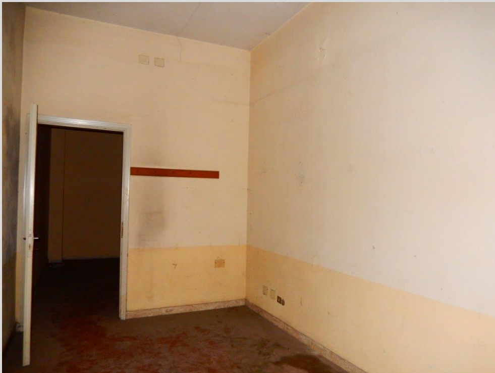
Vista Interna: Lotto 3 – FG. 17 MAPP. 378 SUB. 16 Ufficio 2