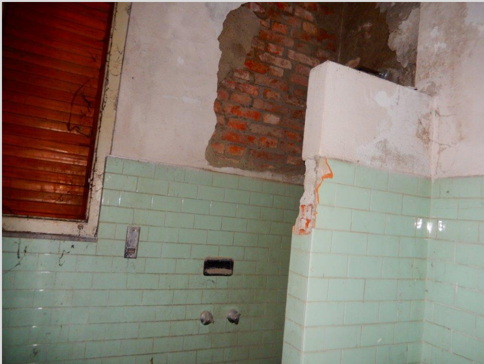
Vista Interna: Lotto 3 – FG. 17 MAPP. 378 SUB. 16 Bagno