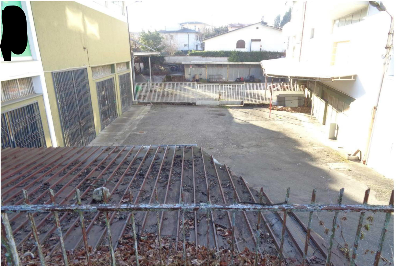
Vista del mapp.le 27 (BCNC) e del tetto del sub 12. Foto scattata da sopra il sub 19 📍