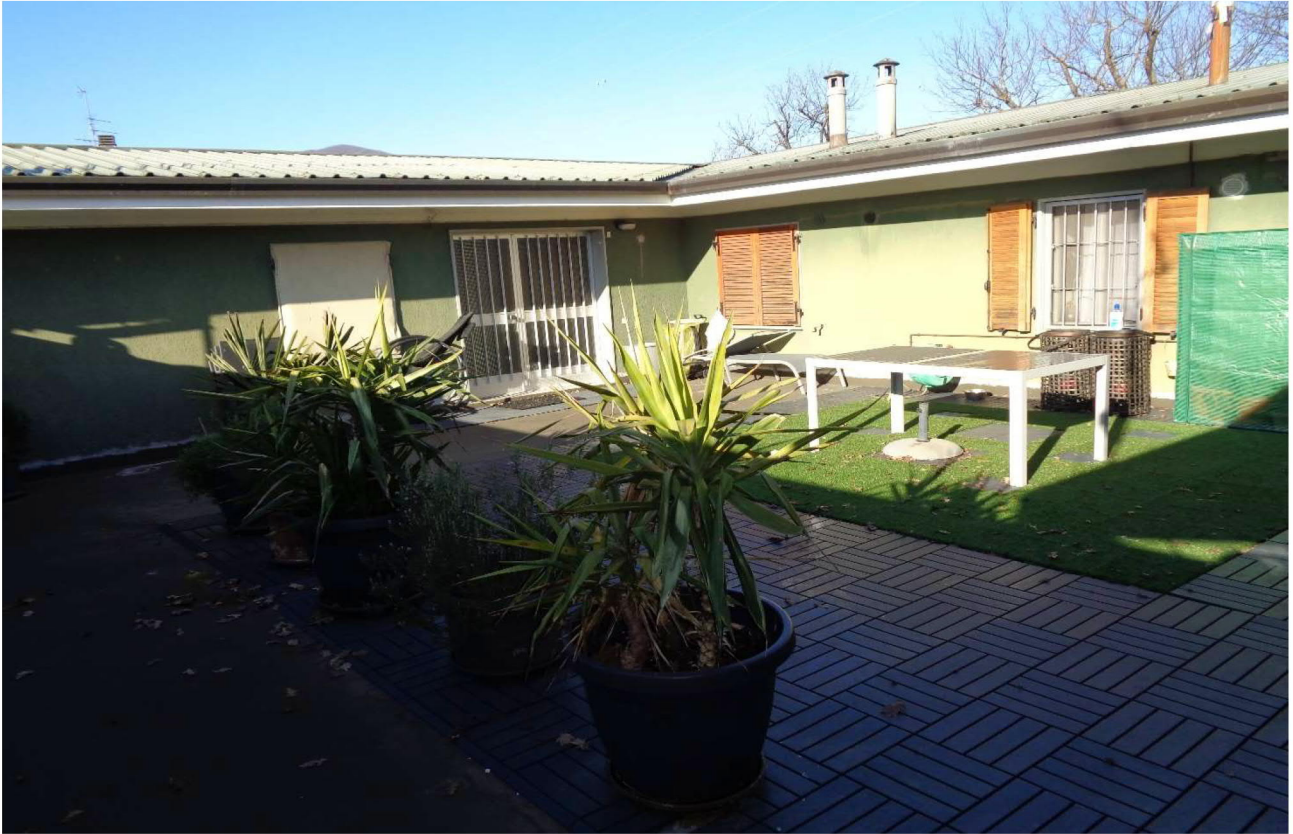
Vista del terrazzo comune agli appartamenti 📍