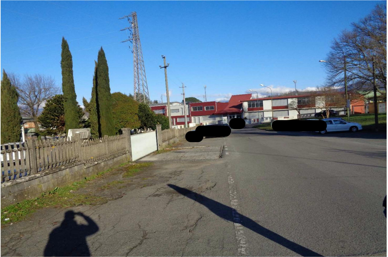
Vista del cancello carrabile che dovrebbe insistere sul solo mapp.le 216. Foto scattata dalla pubblica via 📍