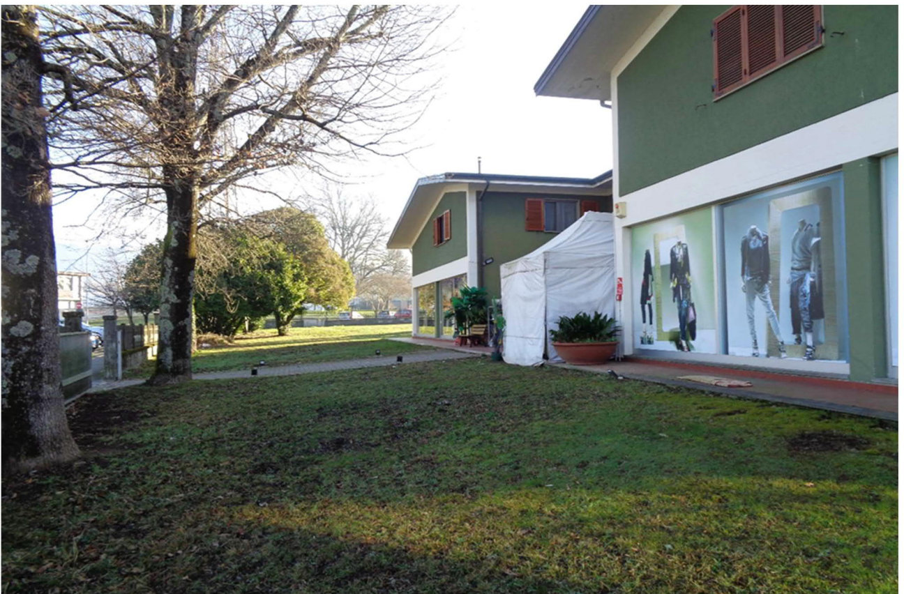
Vista del mapp.le 592 che dopo dopo la struttura commerciale si lega con il mapp.le 210. La foto è stata scattata dalla parte del mapp.le 592 che confina con il sub 19 📍