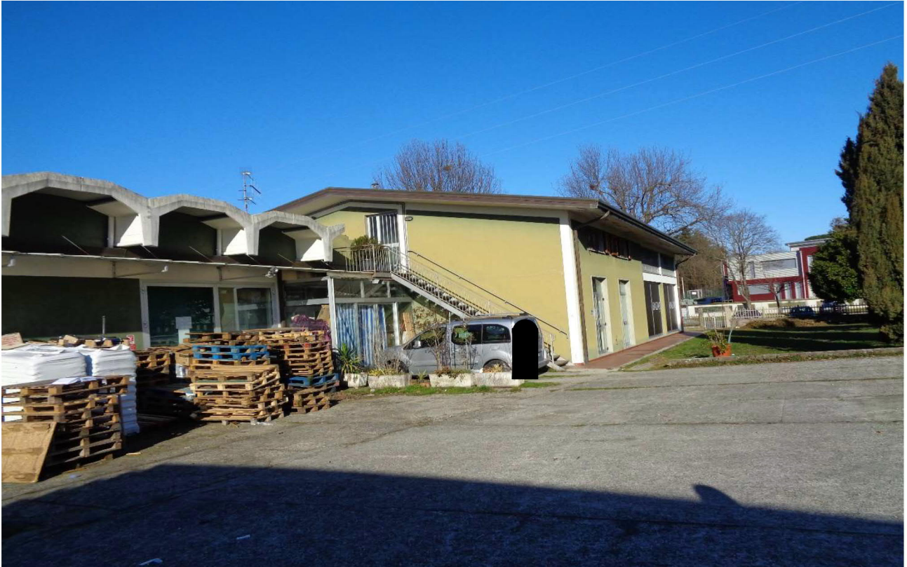
Vista della parte retrostante del fondo commerciale e della parte finale dei mapp.li 216 e 210. La scala e l'area in cui sono poggiati i pancali in legno e in cui è posteggiata l'auto sono collocati sul sub 20 (BCNC). La foto è stata scattata dal mapp.le 217 📍