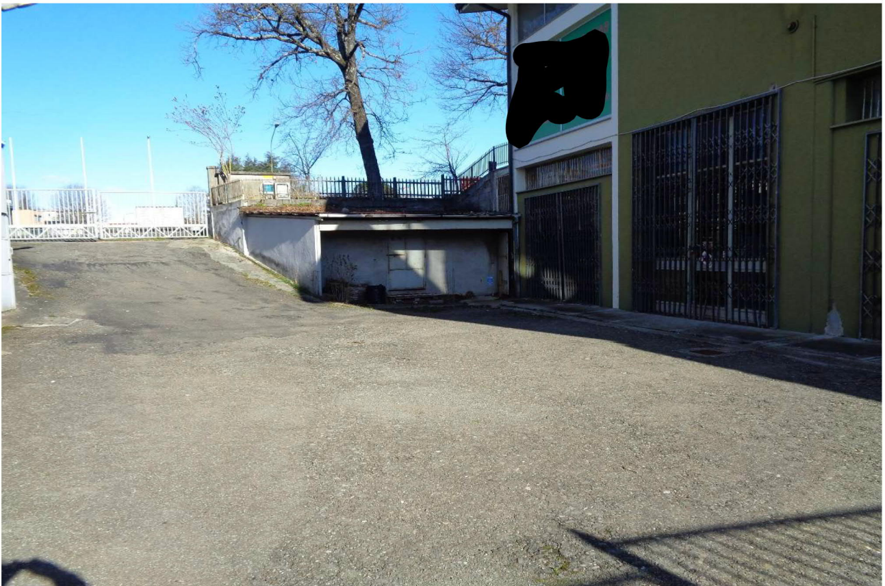
Vista della rampa e del piazzale di cui al sub 27 (BCNC) da cui si accede ai locali posti sotto strada a mezzo di cancello carrabile 📍