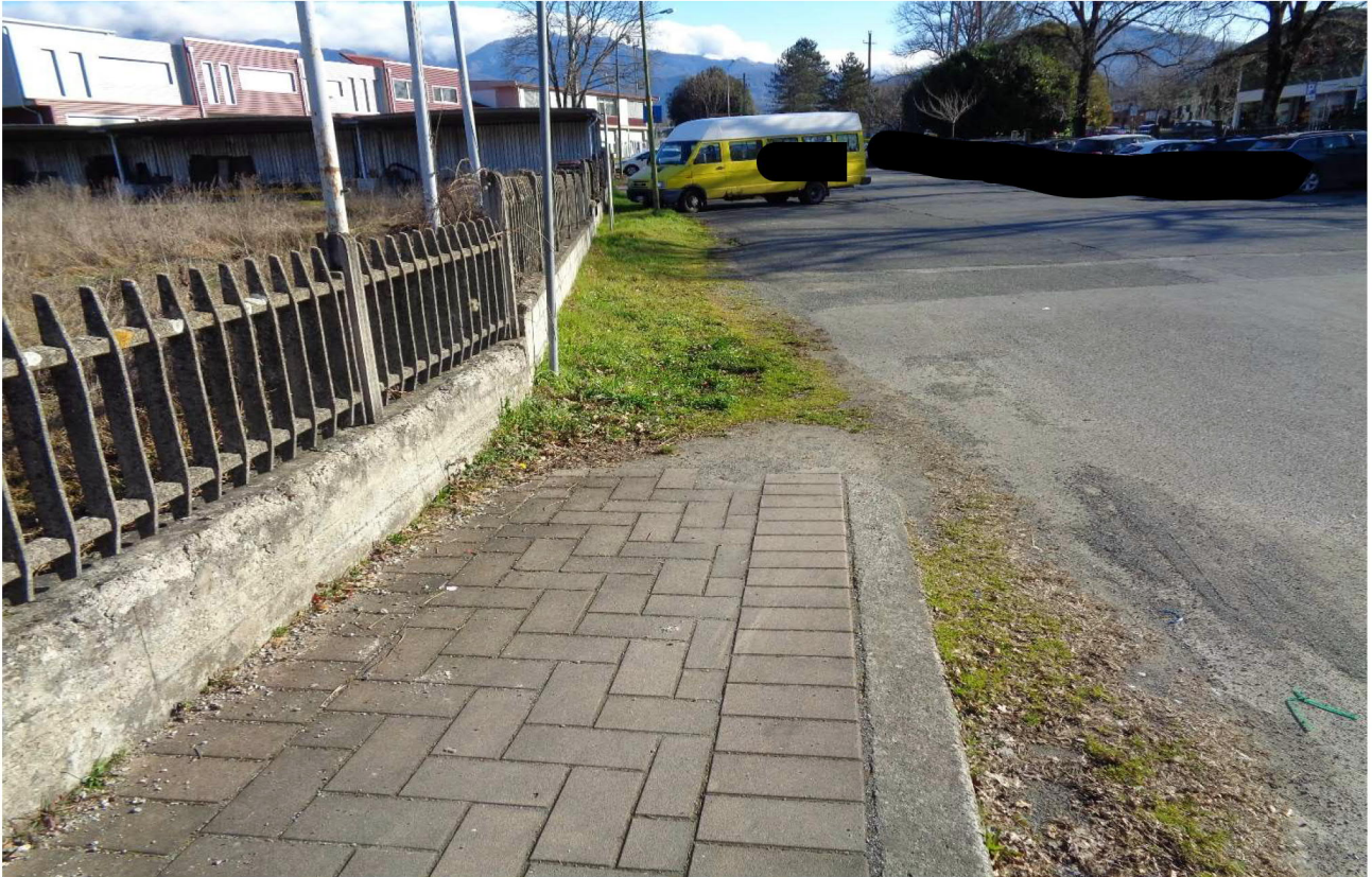
Vista del mappa.le 208 da cui si accede ai terreni (mapp.li 991 e 997) e tettoie mapp.le 947, sub 2 (in parte abusive)