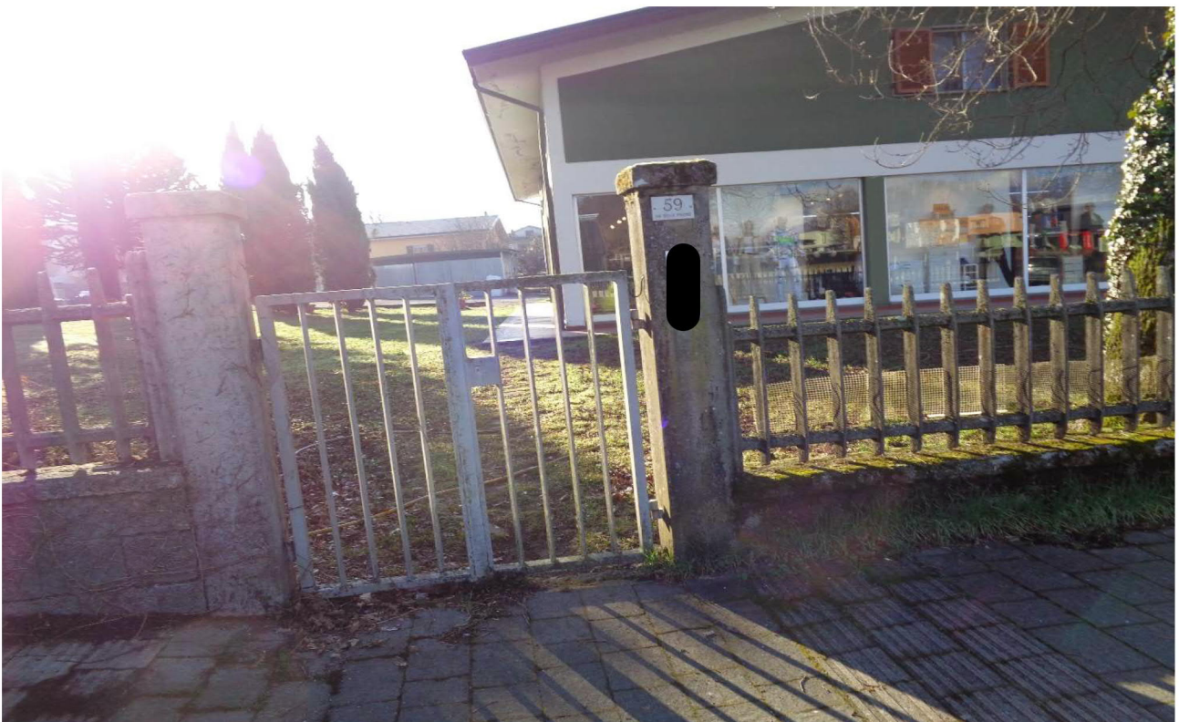
Vista del cancello pedonale che insiste sul mapp.le 210 e su cui sono inseriti i citofoni degli appartamenti. Foto scattata dalla pubblica via 📍