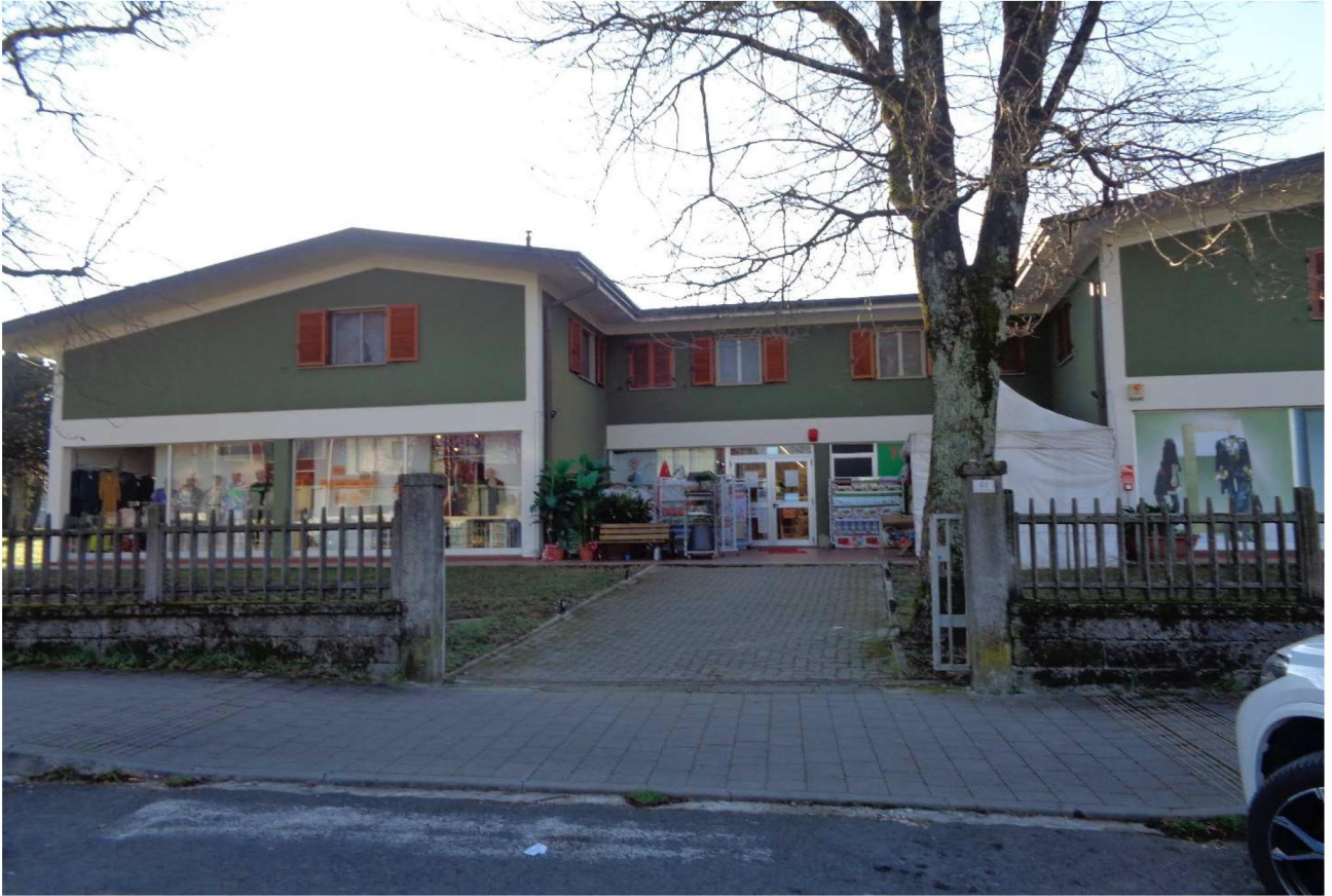
Ingresso al fondo commerciale 📍