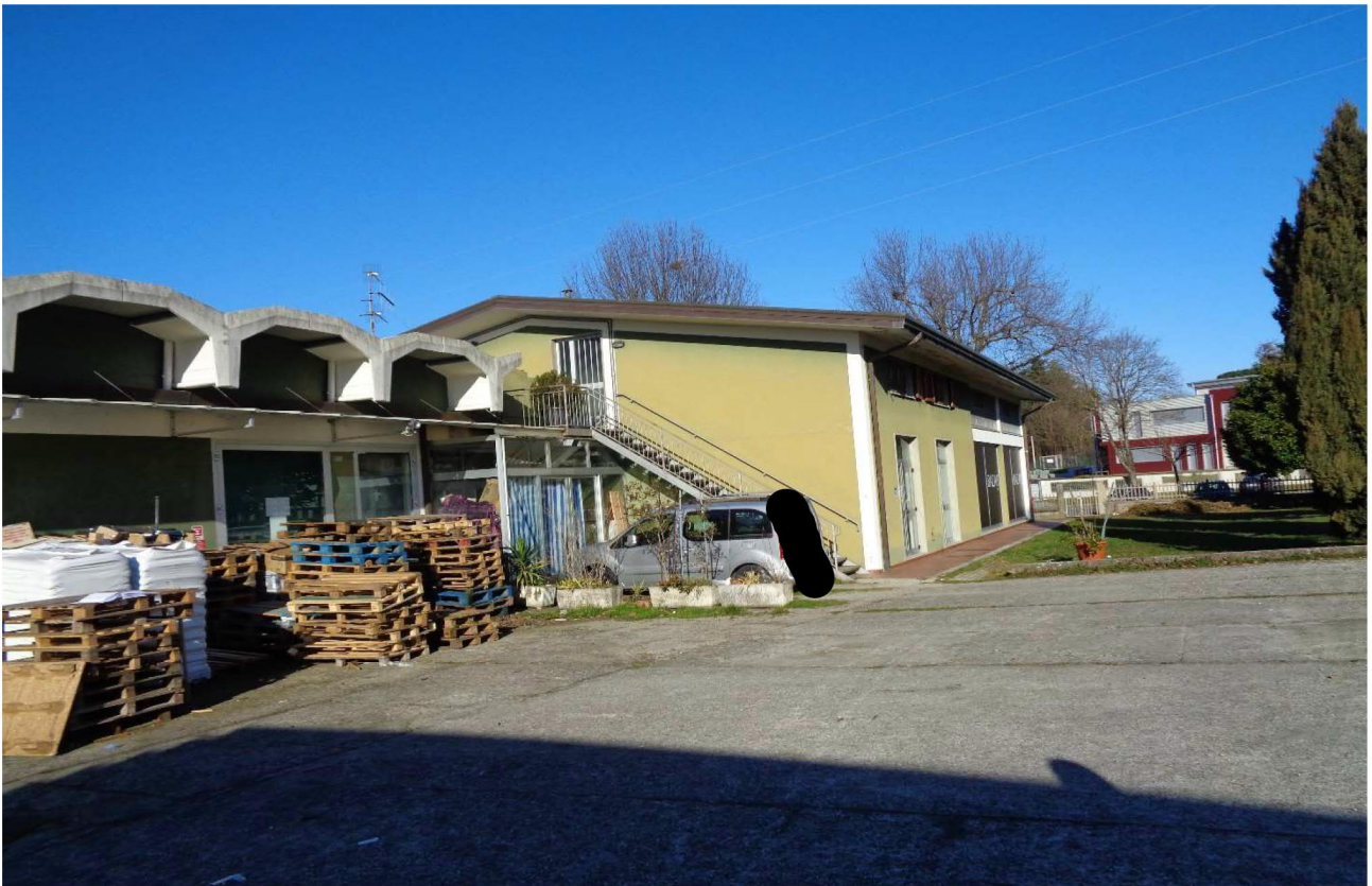
Scala accesso appartamenti collocata sul sub 20 (BCNC) e porta di accesso al pianerottolo su cui insiste l'ingresso dell'appartamento di cui al sub 2 e da cui si raggiunge il terrazzo comune a tutti le unità abitative