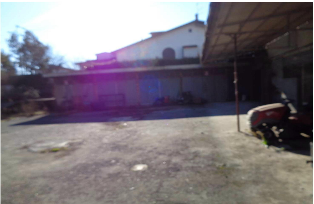
In fronte vista del mapp.le 13 📍