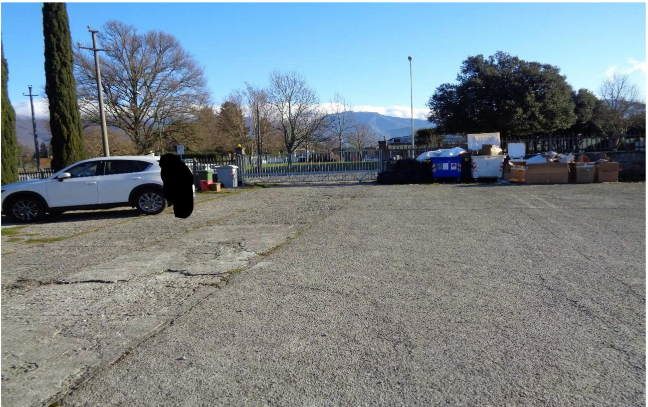
Vista del cancello carrabile che dovrebbe insistere sul solo mapp.le 216 📍 . Foto scattata dall'interno della recinzione