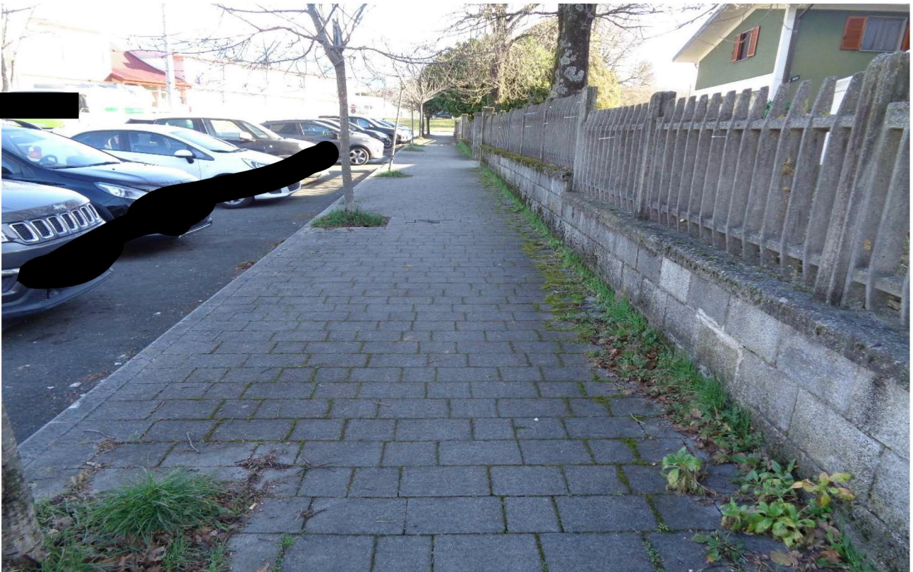
Vista del marciapiede che dovrebbe essere identificato al mapp.le 572 📍