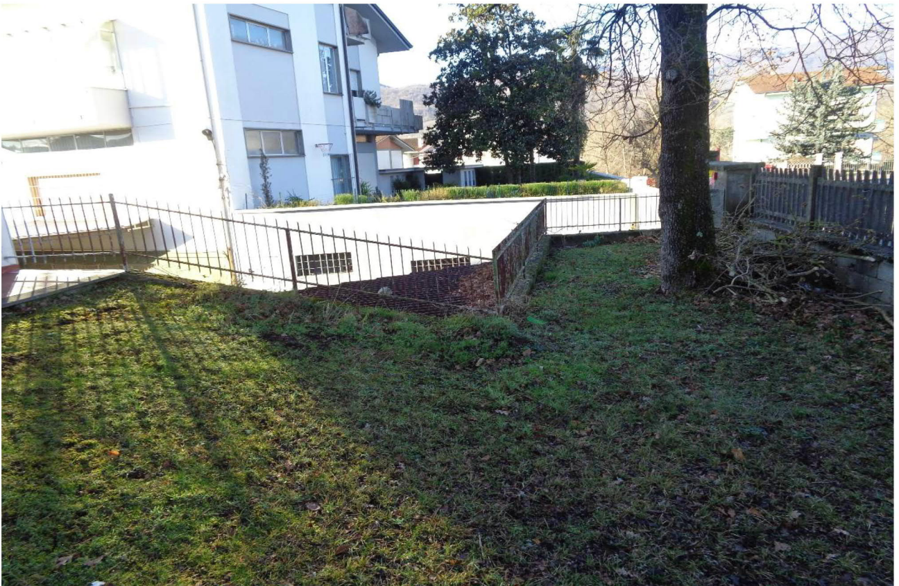
Vista del mapp.le 592 che dopo la ringhiera si lega al mapp.le 19 (BCNC), Il Sub 19 è facilmente individuabile in quanto sullo stesso insiste una pianata di grandi dimensioni. 📍