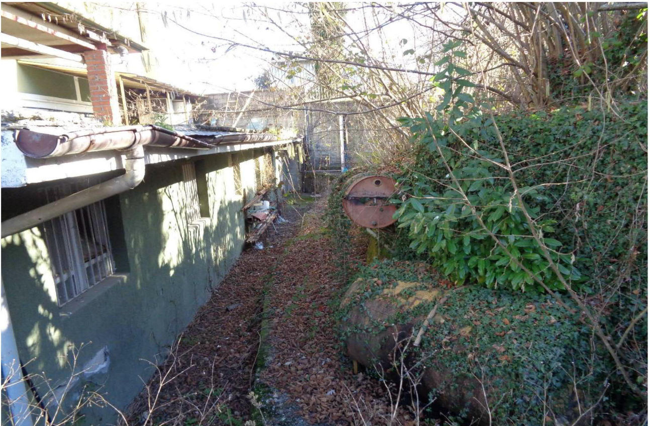
Vista mapp.le 20 (BCNC) nella parte adiacente al sub 14 📍