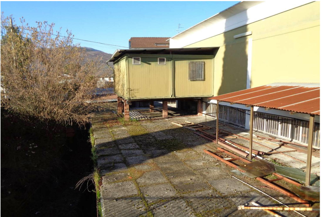
Vista del tetto del sub 14. Foto scattata dal sub 20 (BCNC) nella parte che confina con il sub 217 📍