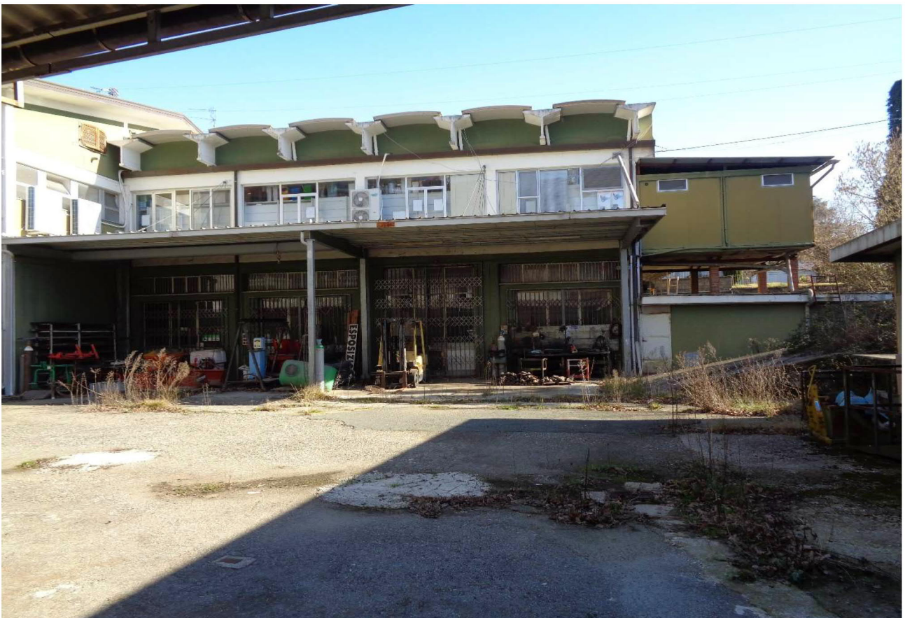
Vista della tettoia che posta in adiacenza al fabbricato principale ma collocata sul sub 20 (BCNC) e su cui sono ricoverate alcune attrezzature.