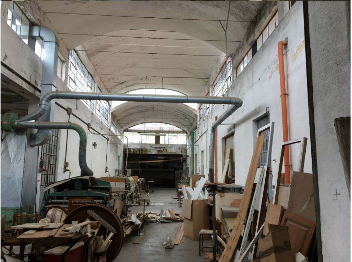
LOTTO 7 - INTERNI STABILIMENTO