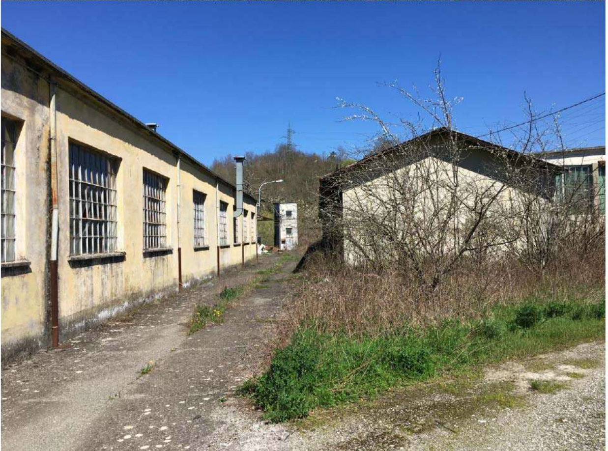
LOTTO 7 - ESTERNO STABILIMENTO E DEPOSITO