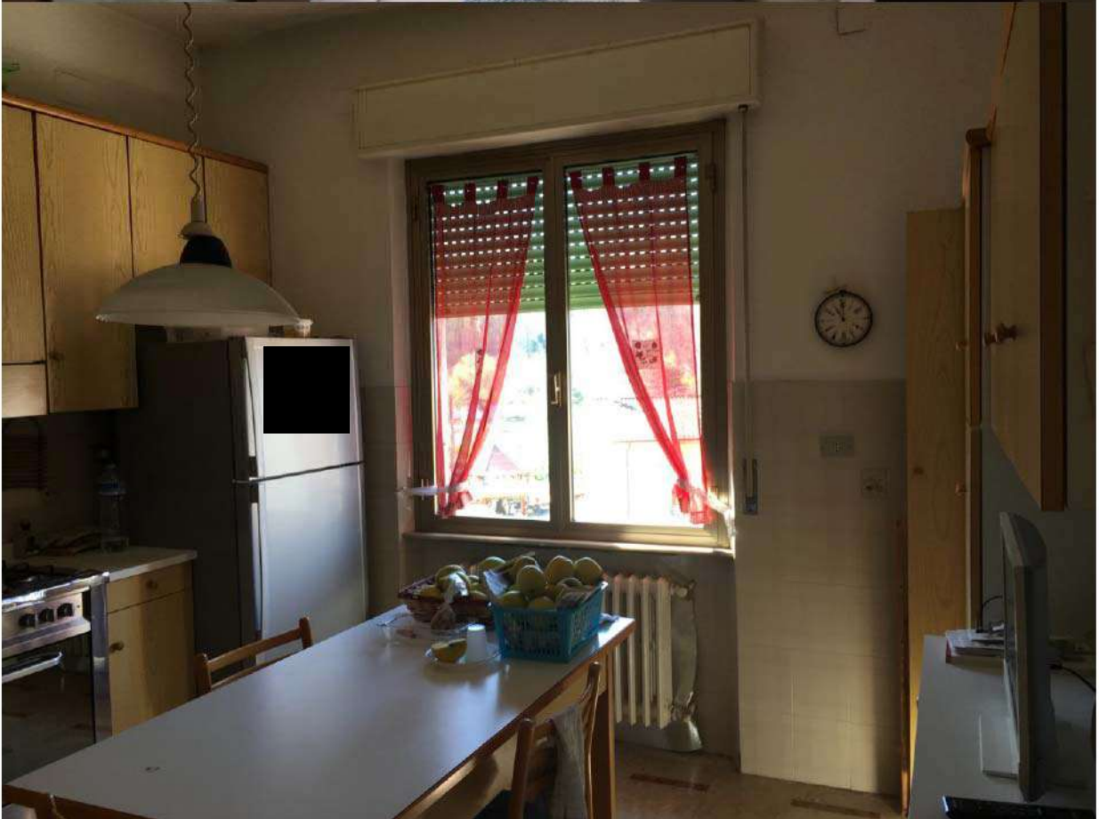
LOTTO 1 - INTERNI