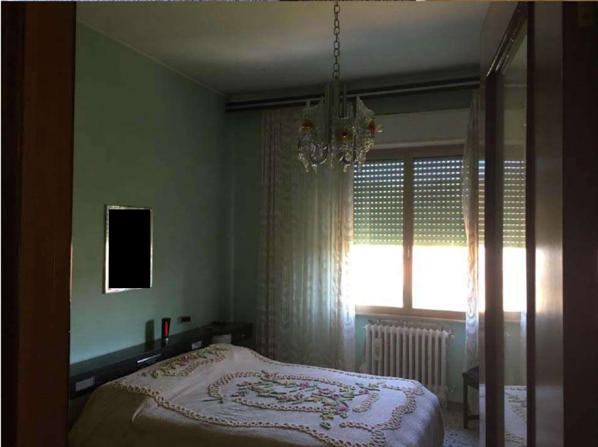
LOTTO 1 - INTERNI