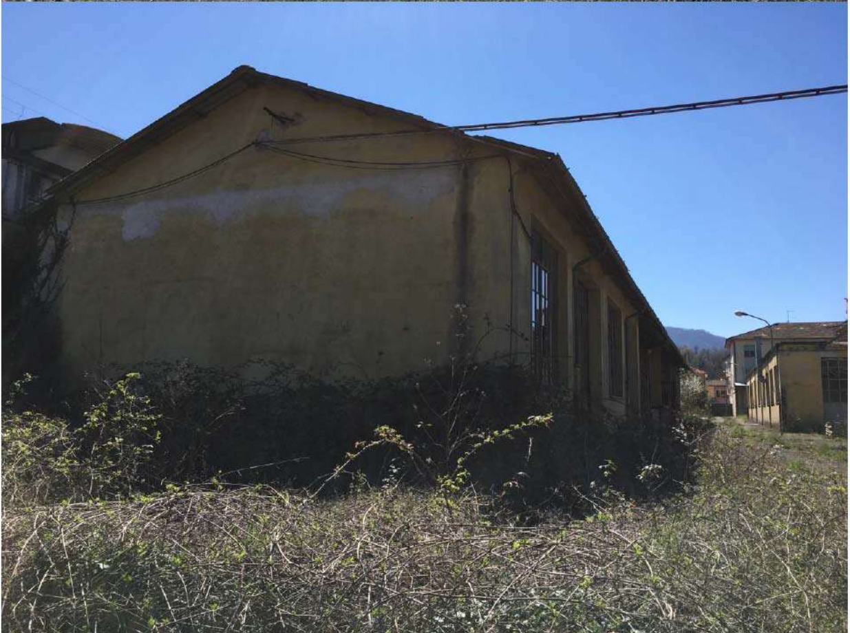
LOTTO 7 - CABINA ELETTRICA E SEGHERIA