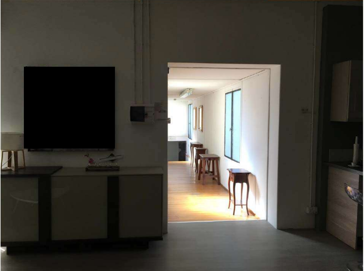
LOTTO 3 - INTERNO CON PASSERELLA DI COLLEGAMENTO