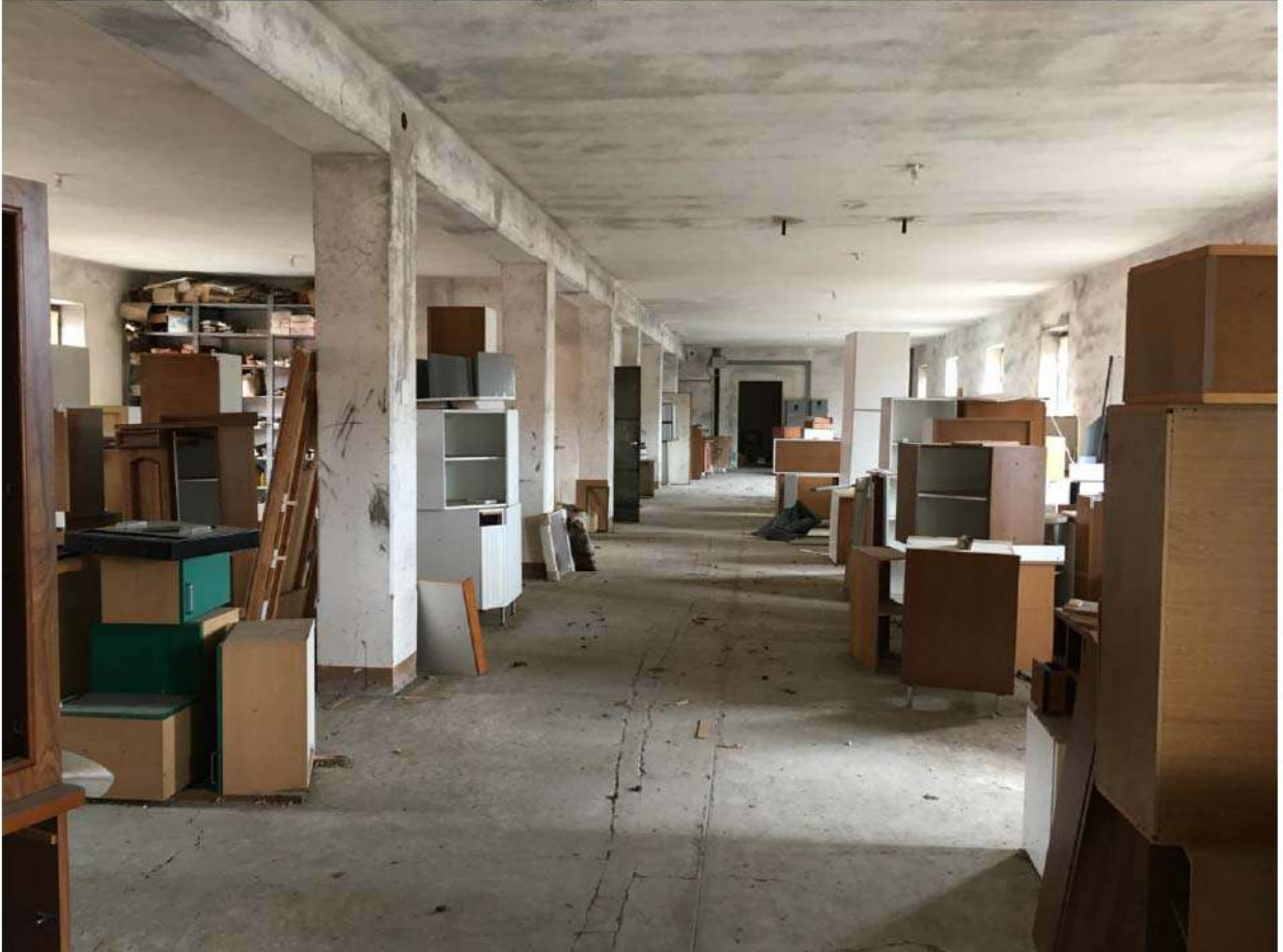
LOTTO 7 - SCANTINATO E PIANO PRIMO STABILIMENTO