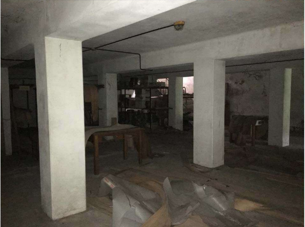
LOTTO 7 - INTERNO STABILIMENTO E SCANTINATO