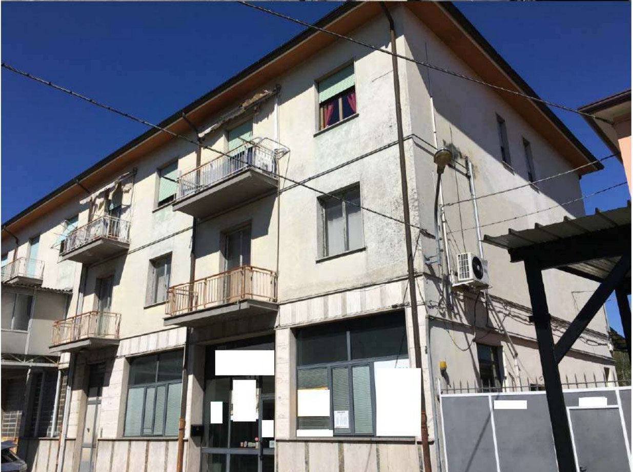
LOTTI 1-2-3-4-5 ESTERNI FABBRICATO