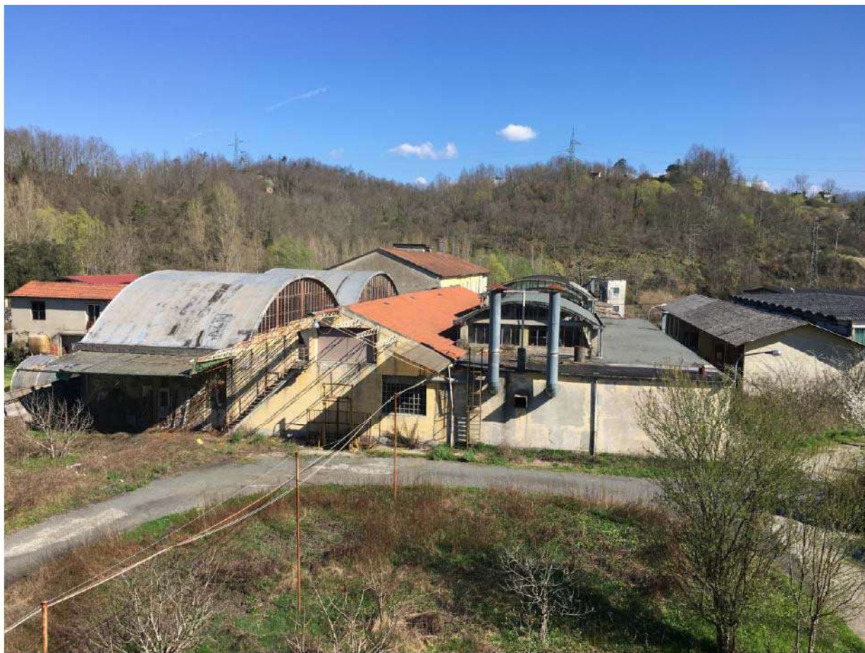
LOTTO 7 - VEDUTA STABILIMENTO DALL'ALTO