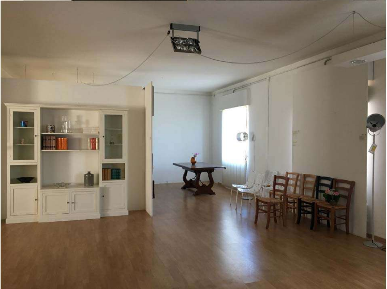
LOTTO 3 - INTERNI