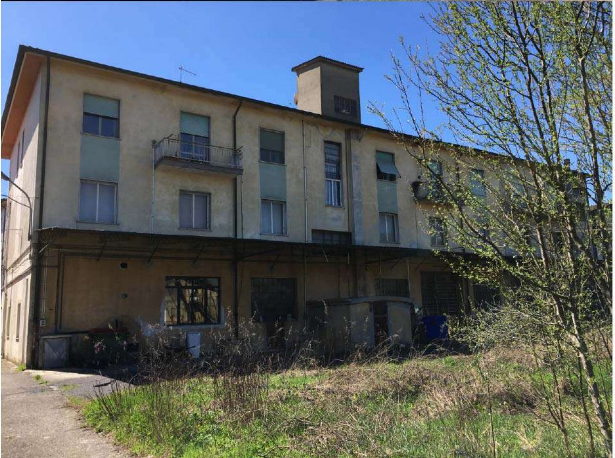
LOTTI 1-2-3-4-5 ESTERNI FABBRICATO