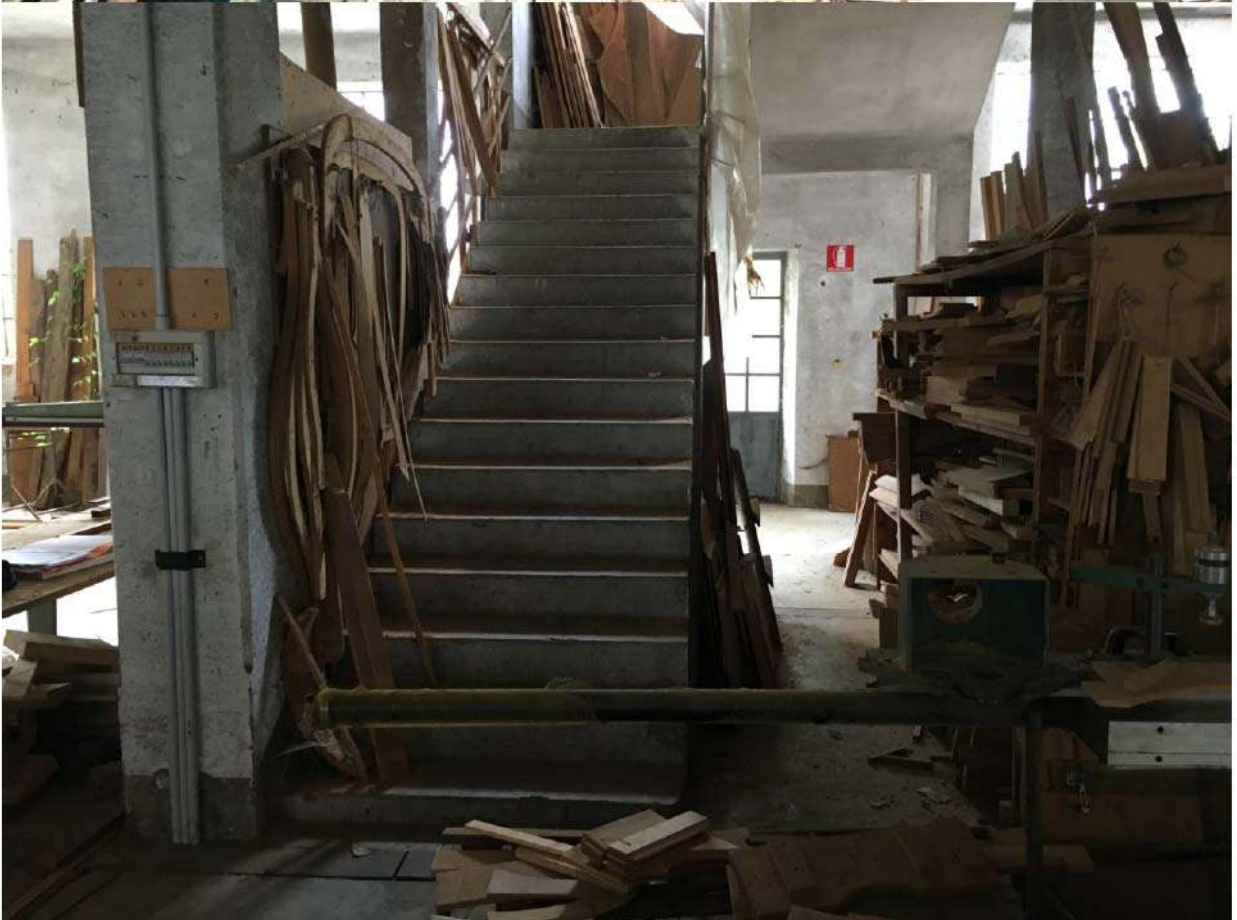
LOTTO 7 - SOTTOTETTO E SCALA INTERNA STABILIMENTO