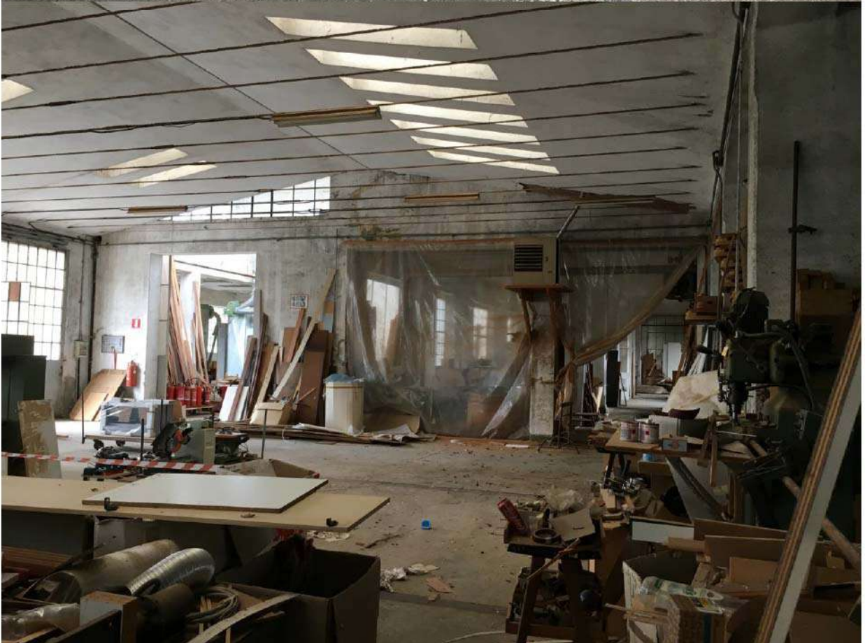
LOTTO 7 - ESTERNO ED INTERNO STABILIMENTO