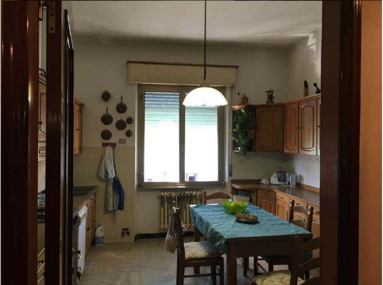
LOTTO 2 - INTERNI