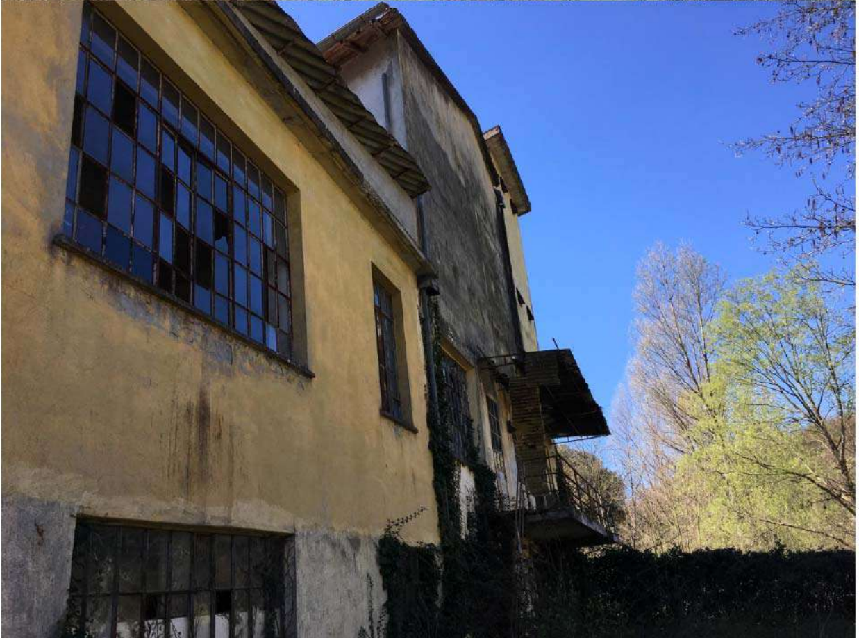
LOTTO 7 - SERVIZI PT, SEMINTERRATO E SILOS