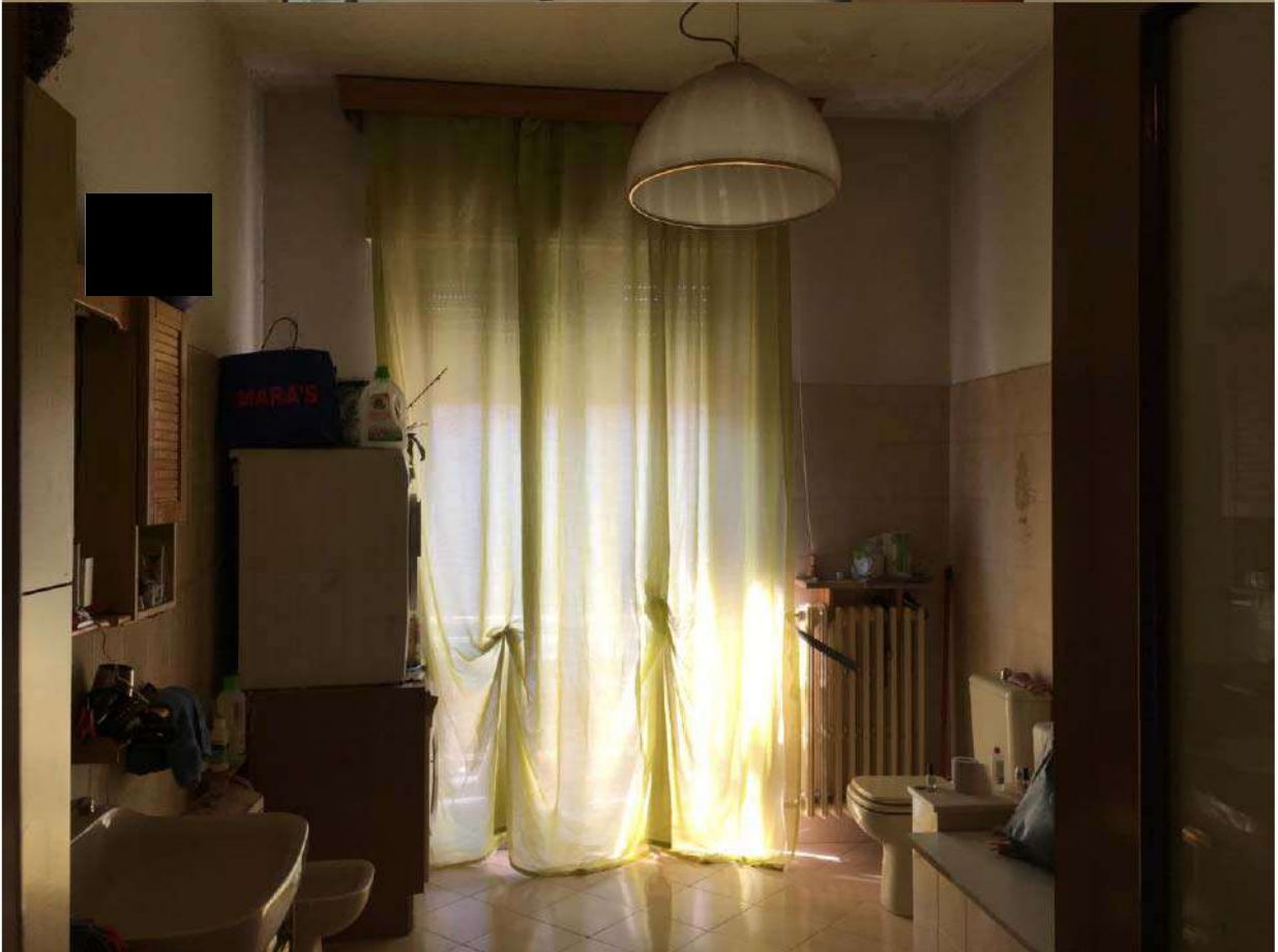
LOTTO 2 - INTERNI