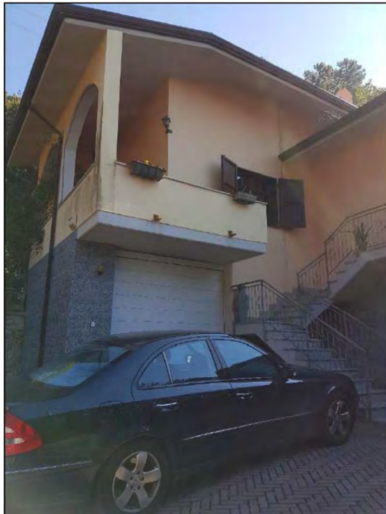
E.I. N. 35/17 – BANCA MONTE DEI PASCHI DI SIENA SPA contro