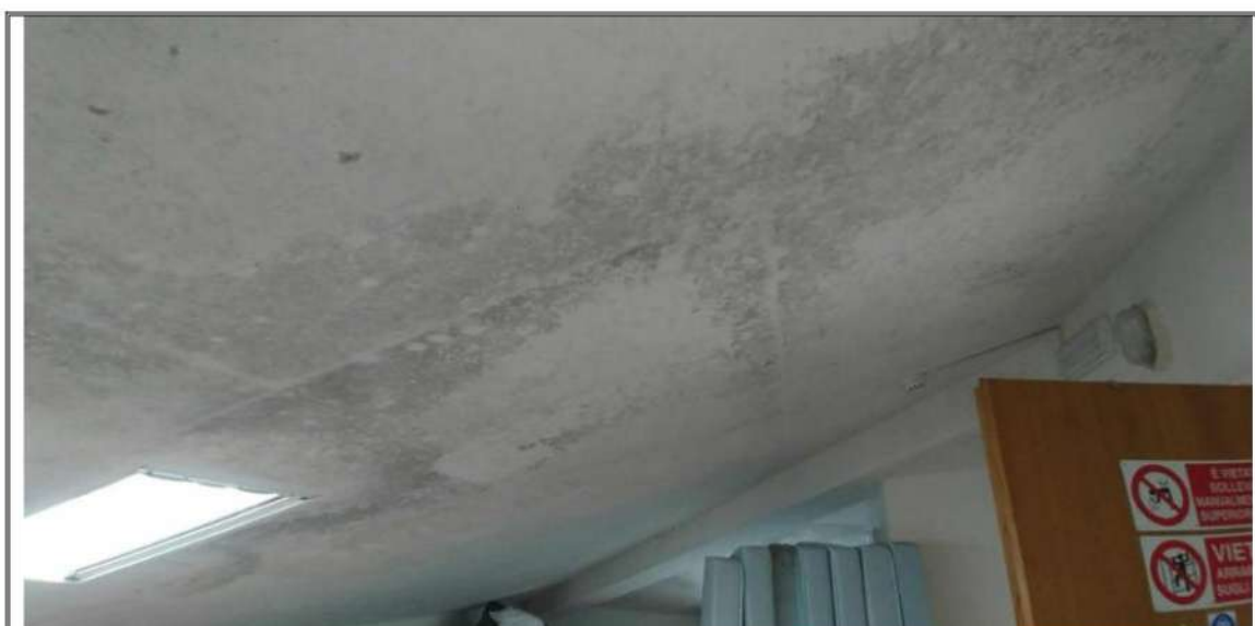
Foto n. 51 – Piano Sottotetto o terzo – Rilevamento stato delle controsoffittature