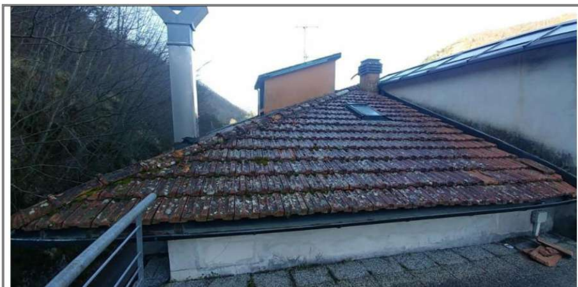
Foto n. 44 – Piano Copertura – Manto copertura del blocco preesistente