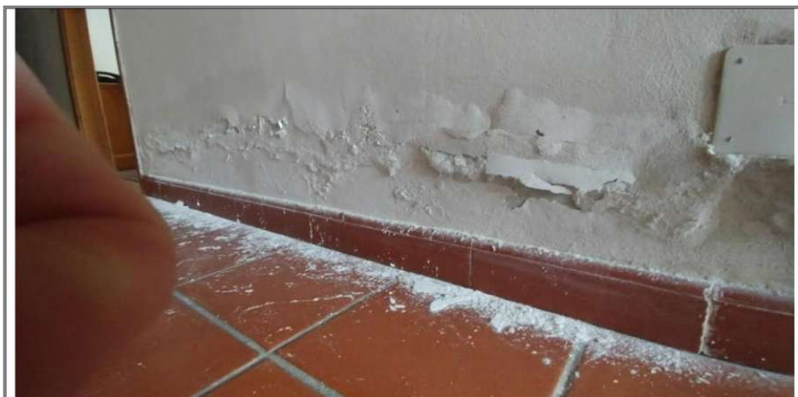
Foto n. 38 – Piano Secondo – Rilievo sfogliature alla base del muro del corridoio