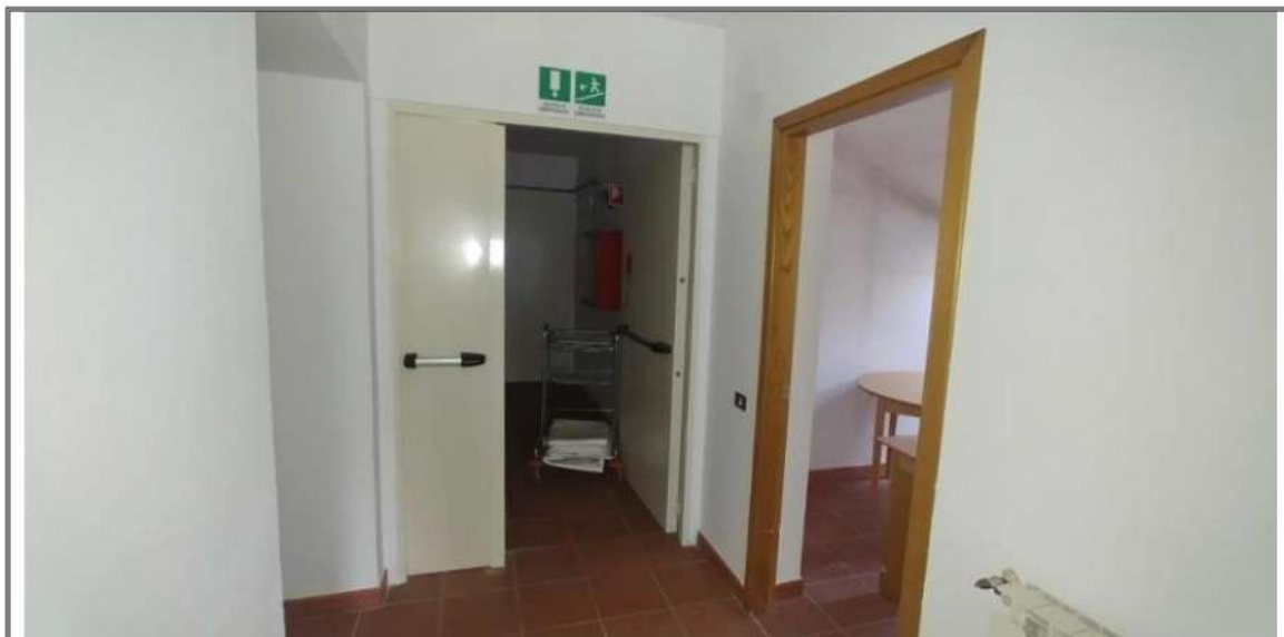
Foto n. 46 – Piano Sottotetto o terzo - Corridoio di distribuzione