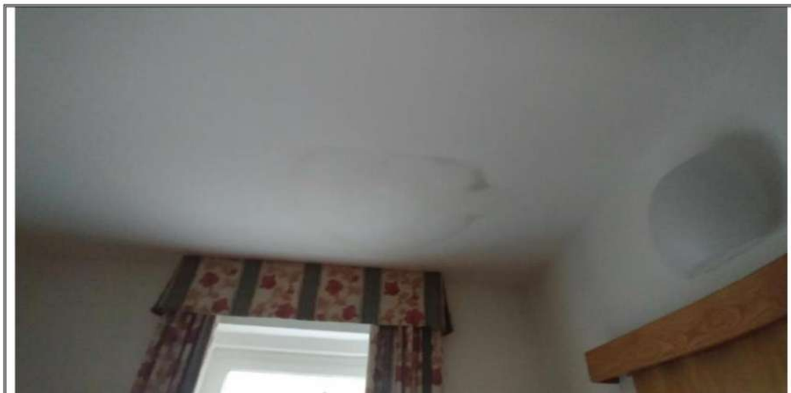
Foto n. 37 – Piano Secondo – Rilievo infiltrazioni sul soffitto di una camera