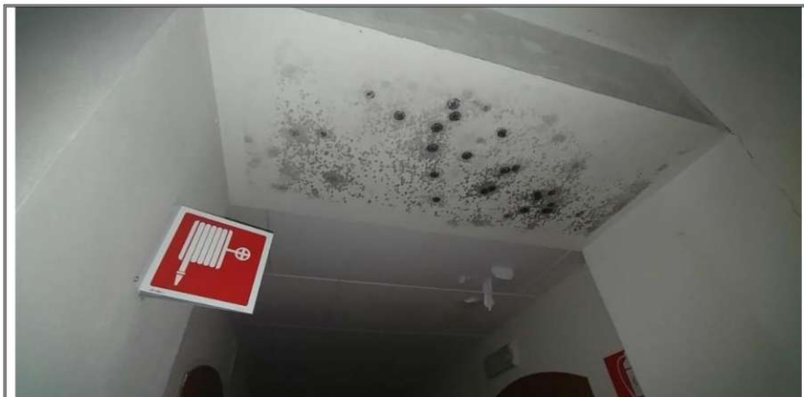
Foto n. 40 – Piano Secondo – Rilievo infiltrazioni sul soffitto del corridoio