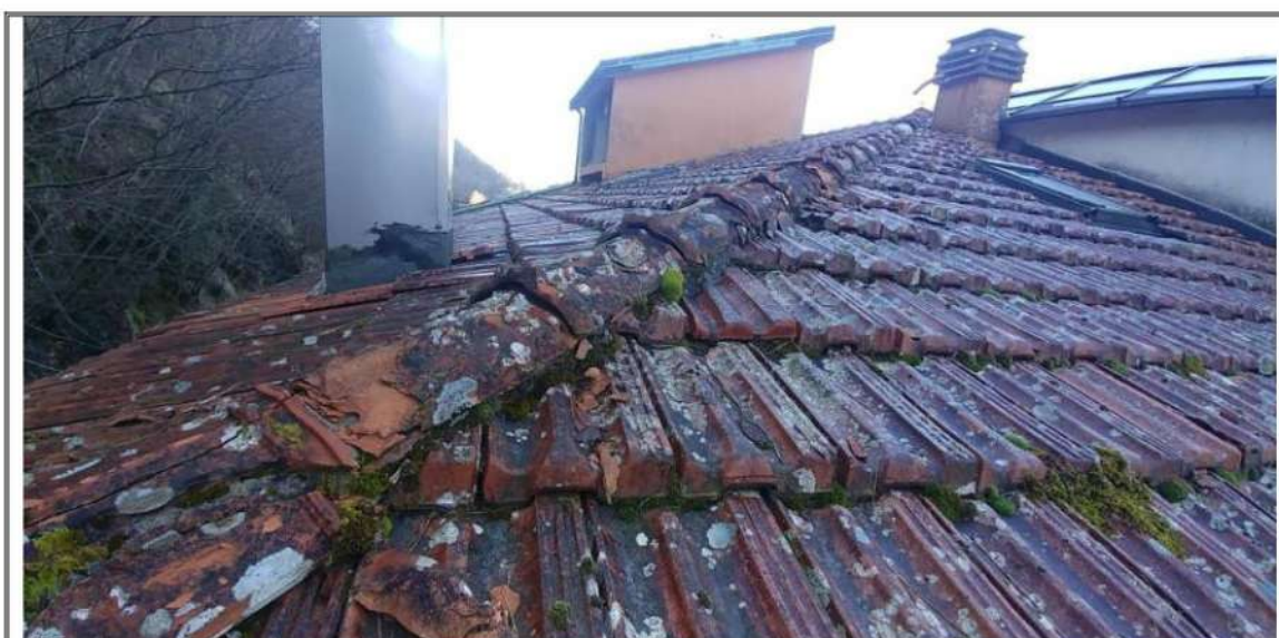
Foto n. 45 – Piano Copertura – Particolare del manto di copertura