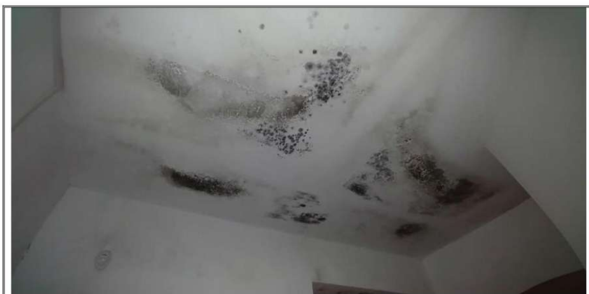
Foto n. 39 – Piano Secondo – Piano Secondo – Rilievo infiltrazioni sul soffitto del corridoio