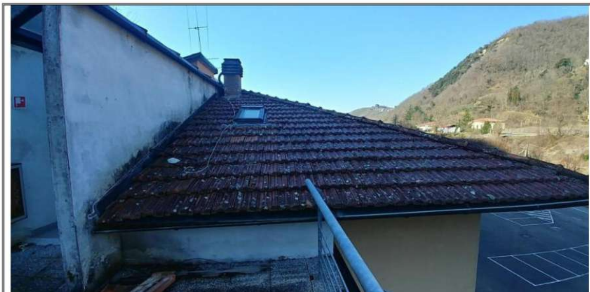
Foto n. 43 – Piano Copertura – Manto copertura del blocco preesistente