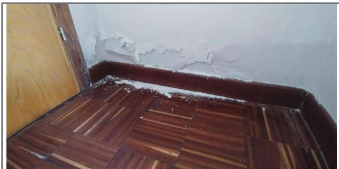
Foto n. 36 – Piano Secondo – Rilievo sfogliature alla base dei muri