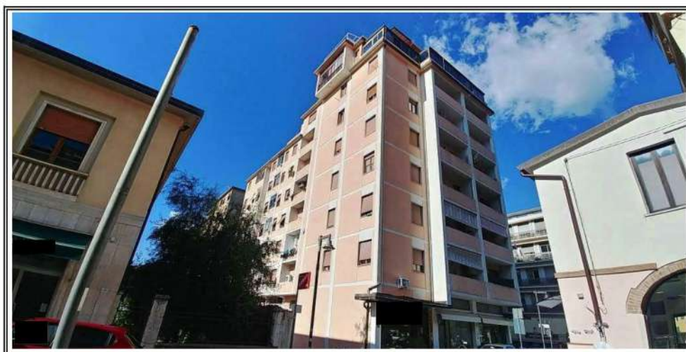
Foto n. 3 – Vista del fabbricato di cui fa parte il bene – Angolo EST