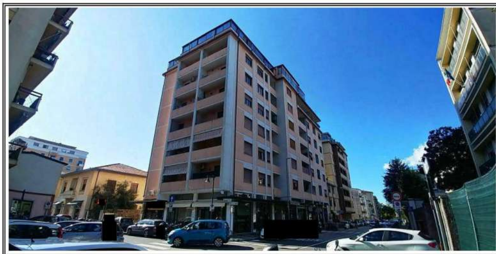
Foto n. 1 – Vista del fabbricato di cui fa parte il bene – Angolo NORD