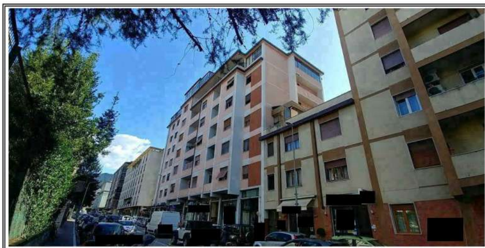
Foto n. 2 – Vista del fabbricato di cui fa parte il bene – Angolo OVEST