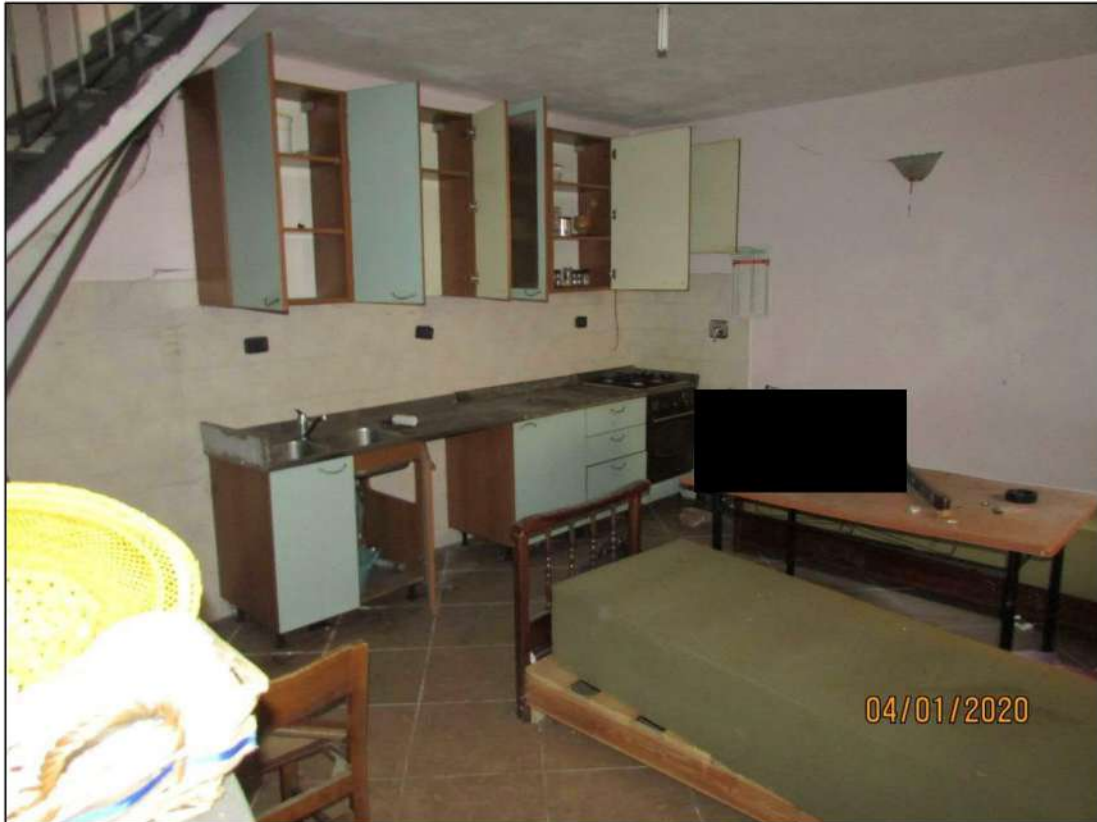
VISTA INTERNA LOCALI PIANO SEMINTERRATO