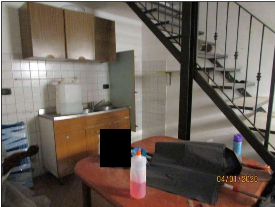
VISTA INTERNA LOCALI PIANO SEMINTERRATO