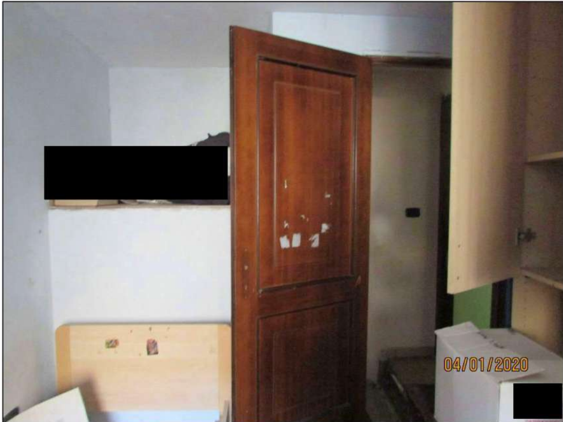
VISTA INTERNA LOCALI PIANO RIALZATO