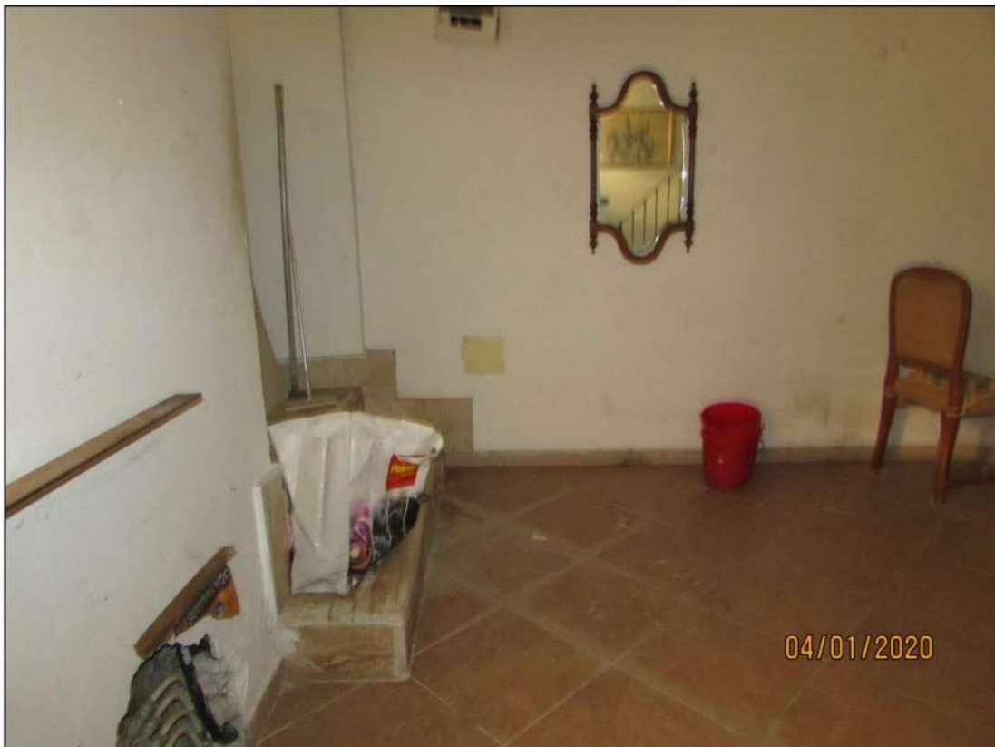
VISTA INTERNA LOCALI PIANO SEMINTERRATO