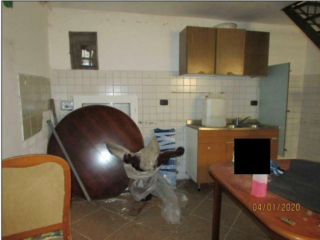
VISTA INTERNA LOCALI PIANO SEMINTERRATO