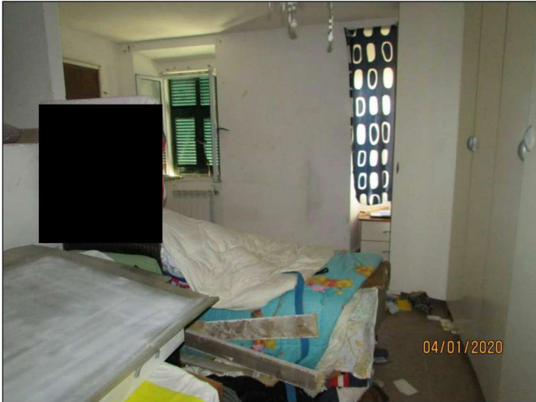
VISTA INTERNA LOCALI PIANO RIALZATO