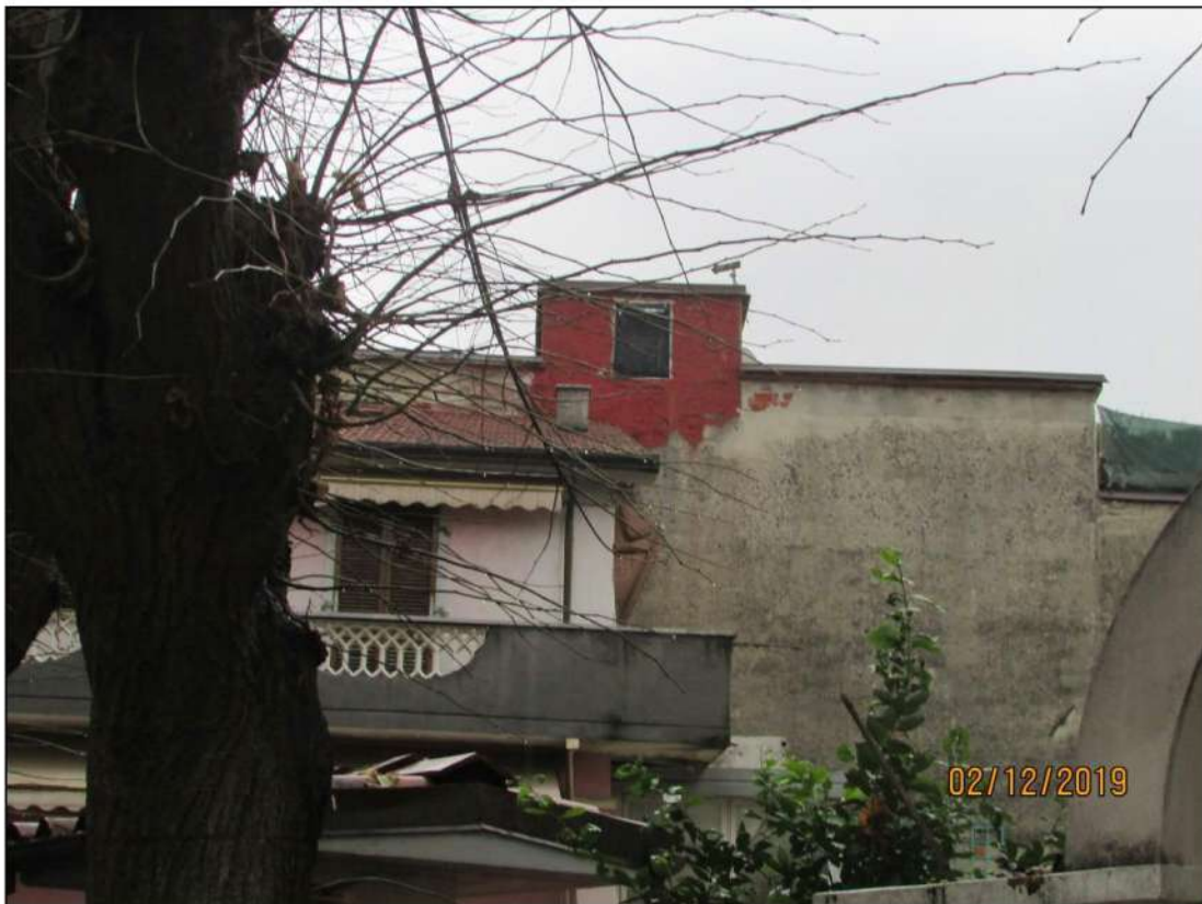
VISTA ESTERNA RETRO FABBRICATO SITO IN CARRARA VIA GIOVANNI DE ROSSI N. 8