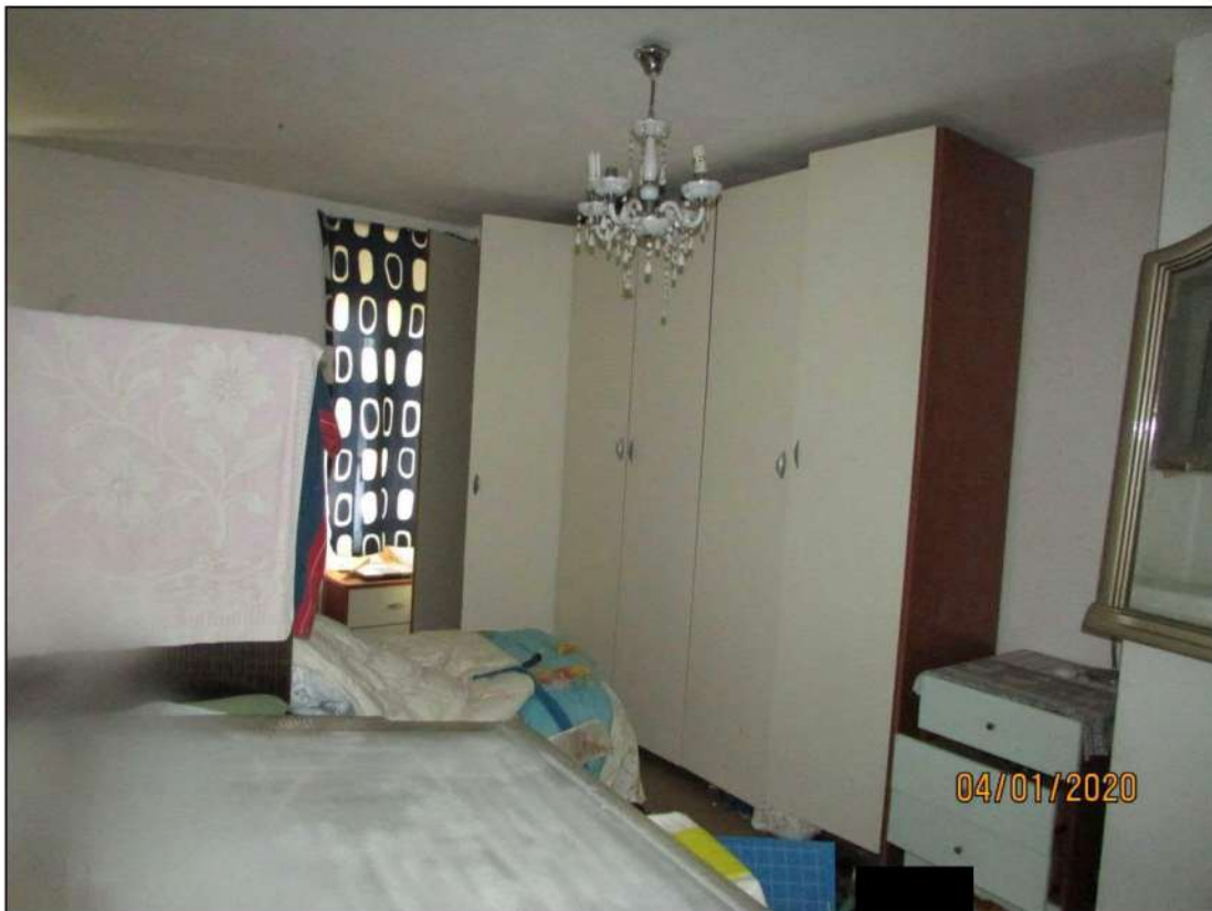
VISTA INTERNA LOCALI PIANO RIALZATO