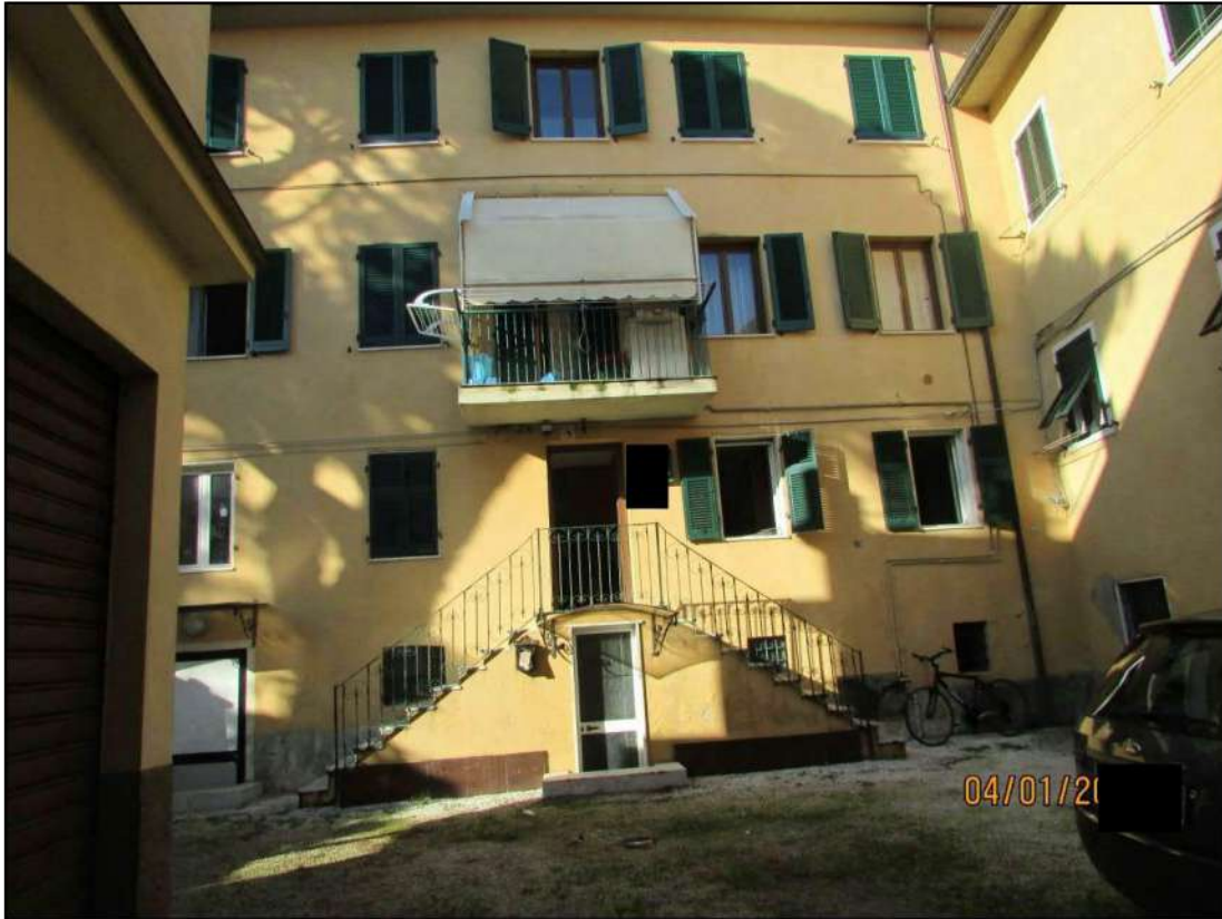
VISTA ESTERNA FABBRICATO SITO IN CARRARA VIA GIOVANNI DE ROSSI N. 8