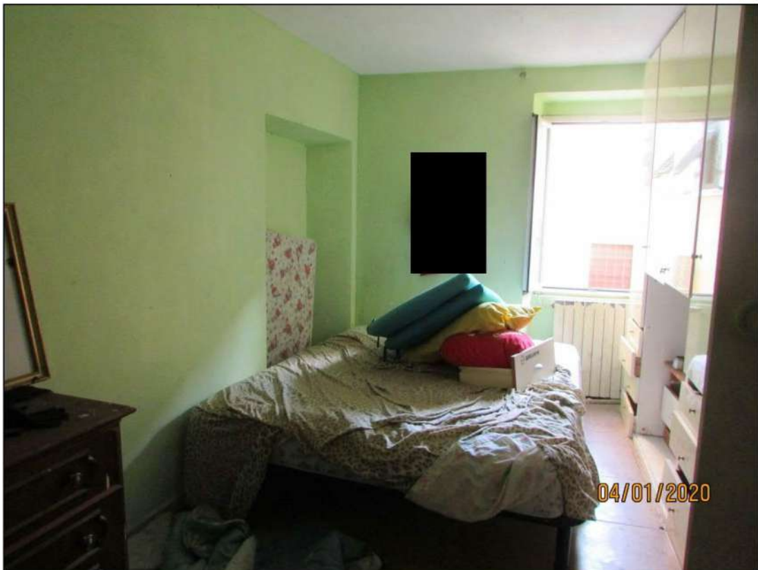
VISTA INTERNA LOCALI PIANO RIALZATO