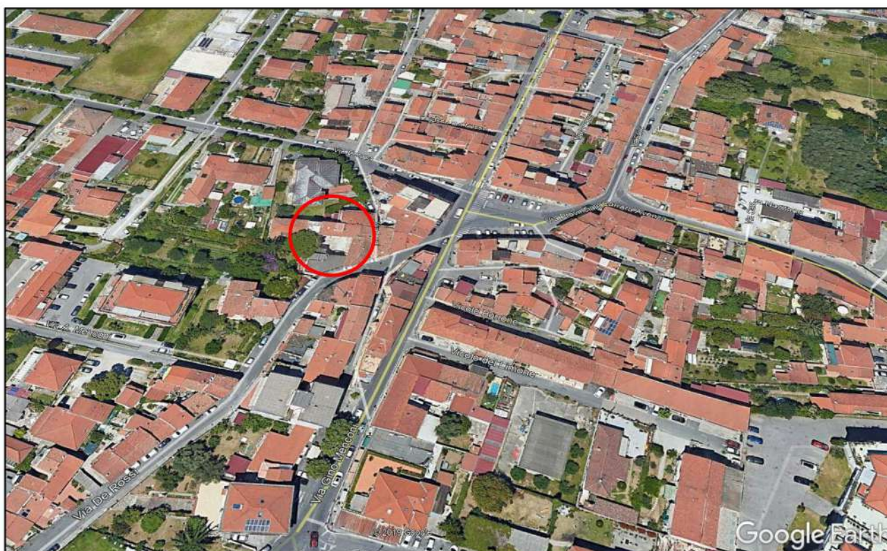
VEDUTA AEREA GOOGLE EARTH (2003)