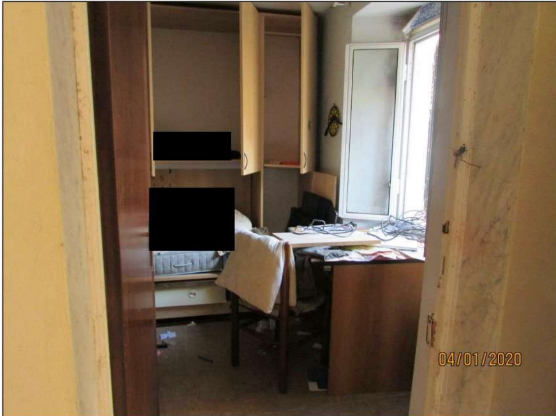
VISTA INTERNA LOCALI PIANO RIALZATO