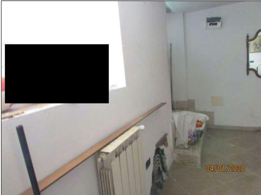
VISTA INTERNA LOCALI PIANO SEMINTERRATO