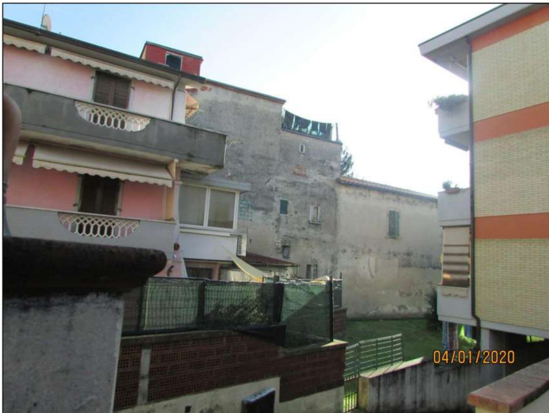
VISTA ESTERNA RETRO FABBRICATO SITO IN CARRARA VIA GIOVANNI DE ROSSI N. 8