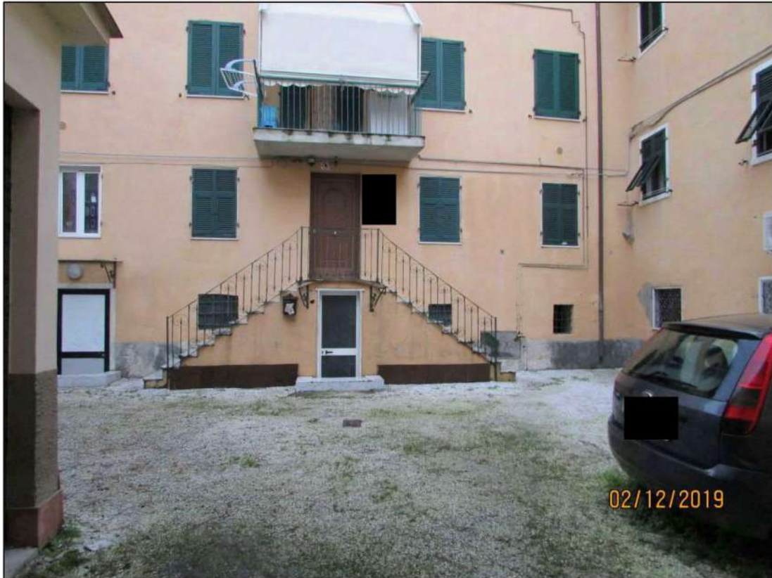
VISTA ESTERNA FABBRICATO SITO IN CARRARA VIA GIOVANNI DE ROSSI N. 8