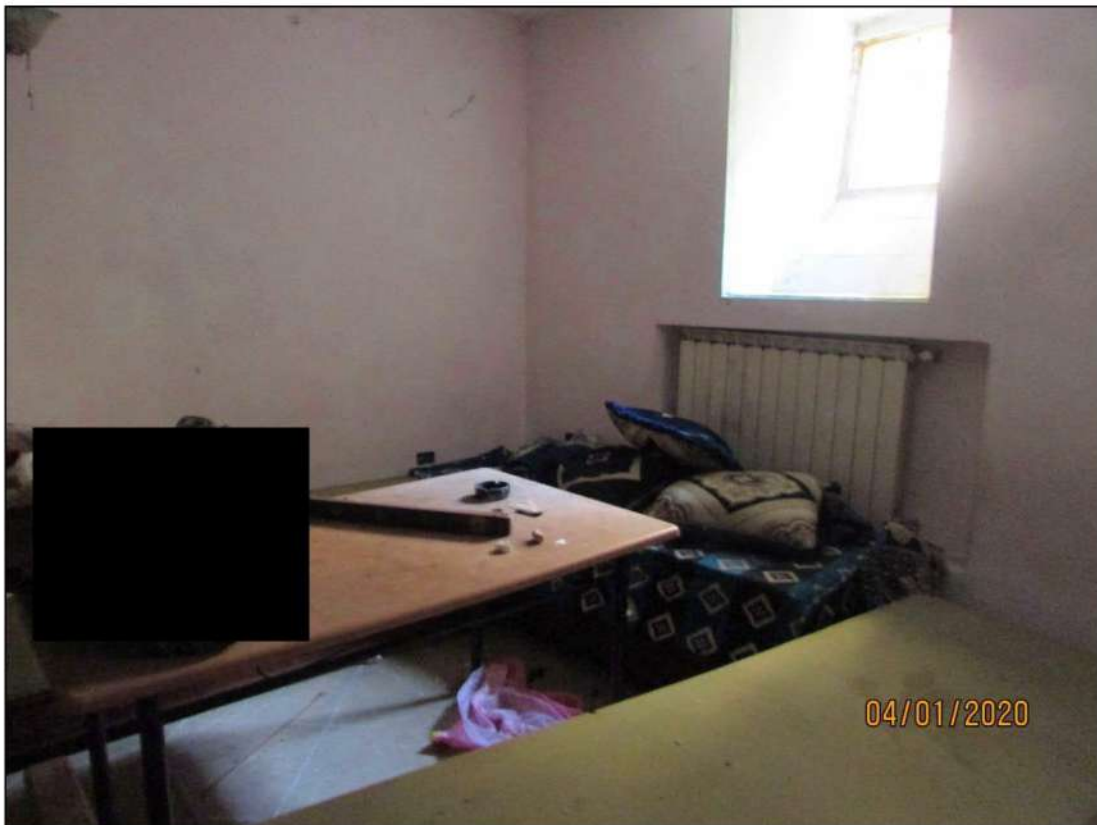
VISTA INTERNA LOCALI PIANO SEMINTERRATO