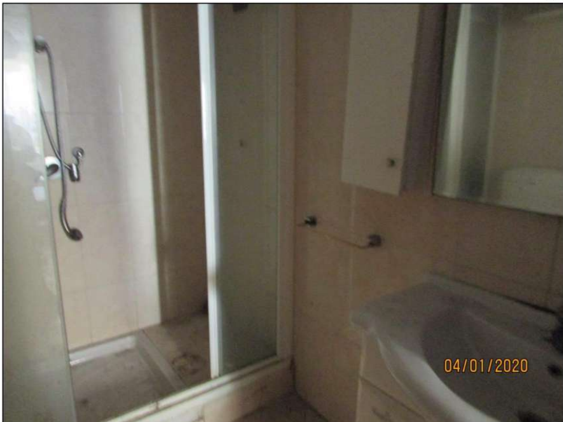
VISTA INTERNA LOCALI PIANO RIALZATO