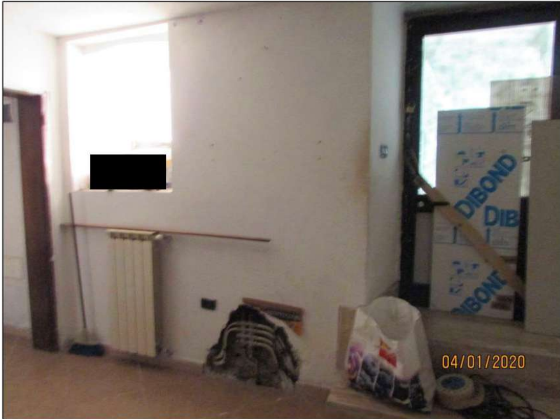
VISTA INTERNA LOCALI PIANO SEMINTERRATO