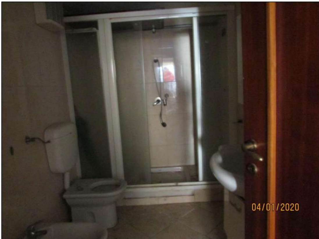
VISTA INTERNA LOCALI PIANO SEMINTERRATO