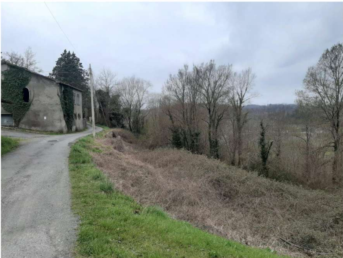
Foto 6. Lotto 3 dalla strada principale