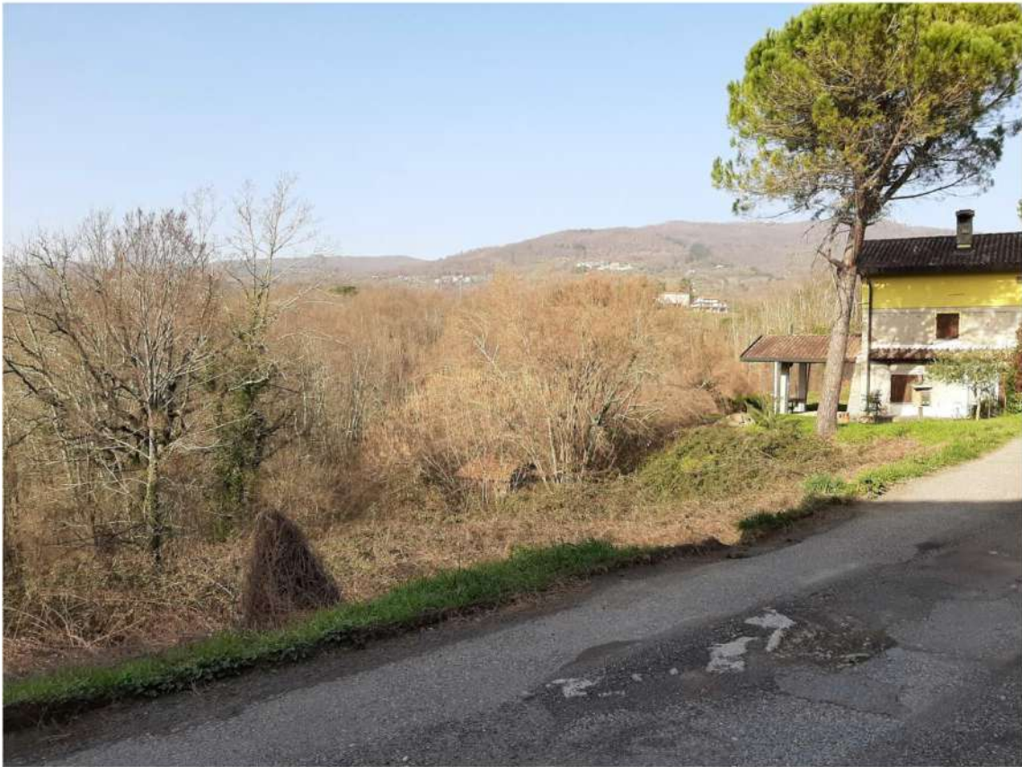
Foto 5. Lotto 3 dalla strada principale