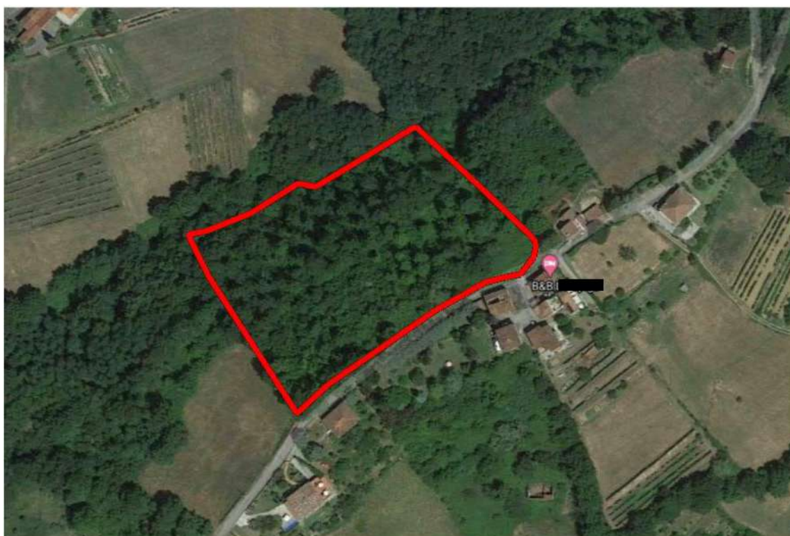
Foto 2. Vista aerea Lotto 3. In rosso sono rappresentati i contorni del lotto.