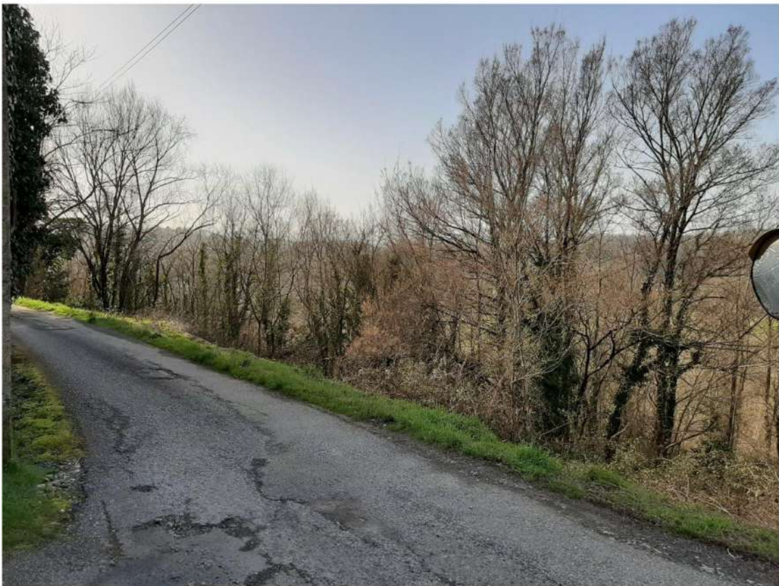
Foto 4. Lotto 3 dalla strada principale