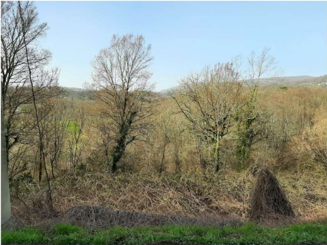
Foto 3. Lotto 3 dalla strada principale