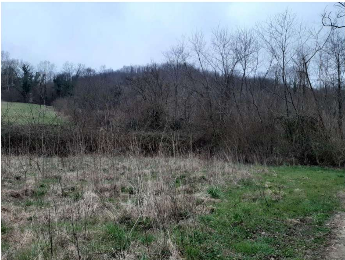
Foto 6. Lotto 5 dalla strada sterrata