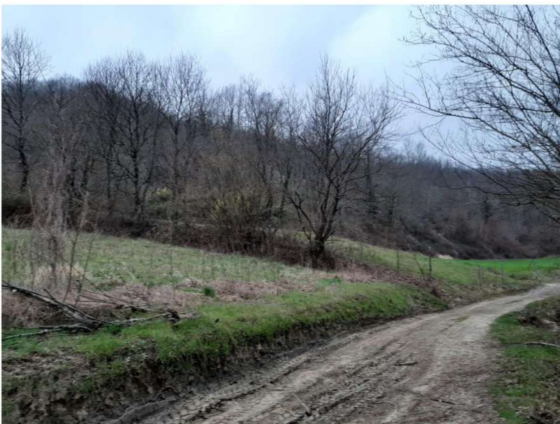
Foto 4. Lotto 5 dalla strada sterrata