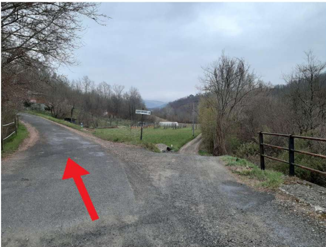
Foto 3. Lotto 5 indicazione della strada da percorrere da Piano di Collecchia