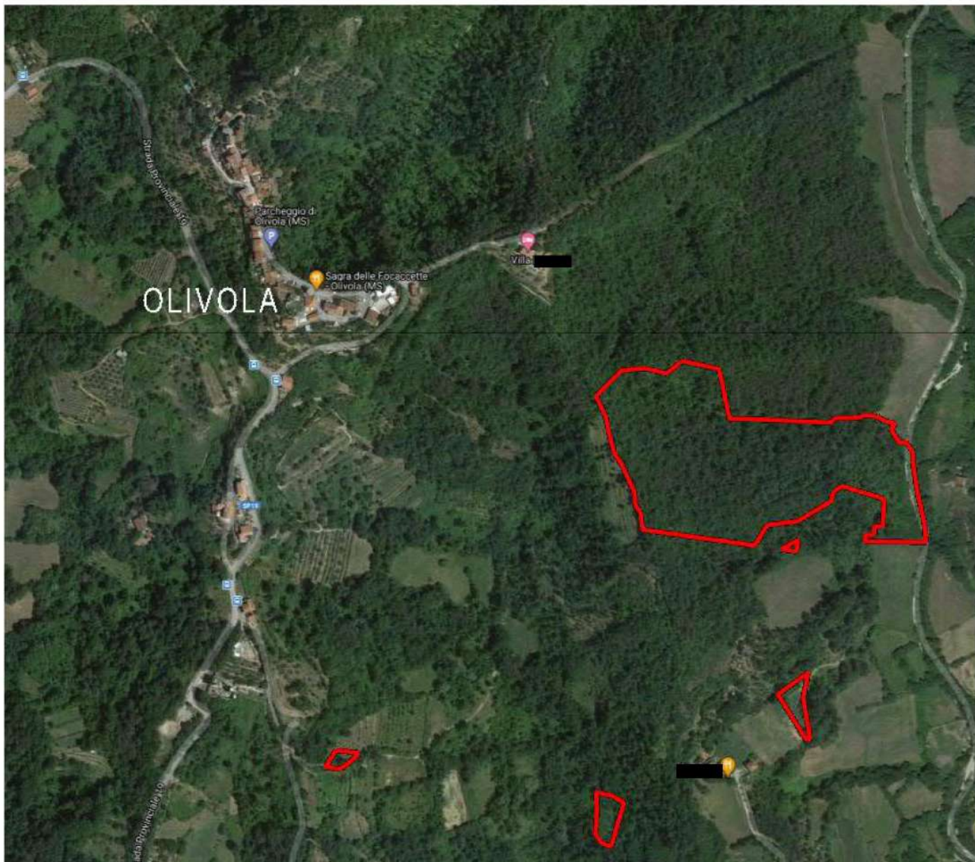
Foto 2. Vista aerea Lotto 5. In rosso sono rappresentati i contorni del lotto.