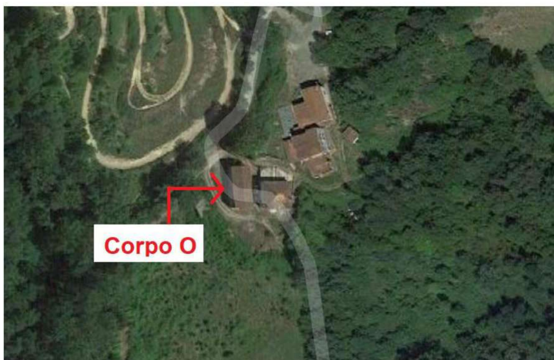
Foto 2. Vista aerea fabbricato rurale appartenente al lotto 9 (Corpo O mapp.405)