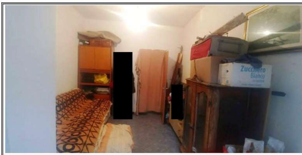
Foto n. 1 – Porzione A - Zona giorno prima della esecuzione dei lavori edili