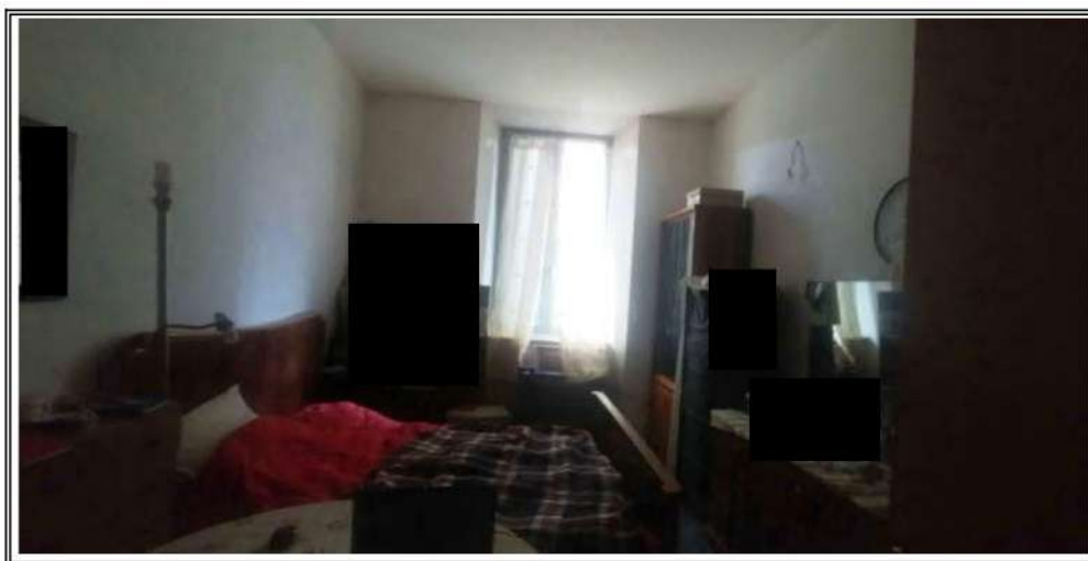
Foto n. 4 – Porzione A- Camera prima della esecuzione dei lavori edili