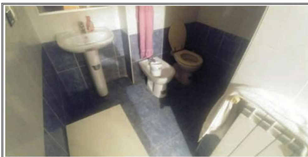
Foto n. 8 – Servizio igienico realizzato su parte comune BCNC sub 24