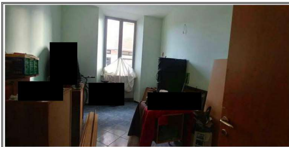
Foto n. 5 – Porzione A- Camera dopo la esecuzione dei lavori edili