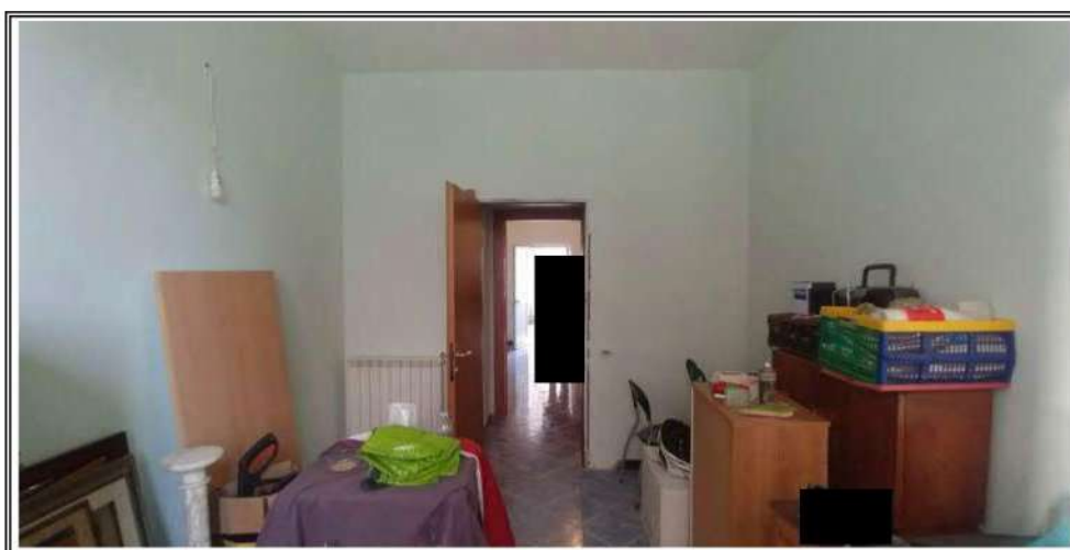
Foto n. 6 – Porzione A- Camera dopo la esecuzione dei lavori edili