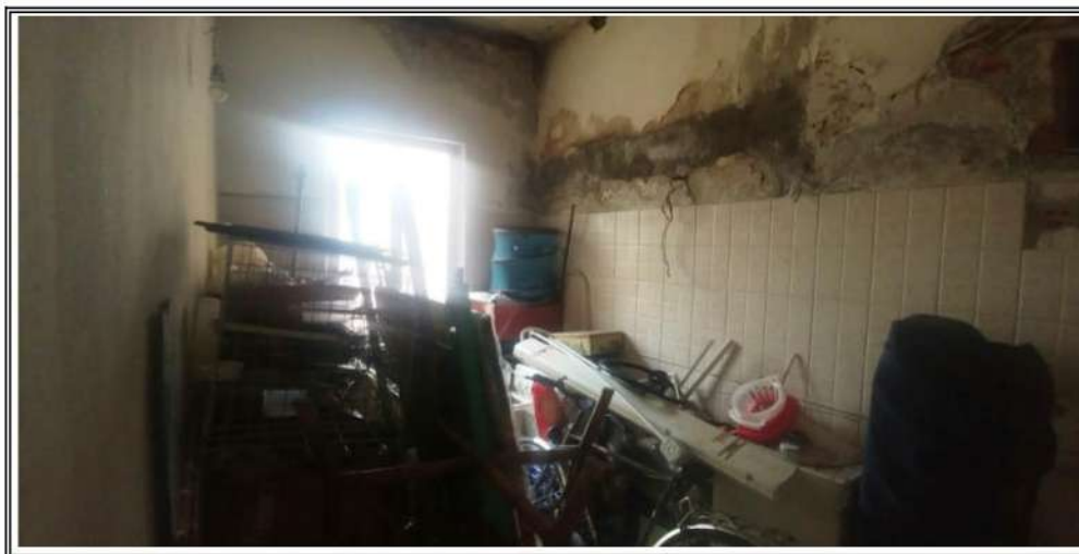
Foto n. 7 – Vano BCNC sub 24 prima della esecuzione dei lavori edili