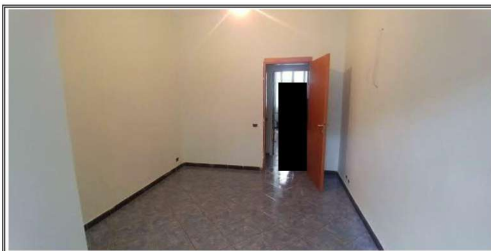
Foto n. 2 – Porzione A - Zona giorno dopo la esecuzione dei lavori edili