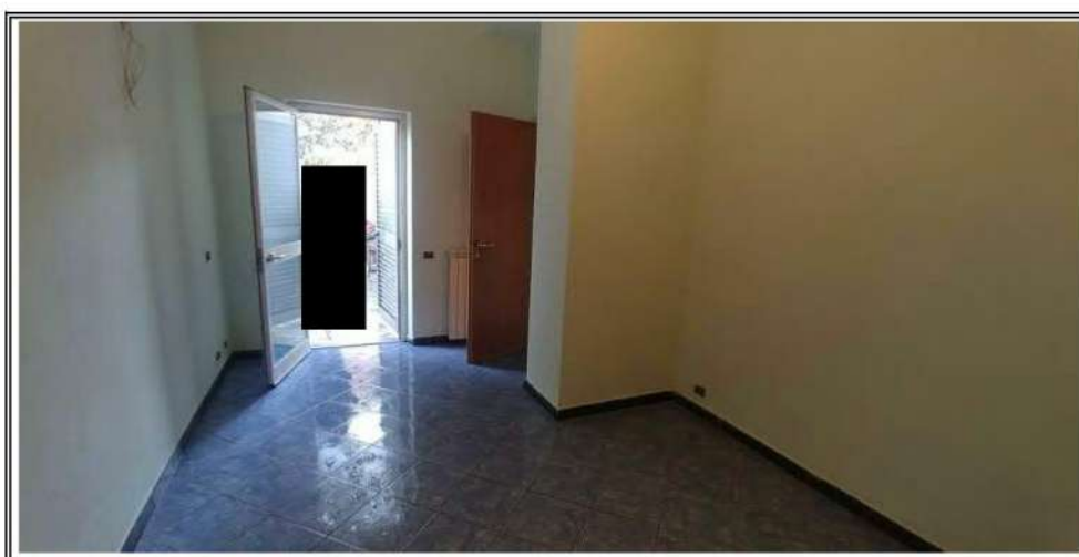
Foto n. 3 – Porzione A - Zona giorno dopo la esecuzione dei lavori edili