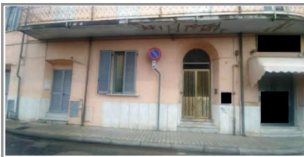
Foto n. 3 – Vista del fabbricato Via A. Maggiani – Facciata appartamento