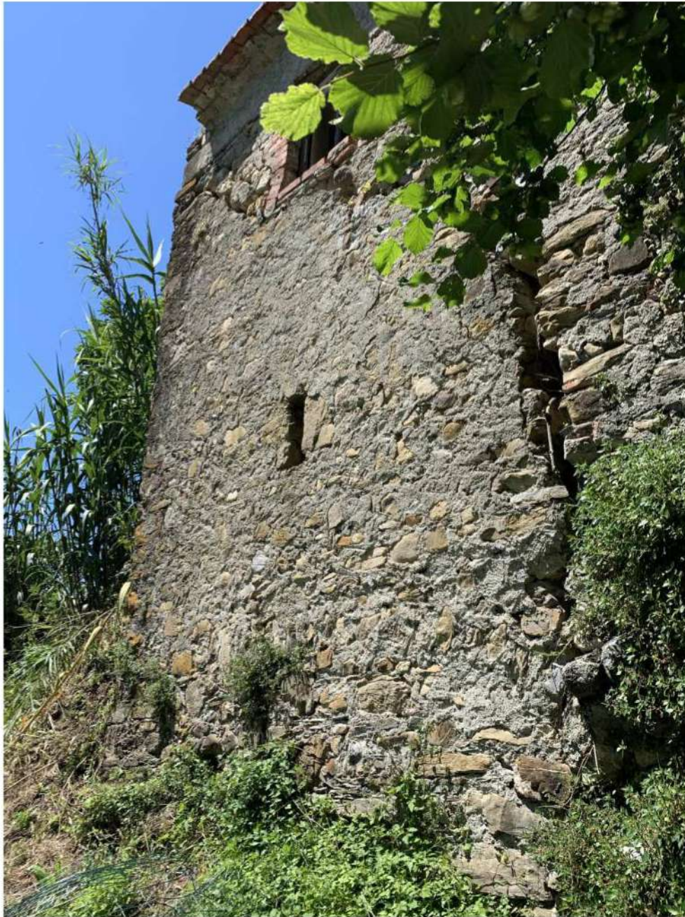
FOTO 8 RUDERE DISTINTO AL FG 8 MAPPALE 168 SUB 2 DEL CATASTO TERRENI DEL COMUNE DI AULLA – LOTTO 4