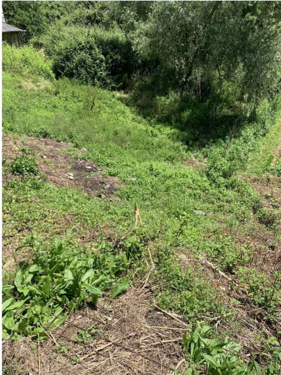
FOTO 9 TERRENO DISTINTO AL FG 8 MAPPALE 170 DEL CATASTO DEL COMUNE DI AULLA – LOTTO 4