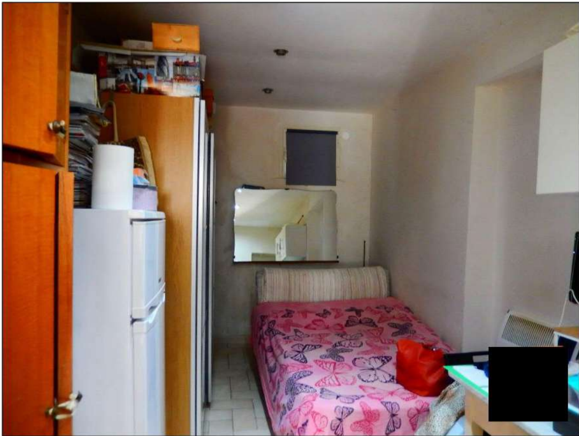
LOCALE PIANO TERRA