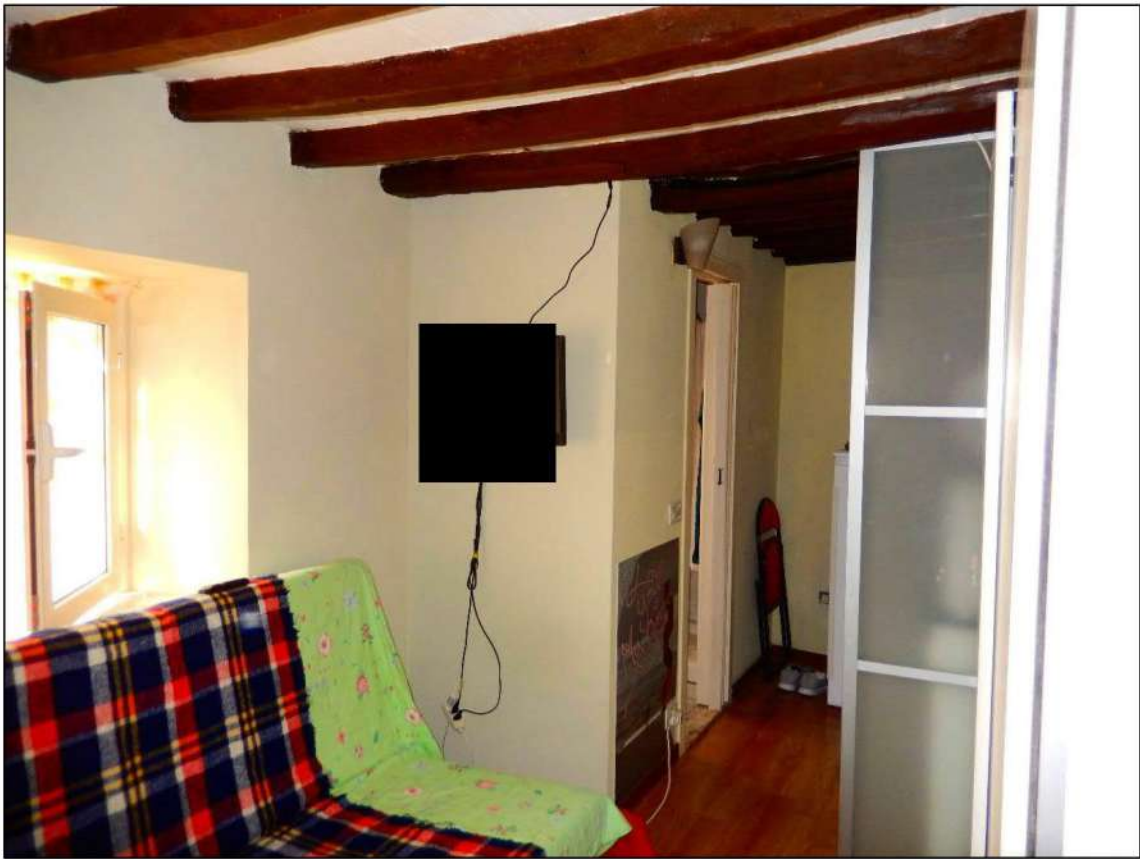
LOCALE PIANO PRIMO