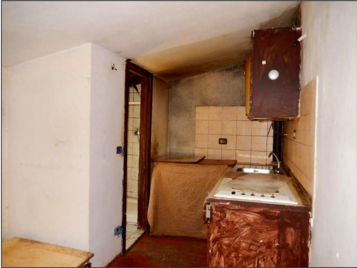
LOCALE PIANO SECONDO LATO CARRARA