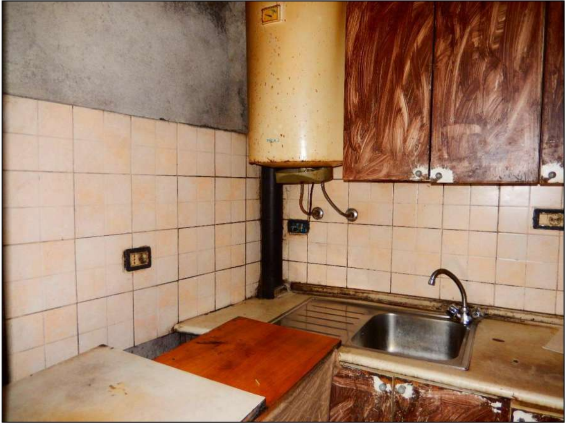
LOCALE PIANO SECONDO LATO CARRARA