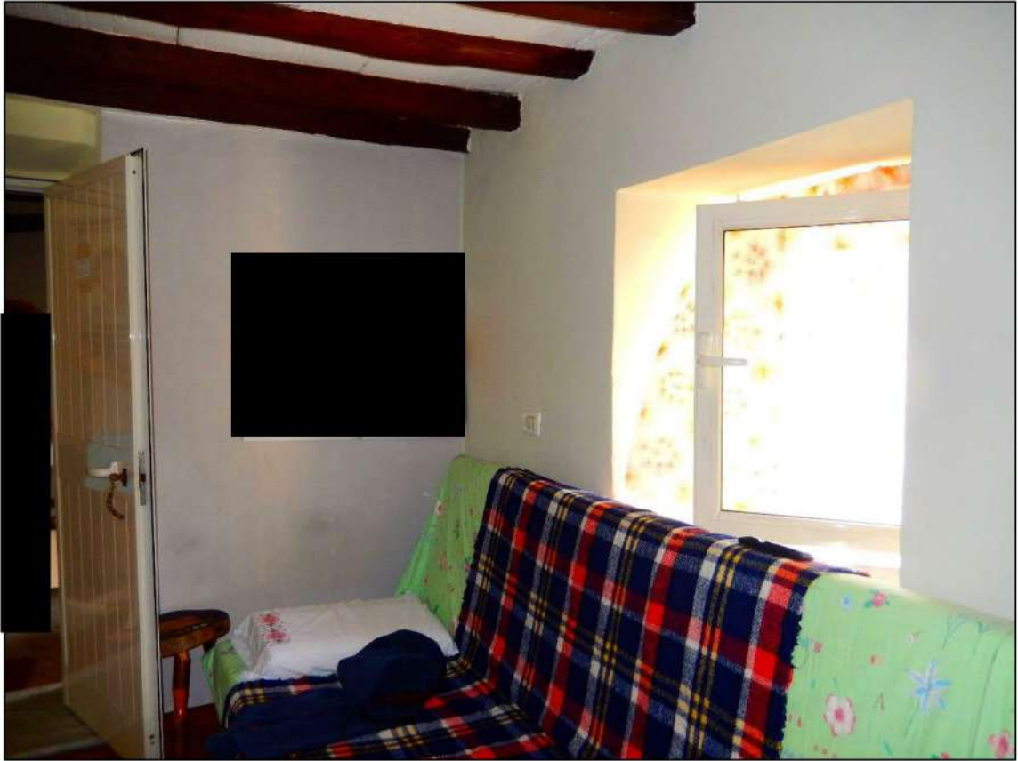
LOCALE PIANO PRIMO