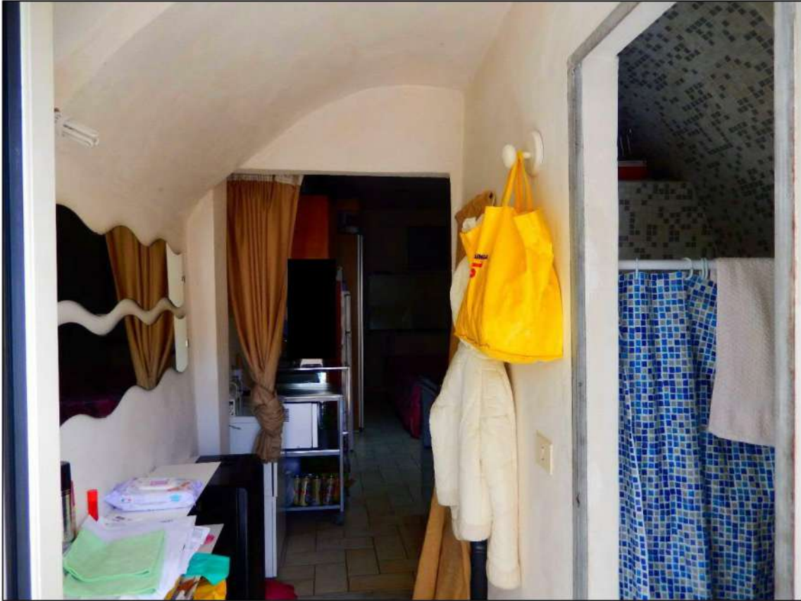
LOCALE PIANO TERRA