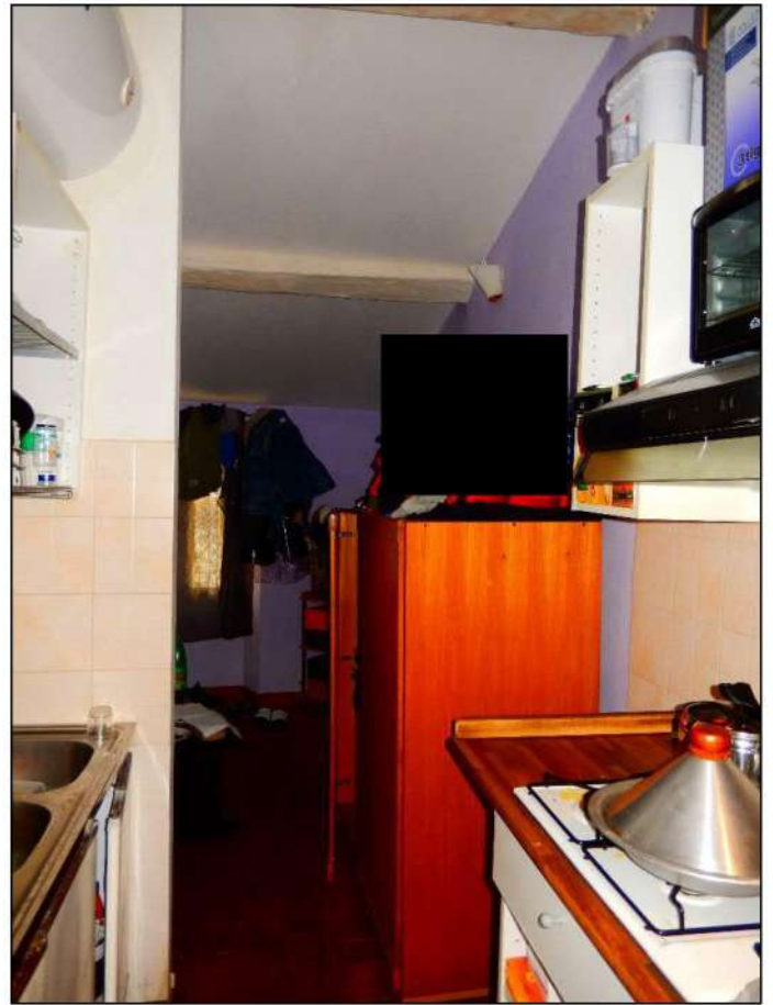
LOCALE PIANO SECONDO LATO MASSA