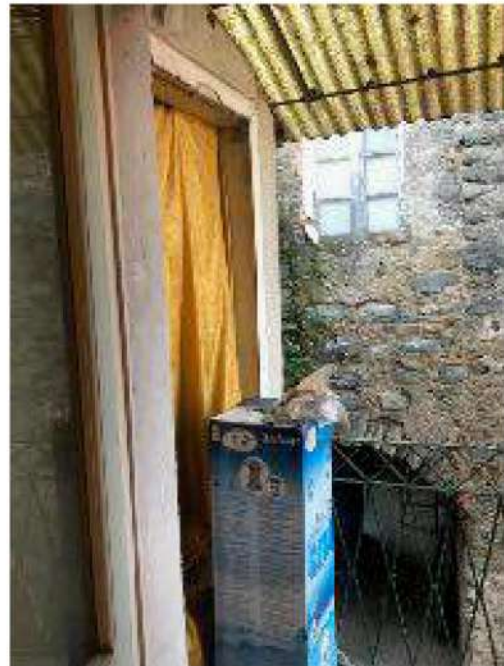
piccolo terrazzo con ripostiglio