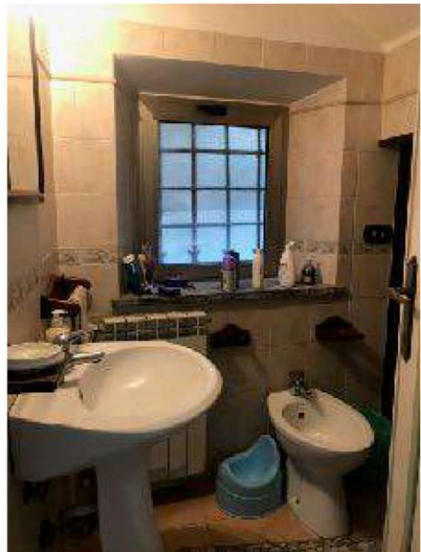
bagno piano terra