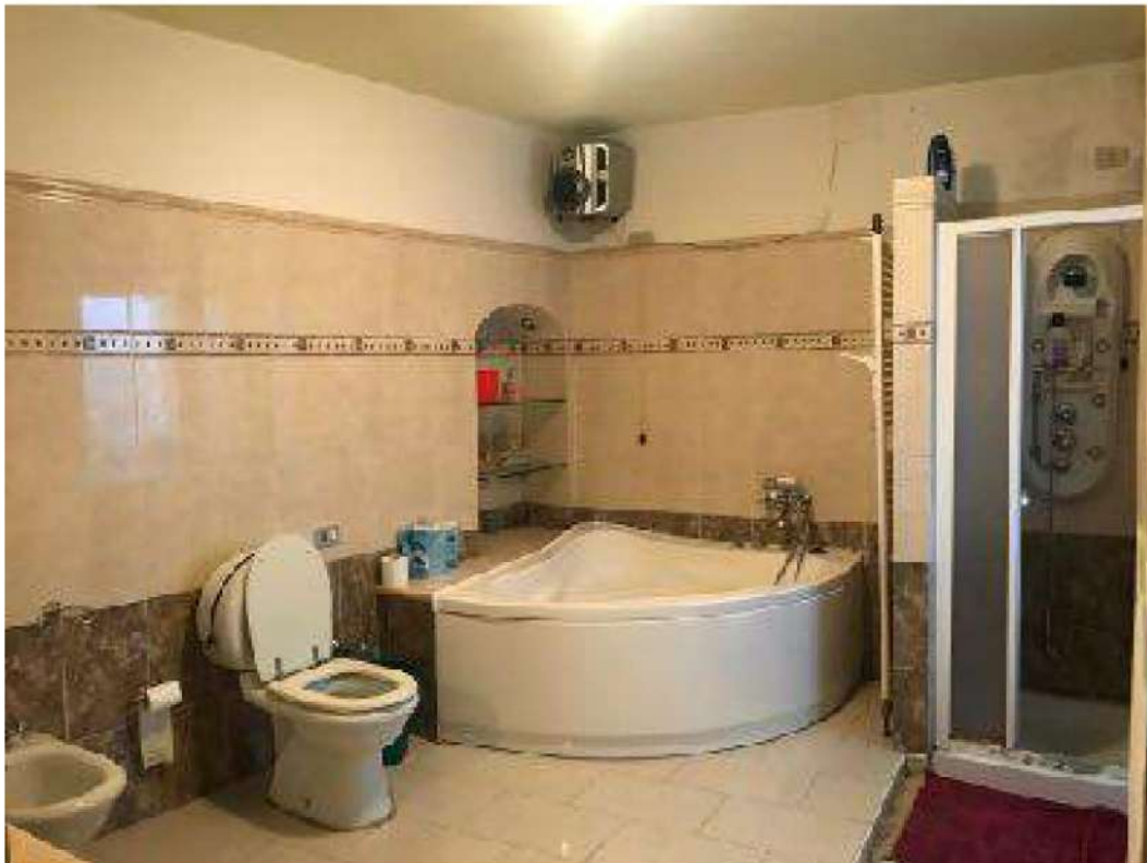
Bagno piano primo