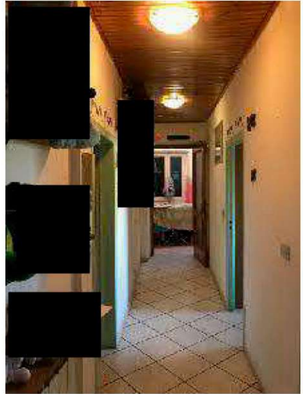
Corridoio primo piano