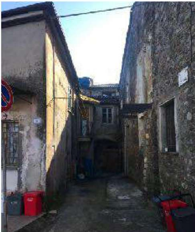
Vicolo laterale metà di proprietà dell'immobile