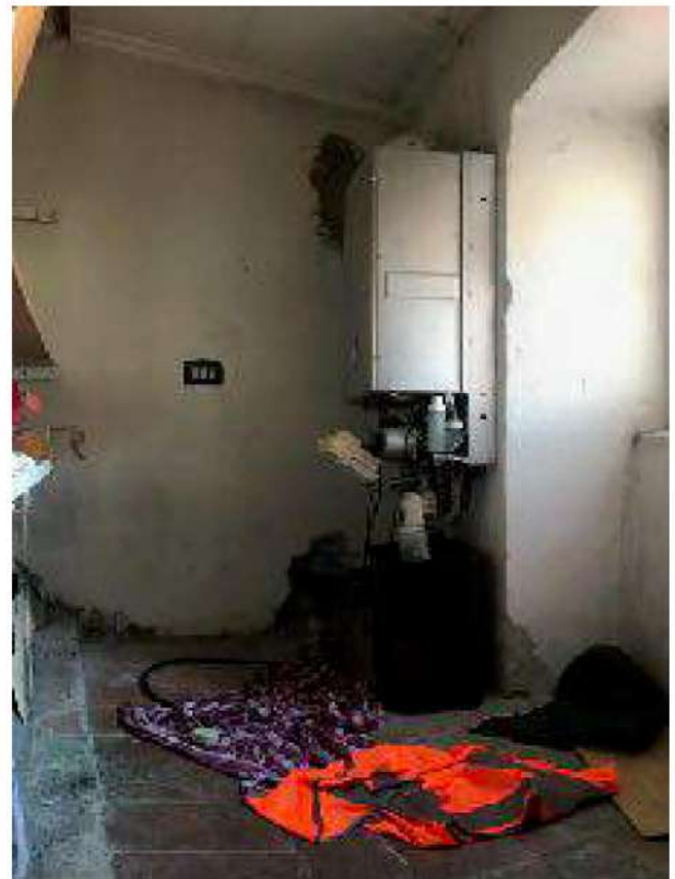
3° camera con accesso al ripostiglio sopra il vano scala dove è collocata la caldaia