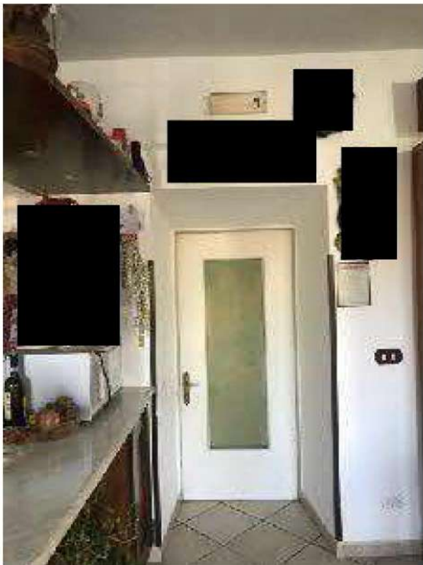
Porta di accesso al ripostiglio/cantina