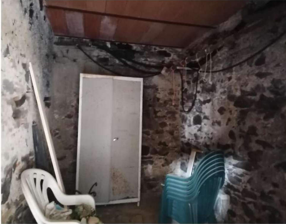
N° 10 –Vista esterna P.INT.: Cantina 2