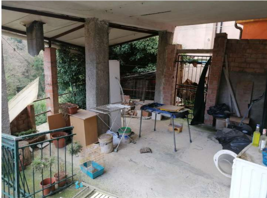
N° 8 –Vista esterna P.INT.: Ingresso cantine