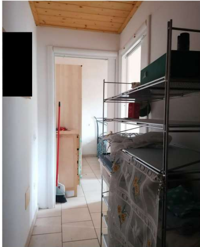
N° 7 –Vista interna P.T.: Camera 1