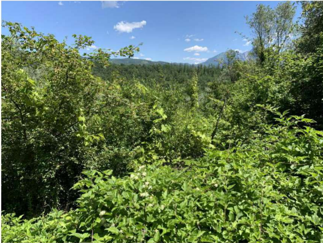
FOTO 13 TERRENO DISTINTO AL FG 9 MAPPALE 315 DEL CATASTO DEL COMUNE DI AULLA – LOTTO 7