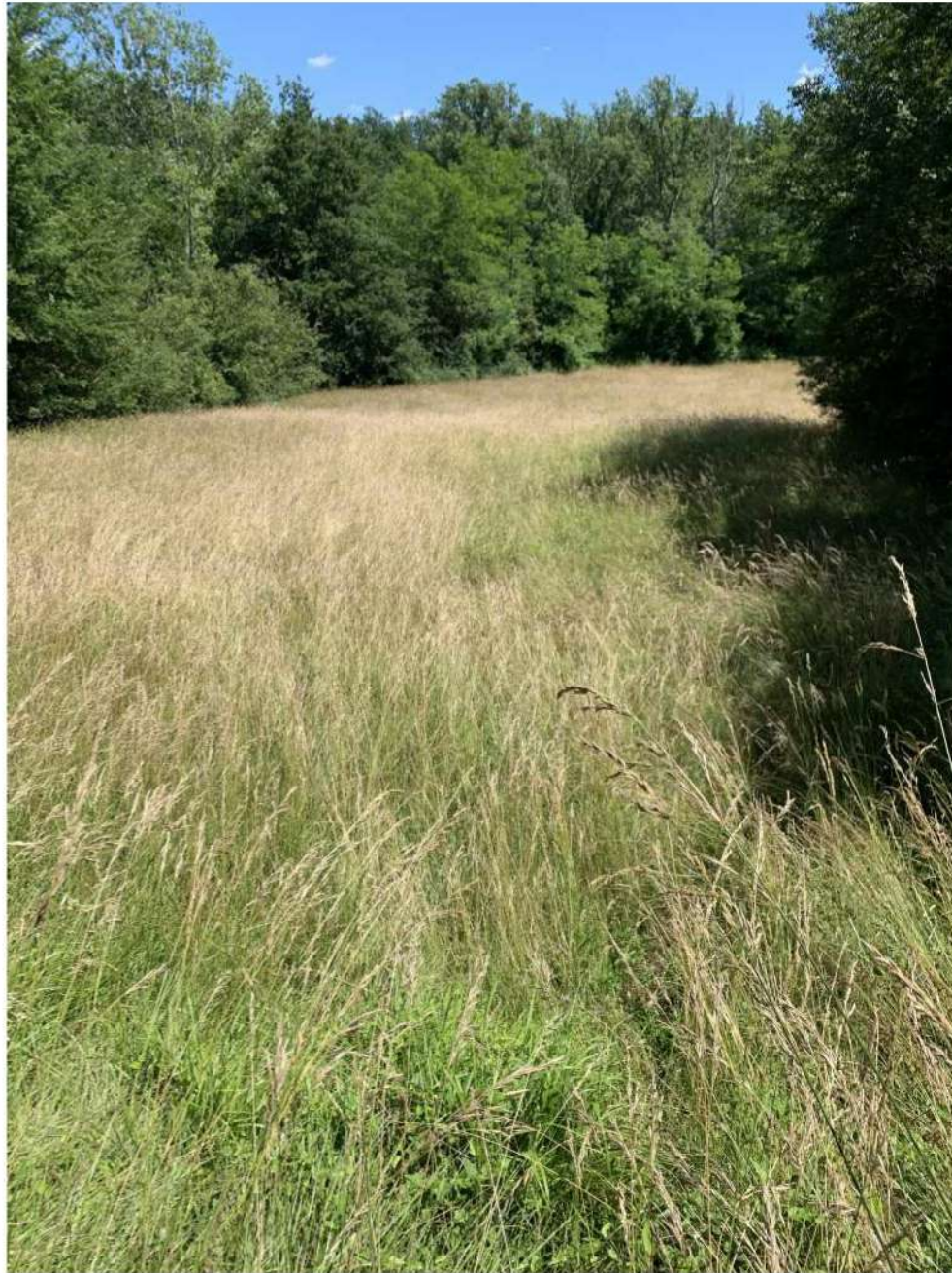
FOTO 15 TERRENO DISTINTO AL FG 9 MAPPALE 323 DEL CATASTO DEL COMUNE DI AULLA – LOTTO 7