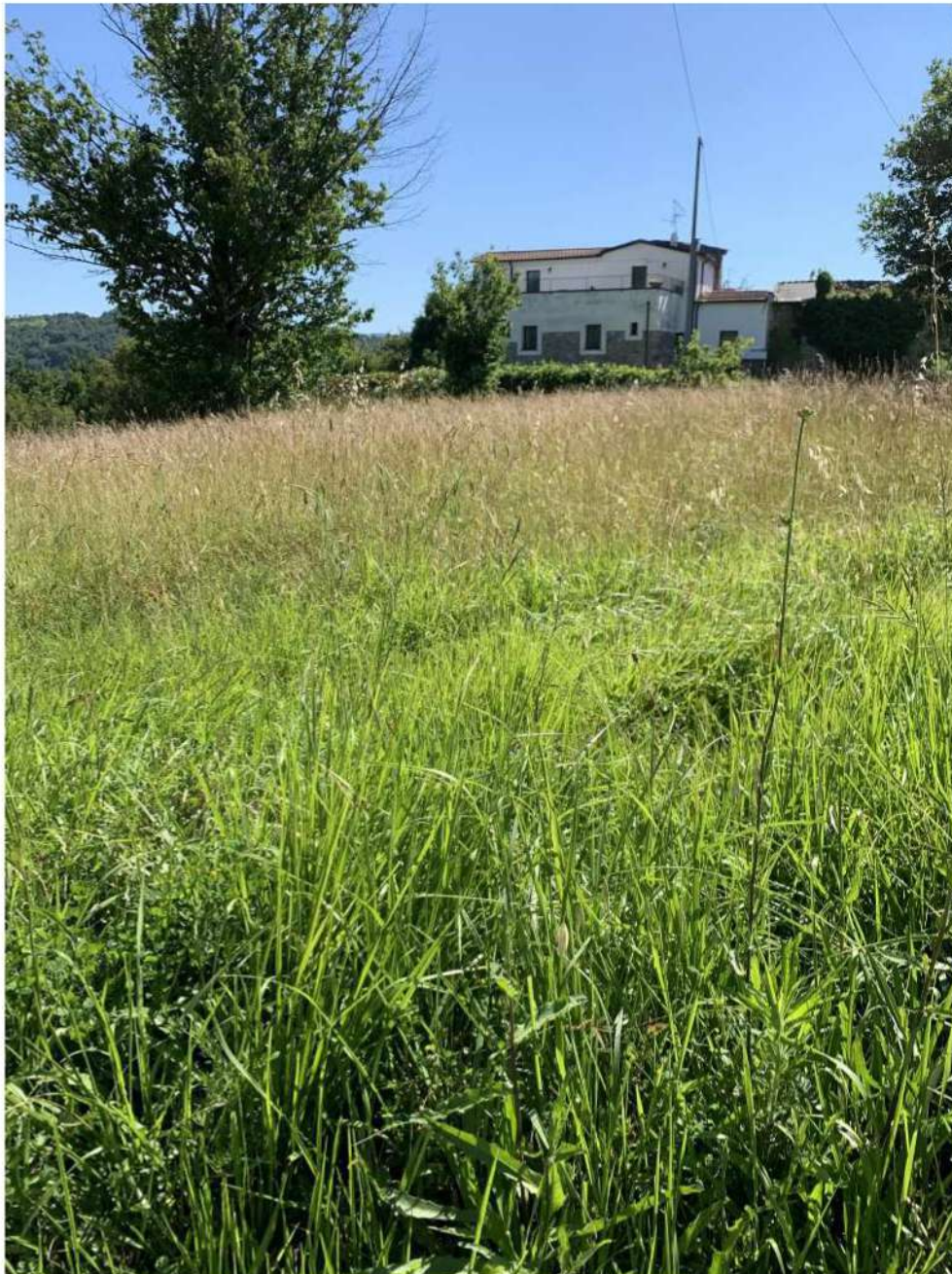
FOTO 20 TERRENO DISTINTO AL FG 9 MAPPALE 452 DEL CATASTO DEL COMUNE DI AULLA – LOTTO 10