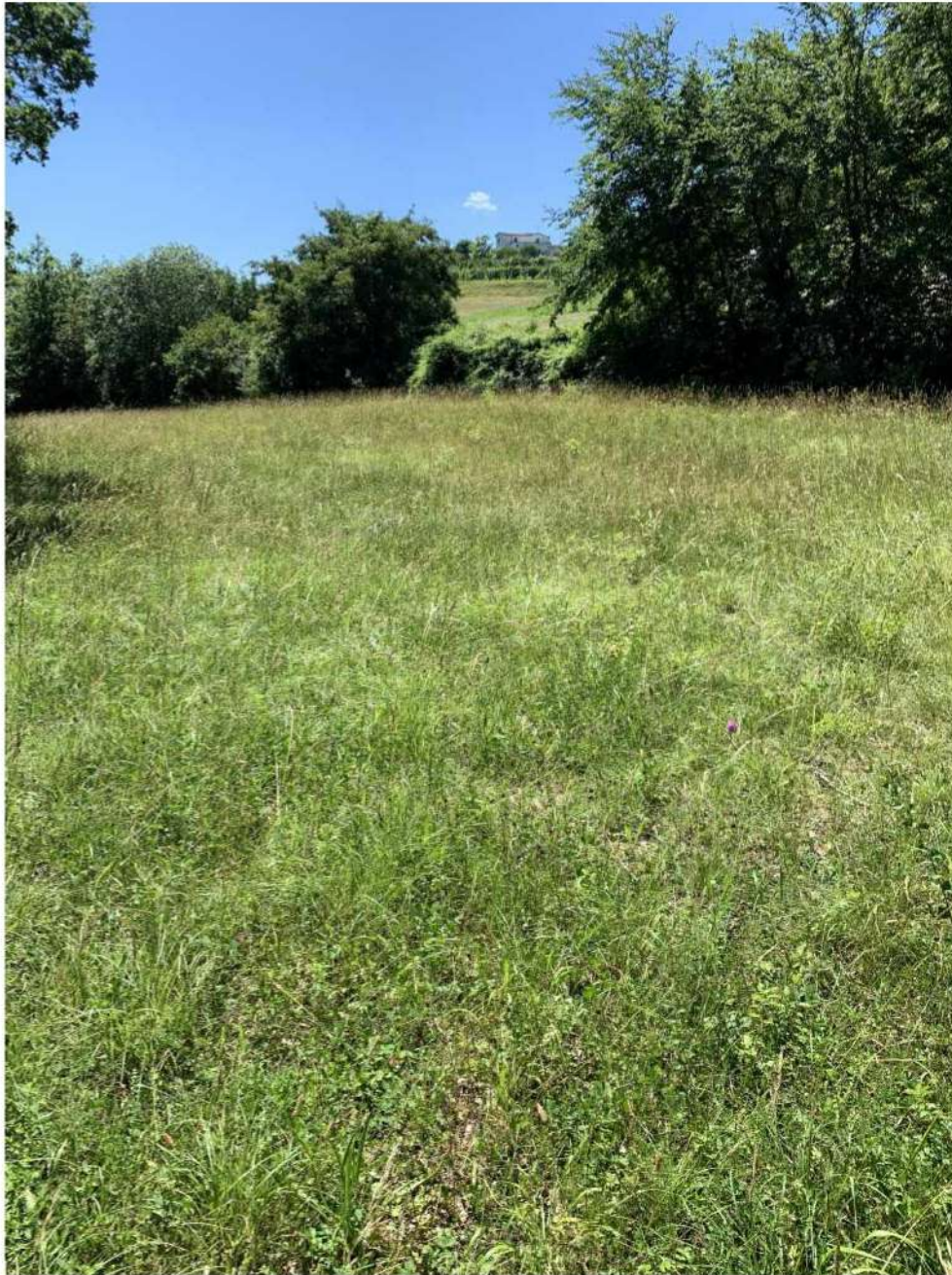
FOTO 23 TERRENO DISTINTO AL FG 9 MAPPALI 387,388 DEL CATASTO DEL COMUNE DI AULLA – LOTTO 10