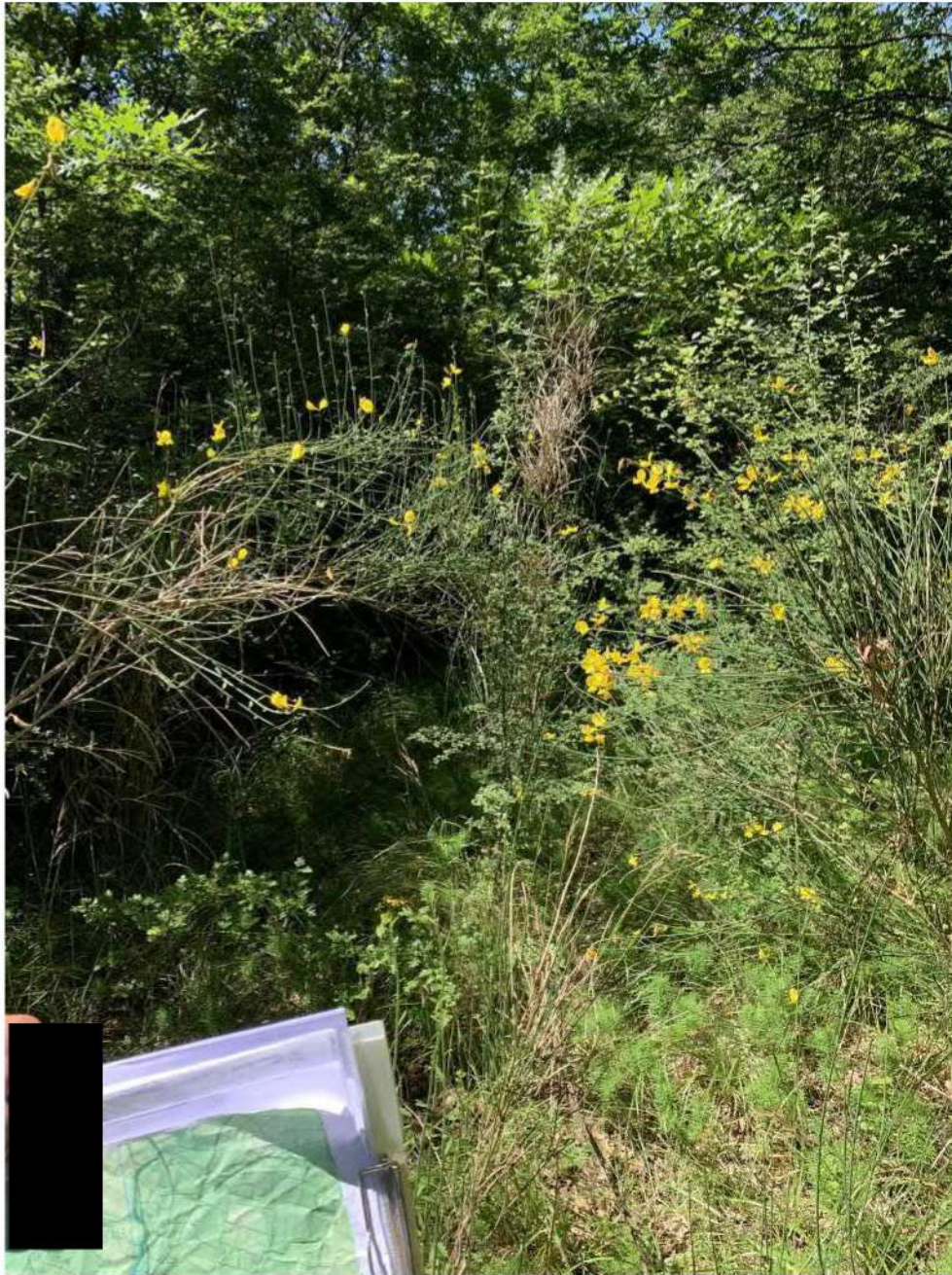
FOTO 22 TERRENO DISTINTO AL FG 9 MAPPALI 380,382 DEL CATASTO DEL COMUNE DI AULLA AL FOGLIO 74 MAPPALE 50 DEL COMUNE DI FIVIZZANO – LOTTO 10