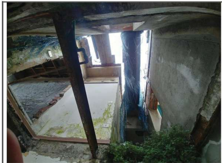
Foto n. 11– Porzione mappale 128 subalterno 9 – Vista verso l'alto