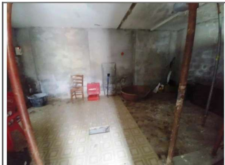
Foto n. 9 – Porzione mappale 128 subalterno 9 – vano al piano terra