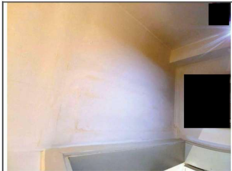
Foto n. 14– Fabbricato contiguo mapp 128 sub2 - Soffitto vano al P1