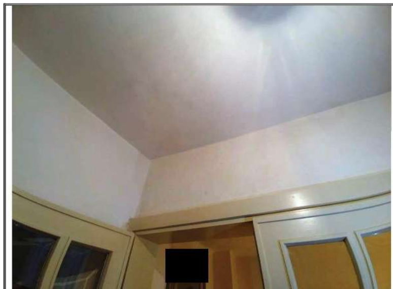
Foto n. 15 – Fabbricato contiguo mapp 128 sub2 –Angolo vano al P1