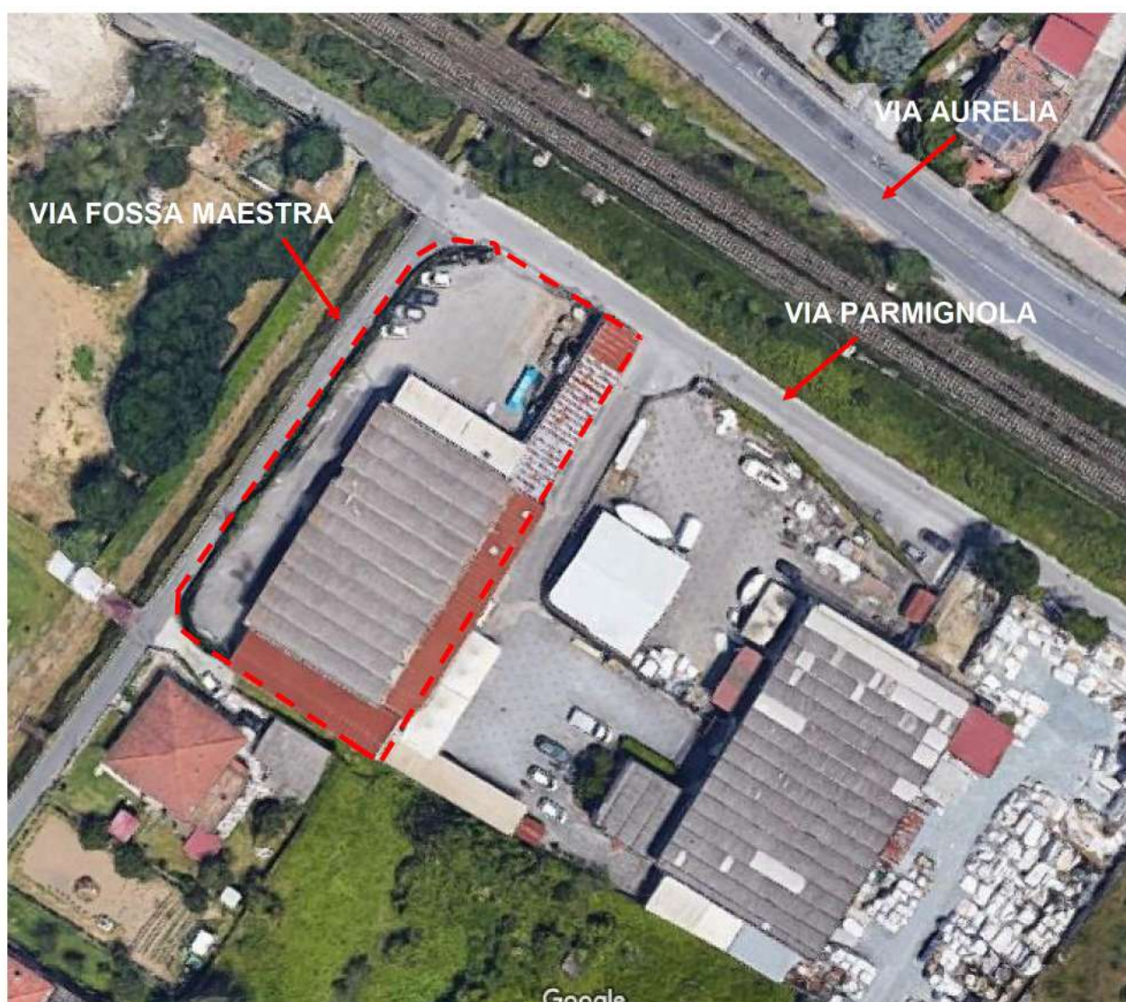
Figura 2 - Vista aerea del compendio industriale in esame

Le tettoie poste in aderenza sono state eseguite con una struttura portante in profili di scatolato di ferro, coperte con lamiera zincata grecata e tamponate sui lati con pannelli sandwich di poliuretano rivestiti in lamiera dogata (vedi doc. fotografica allegato n°1).