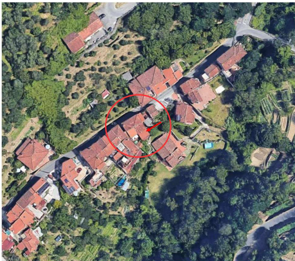
Vista aerea con l'ubicazione dell'immobile

Al piano terra dell'abitazione si sviluppa la zona giorno zona giorno composta da corridoio di ingresso, bagno, cucina e soggiorno, da quest'ultimo si estende una scala in ferro, con pedate in legno, che consente l'accesso al piano primo dove è presente la zona notte con un disimpegno e due camere. Al piano seminterrato, trovano posto due vani cantina con rispettivi ingressi da un ampio porticato.