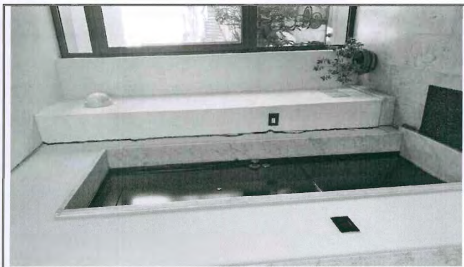
Foto n.10 - Pianerottolo d'ingresso