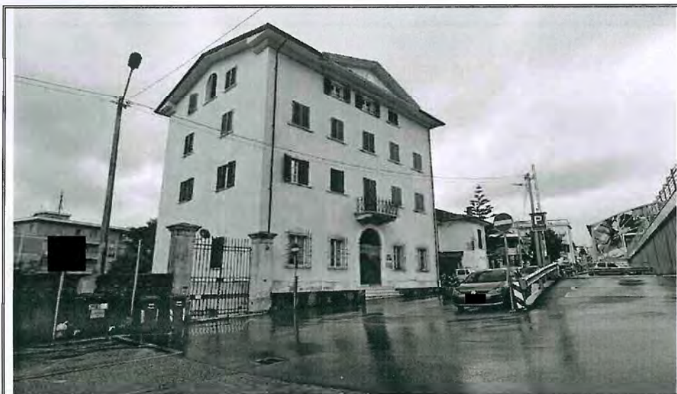
Foto n. 2– Vista del fabbricato di cui fa parte il bene immobile– Angolo EST