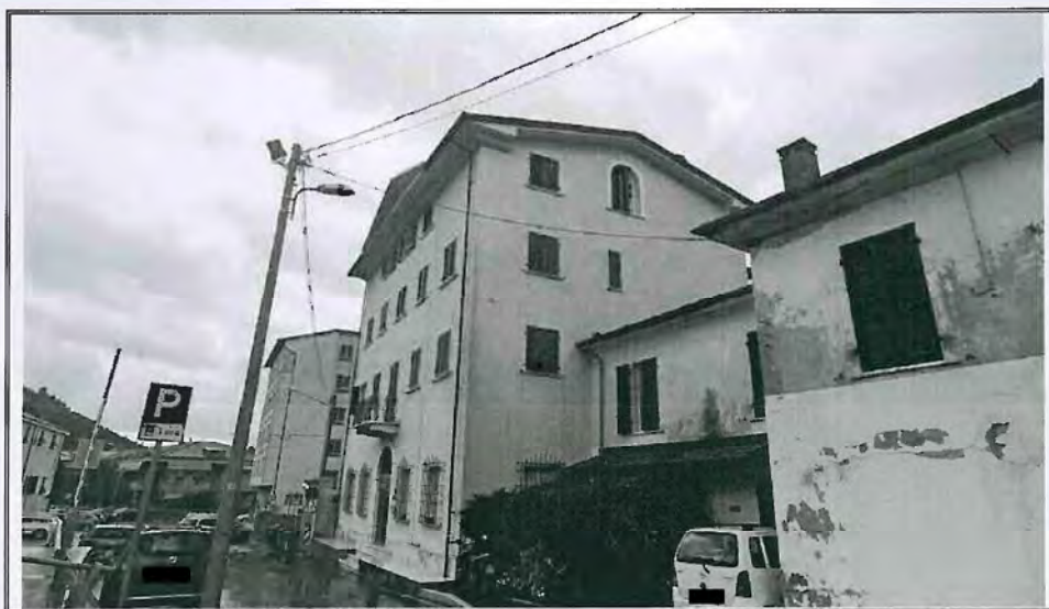
Foto n. 1 – Vista del fabbricato di cui fa parte il bene immobile– Angolo NORD