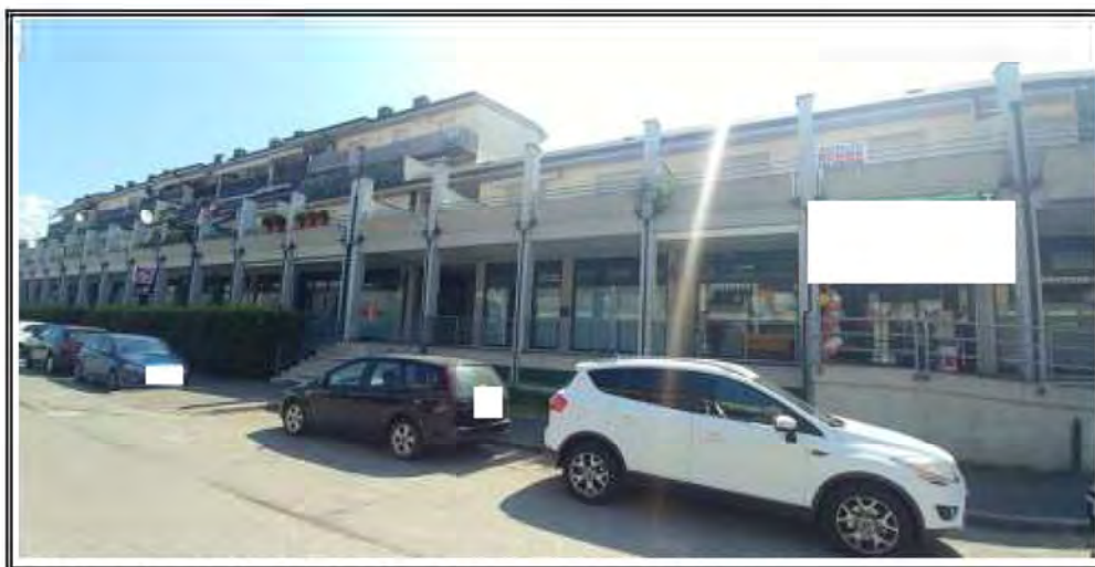
Foto n. 4 – Vista del condominio facciata lato OVEST