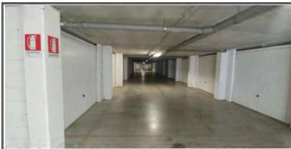
Foto n. 14 – Corridoio di distribuzione comune al piano interrato