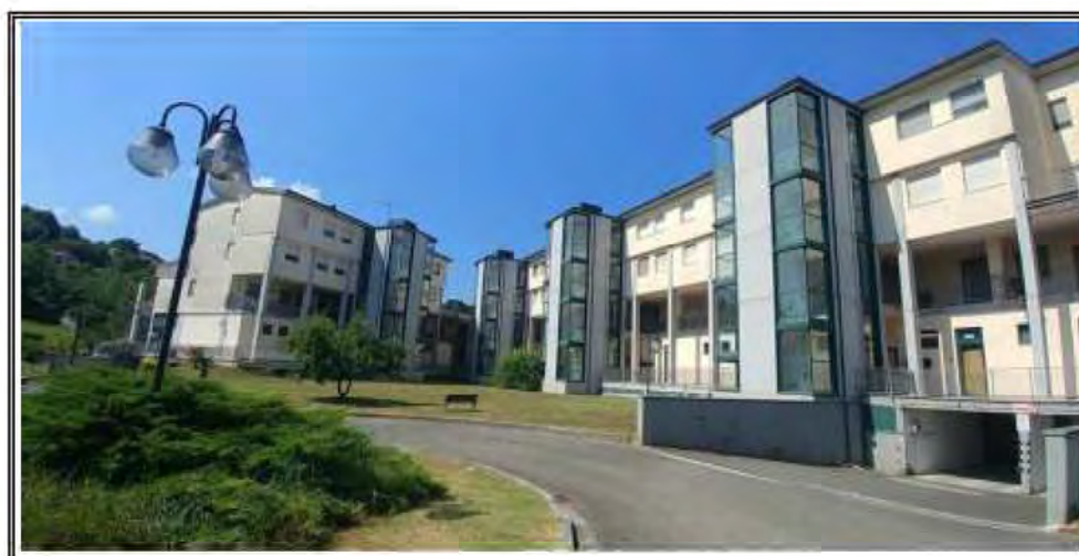
Foto n. 3 – Vista del condominio – Corte comune interna