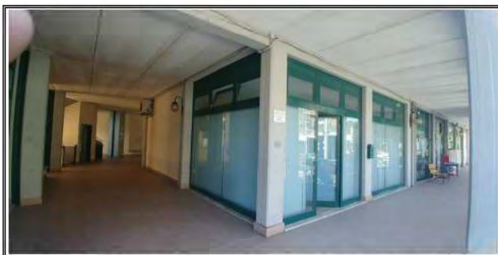
Foto n. 5 – Vista del fondo commerciale oggetto di stima e galleria comune