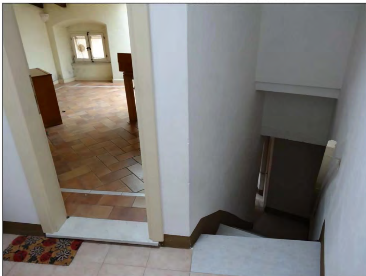
Foto 8 Ingresso Immobile 1 part. 99 sub 12 e vano scala comune