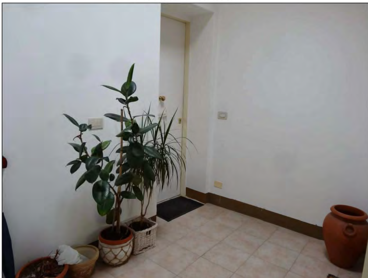
Foto 6 Pianerottolo Piano Terzo – Ingresso Immobile sub 13 – non oggetto di pignoramento