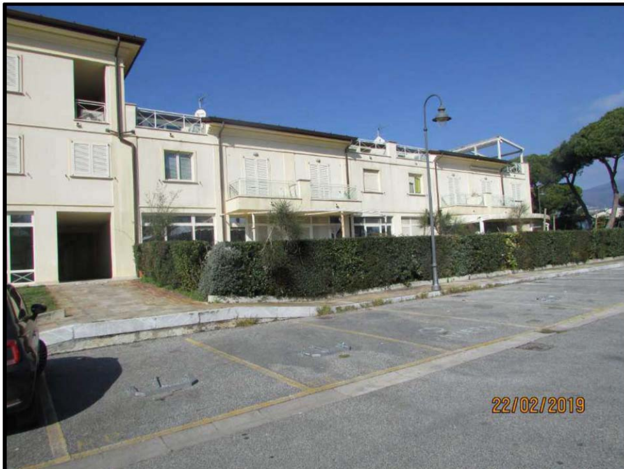
VEDUTA COMPENDIO IMMOBILIARE