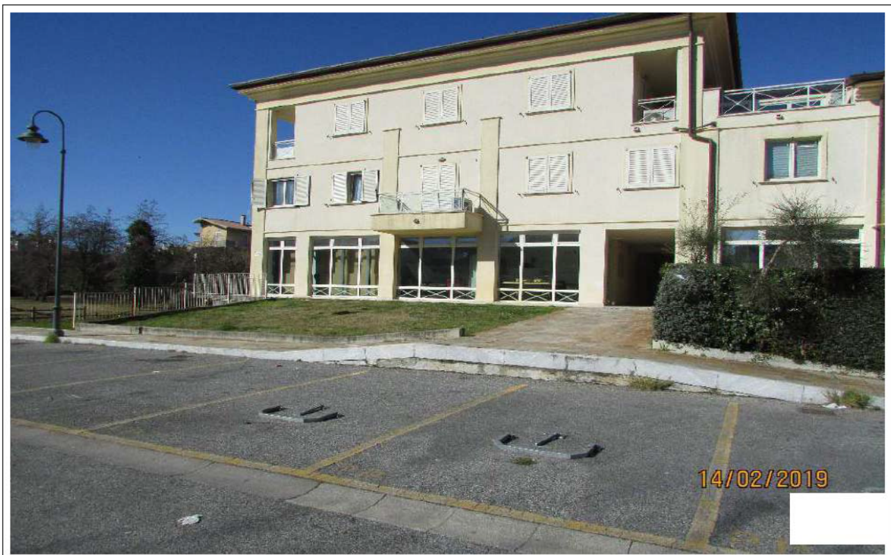
VEDUTA POSTI AUTO SCOPERTI (Fg 21 mapp. 1199 Sub. 72-76)