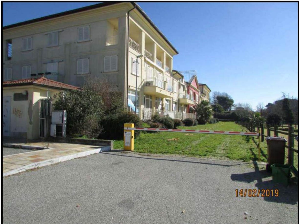
VEDUTA COMPENDIO IMMOBILIARE