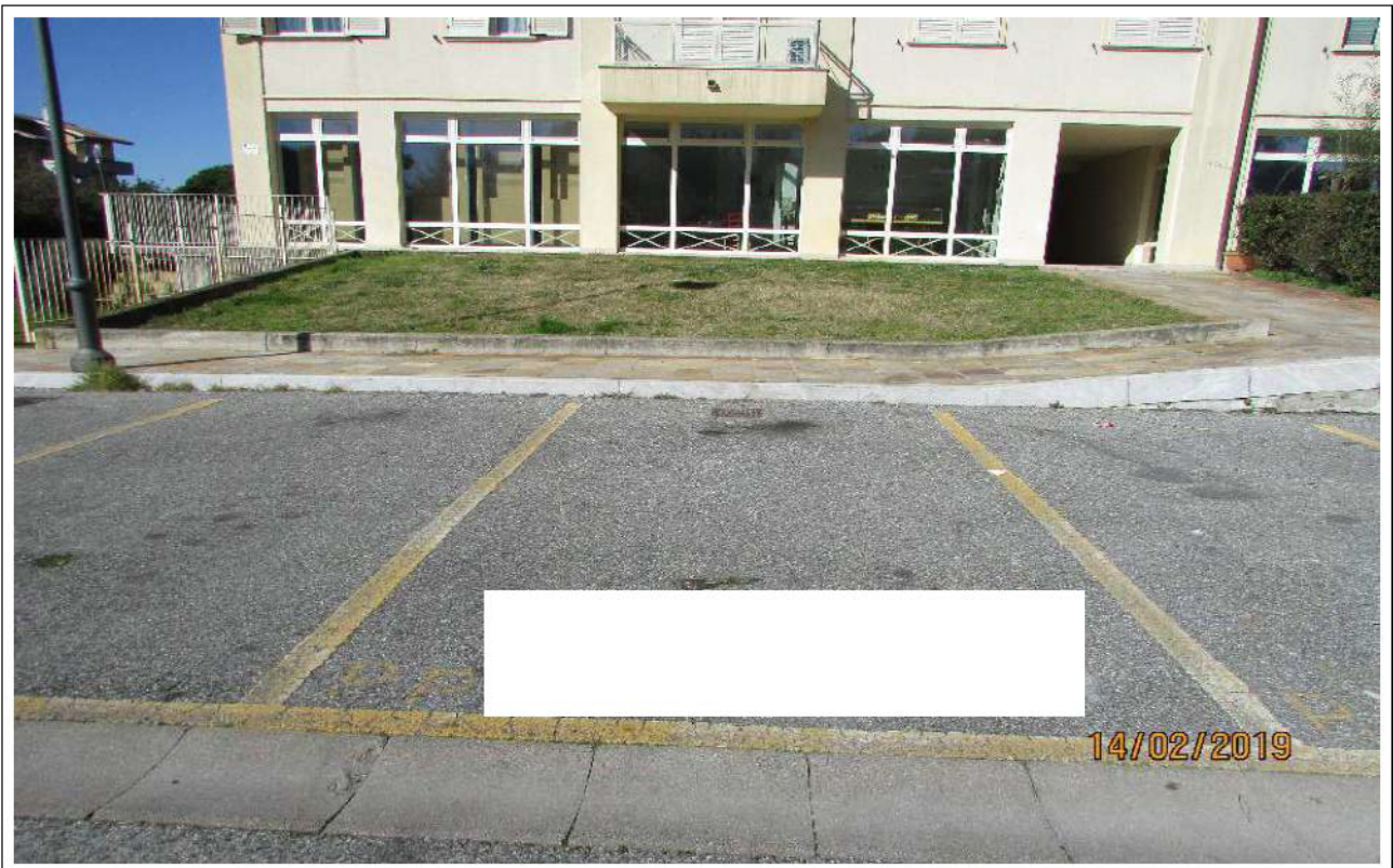
VEDUTA POSTI AUTO SCOPERTI (Fg 21 mapp. 1199 Sub. 76)