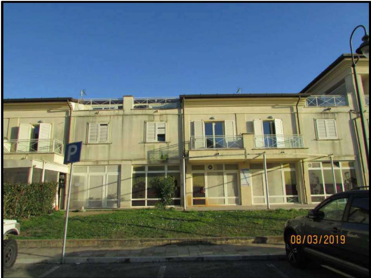
VEDUTA COMPENDIO IMMOBILIARE