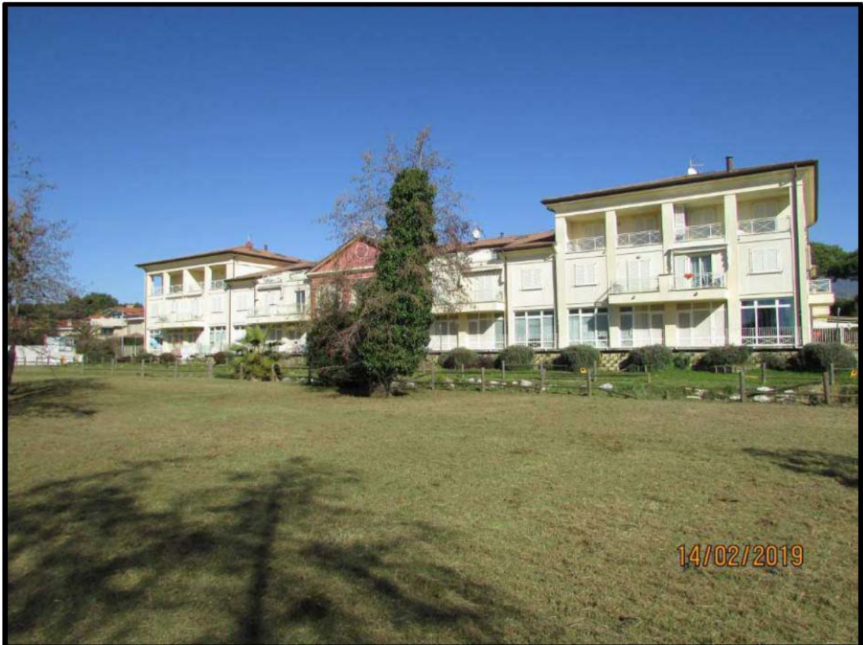
VEDUTA COMPENDIO IMMOBILIARE