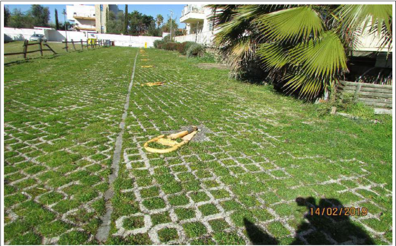
VEDUTA POSTI AUTO SCOPERTI (Fg 21 mapp. 1199 Sub. 88-89-90-91)