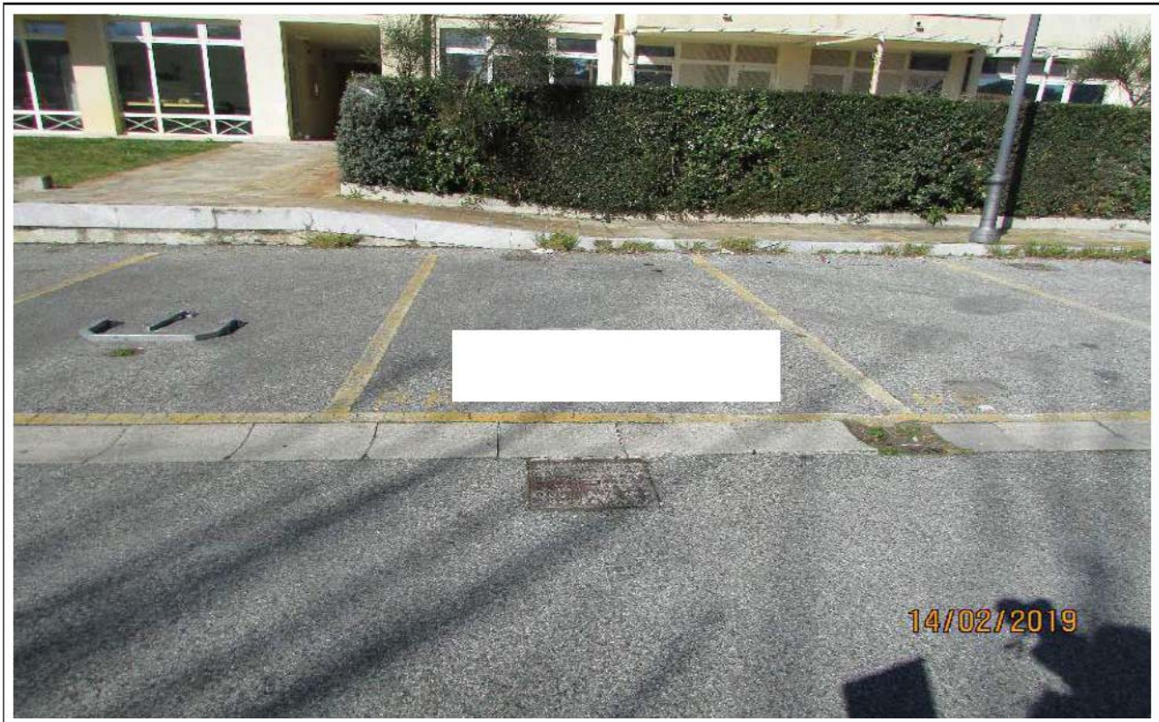
VEDUTA POSTI AUTO SCOPERTI (Fg 21 mapp. 1199 Sub. 72)