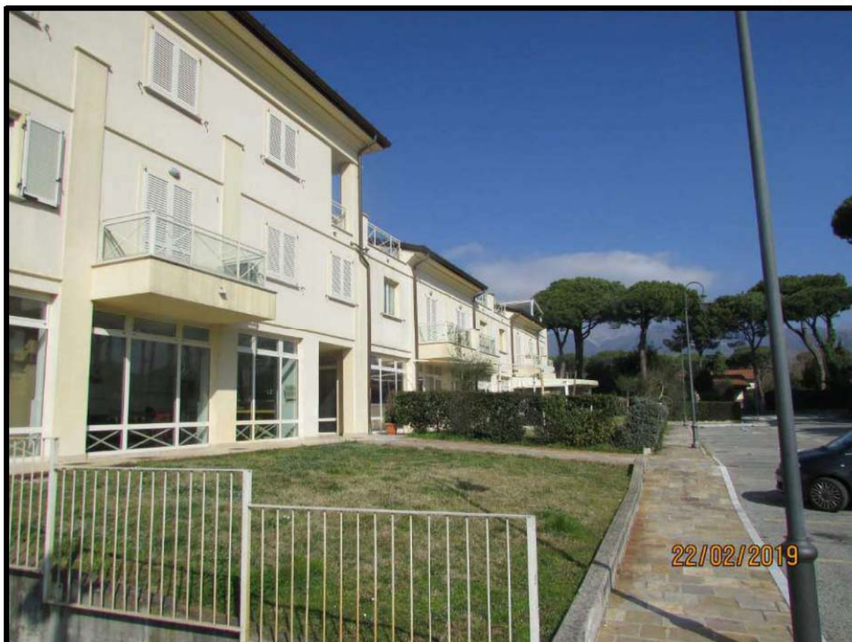
VEDUTA COMPENDIO IMMOBILIARE