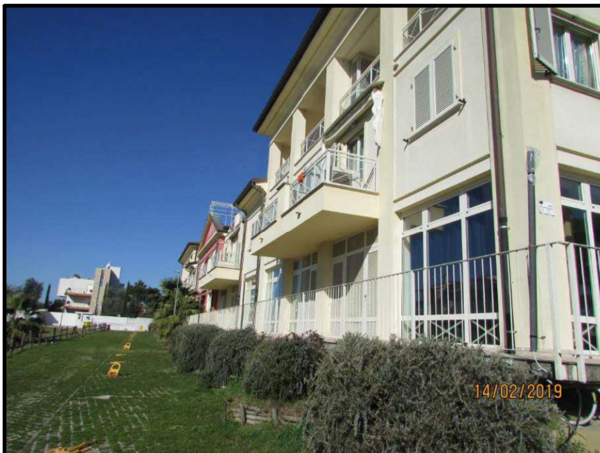
VEDUTA COMPENDIO IMMOBILIARE