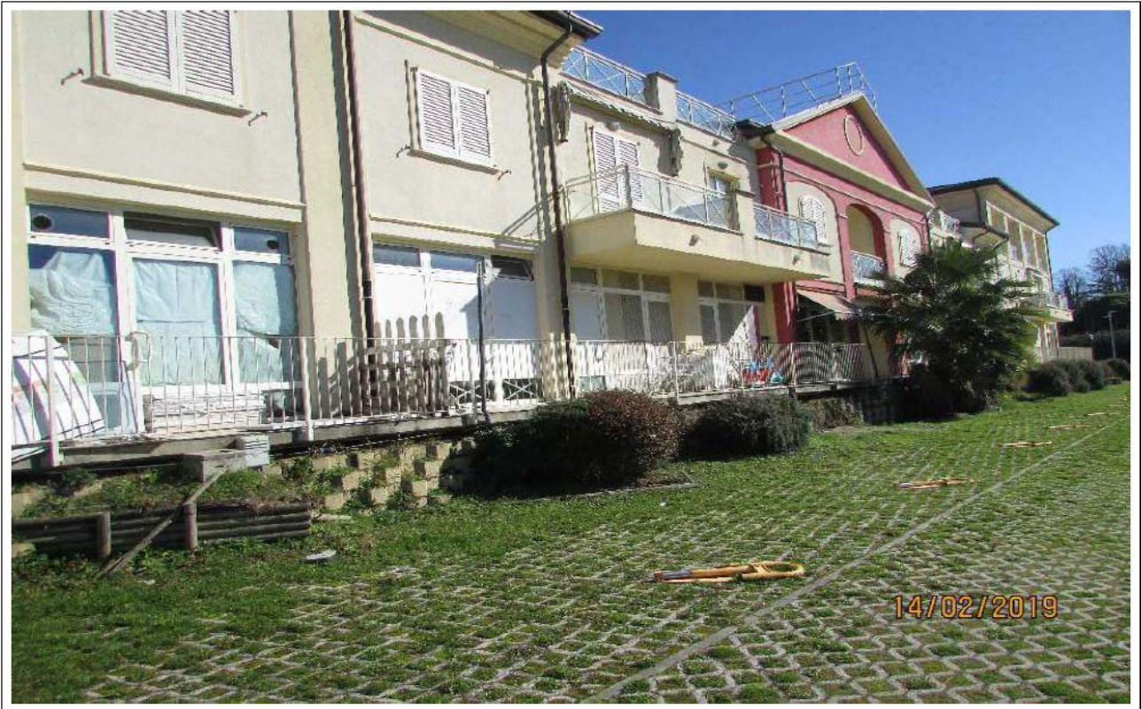
VEDUTA POSTI AUTO SCOPERTI (Fg 21 mapp. 1199 Sub. 88-89-90-91)