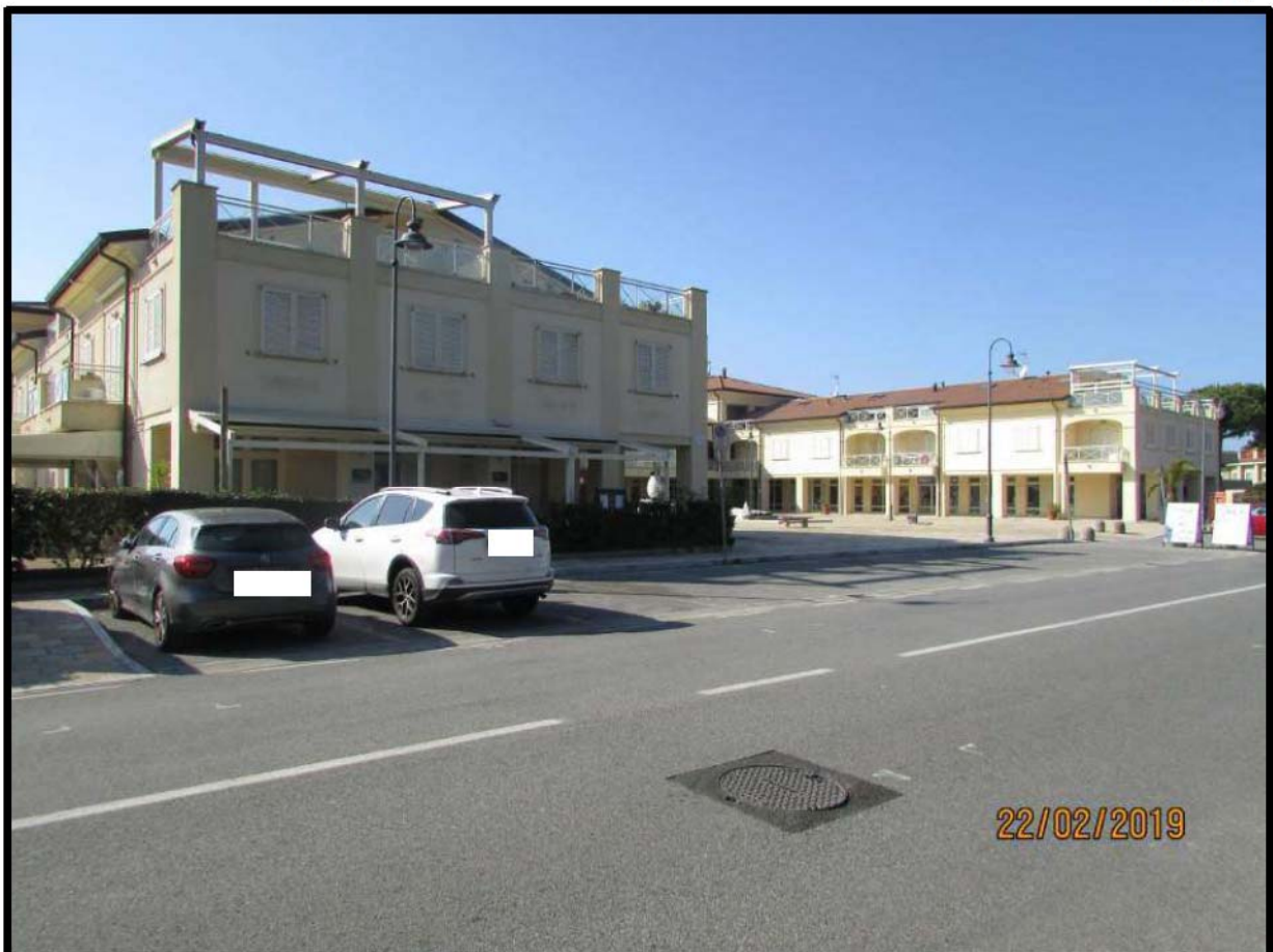
VEDUTA COMPENDIO IMMOBILIARE