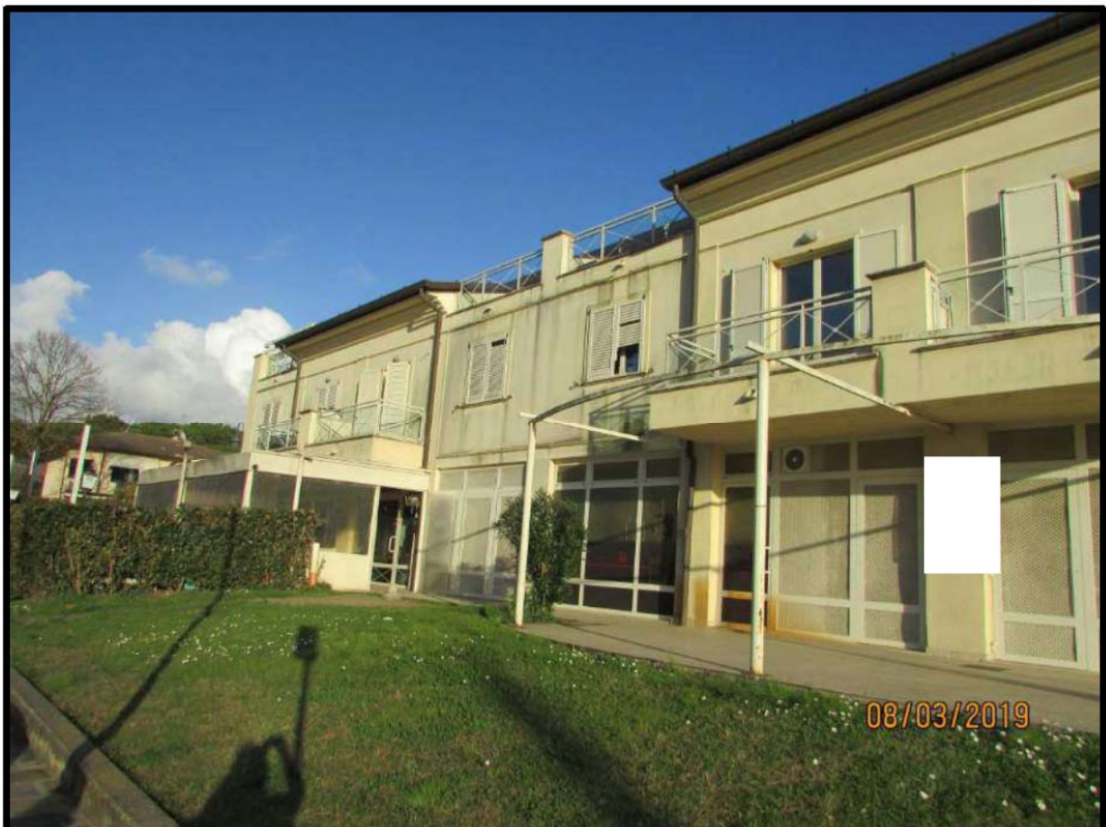
VEDUTA COMPENDIO IMMOBILIARE