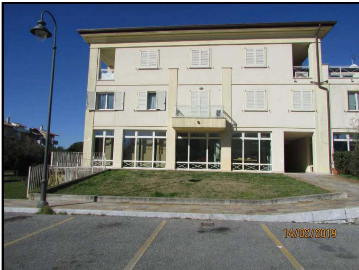
VEDUTA COMPENDIO IMMOBILIARE