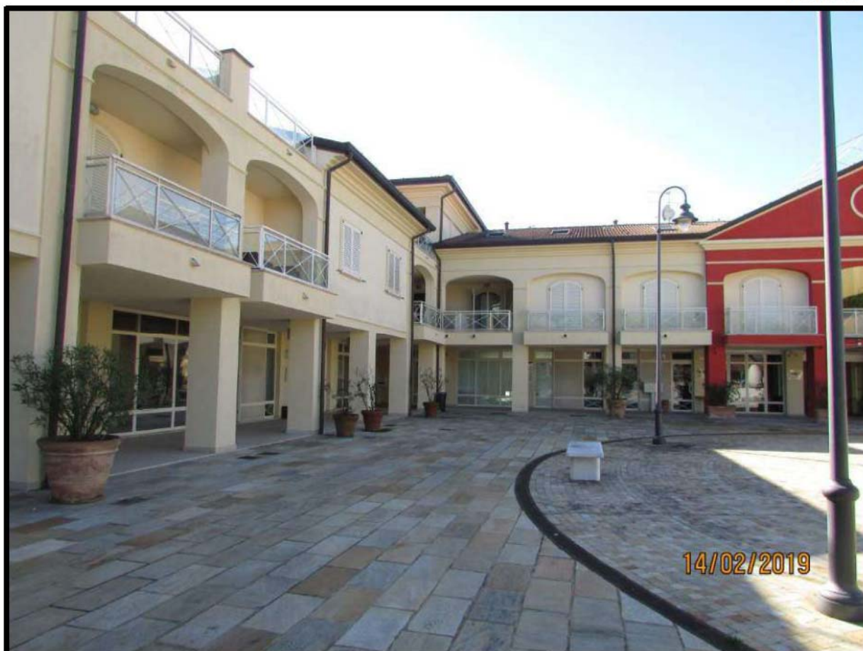
VEDUTA COMPENDIO IMMOBILIARE