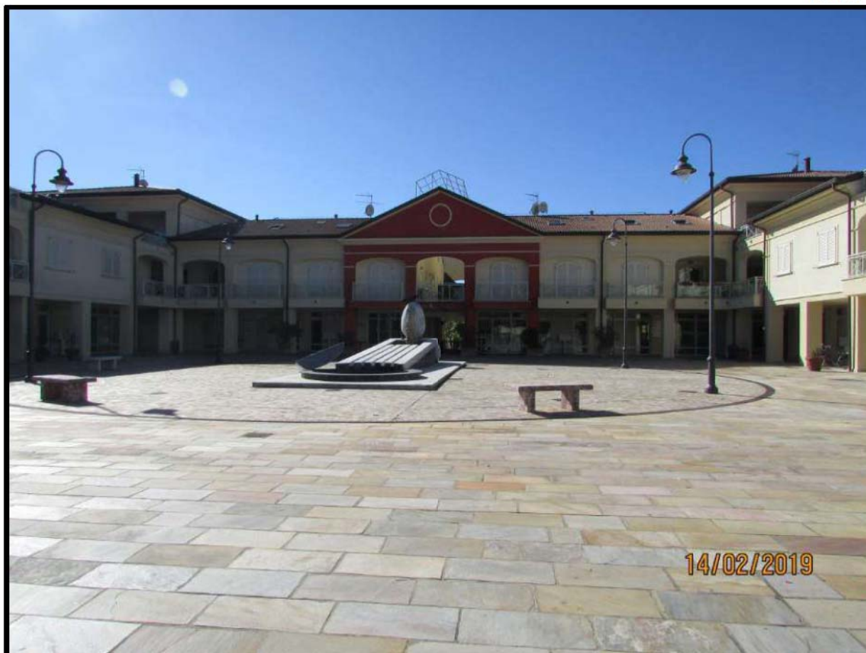
VEDUTA COMPENDIO IMMOBILIARE