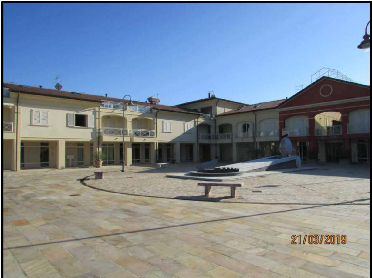
VEDUTA COMPENDIO IMMOBILIARE