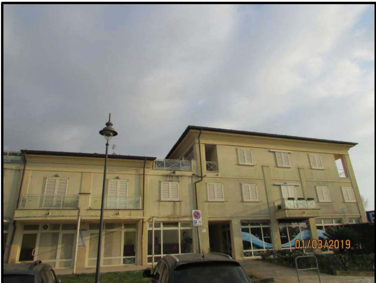
VEDUTA COMPENDIO IMMOBILIARE