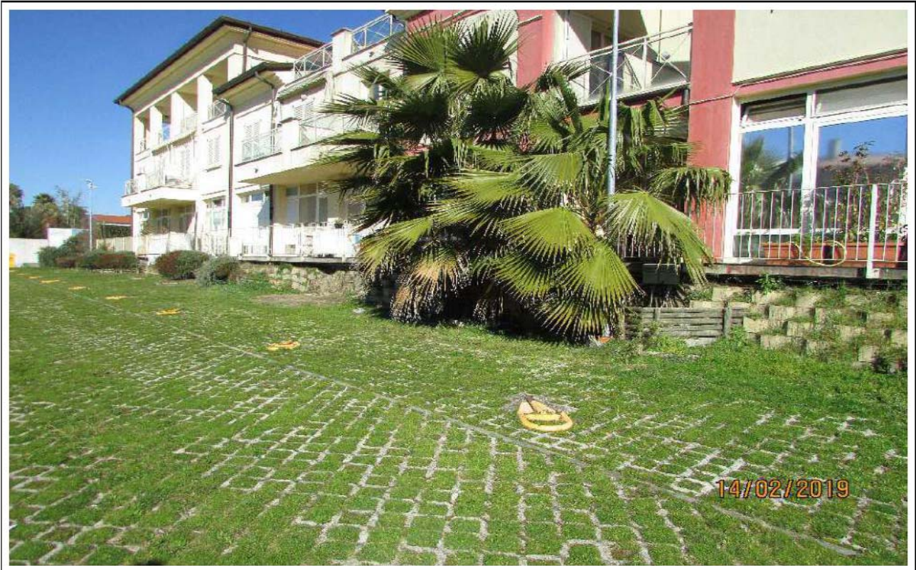
VEDUTA POSTI AUTO SCOPERTI (Fg 21 mapp. 1199 Sub. 88-89-90-91)