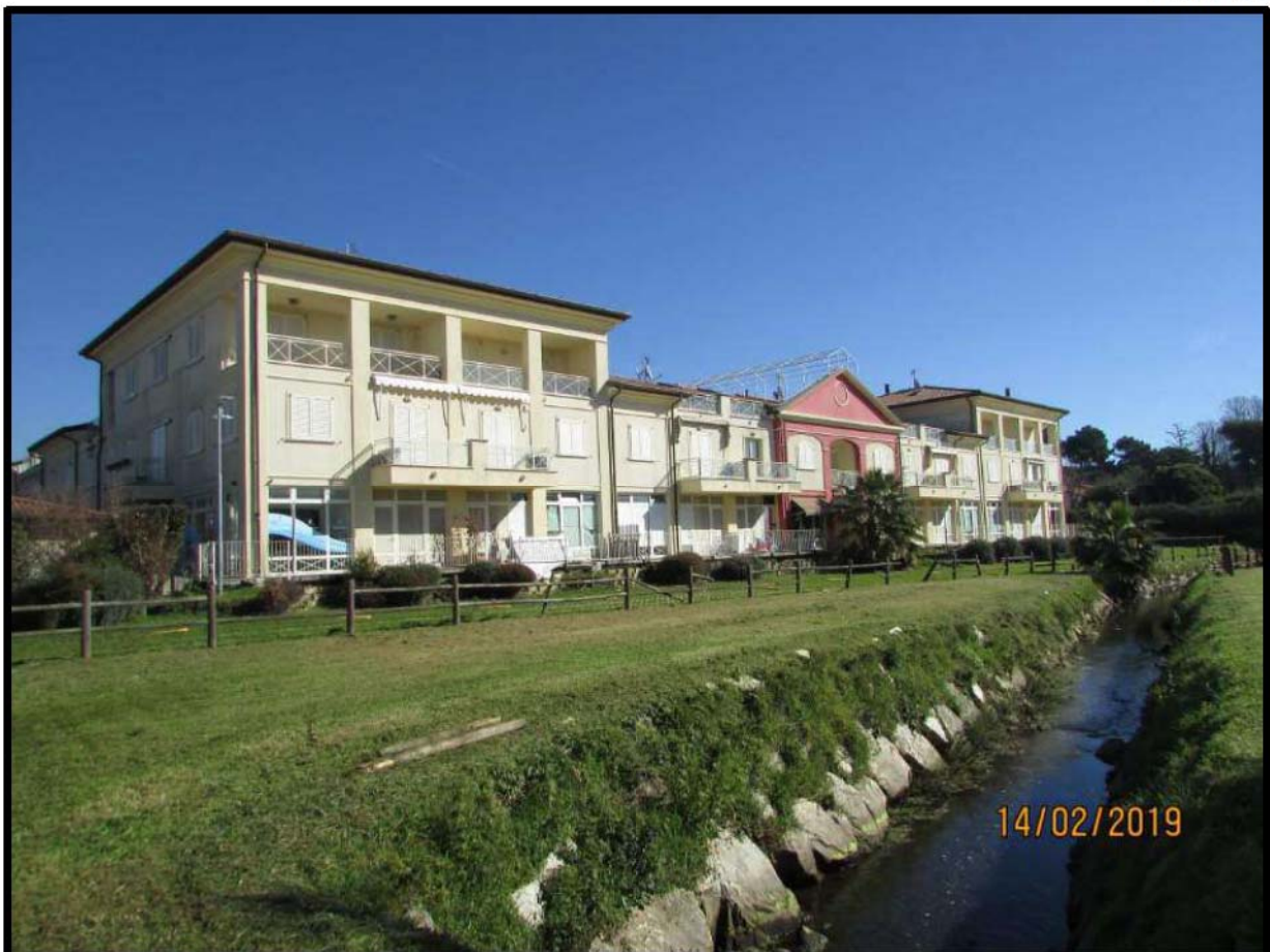
VEDUTA COMPENDIO IMMOBILIARE